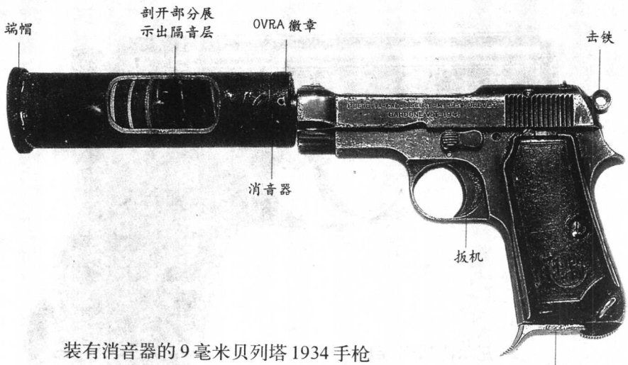
装有消音器的9毫米贝列塔1934手枪