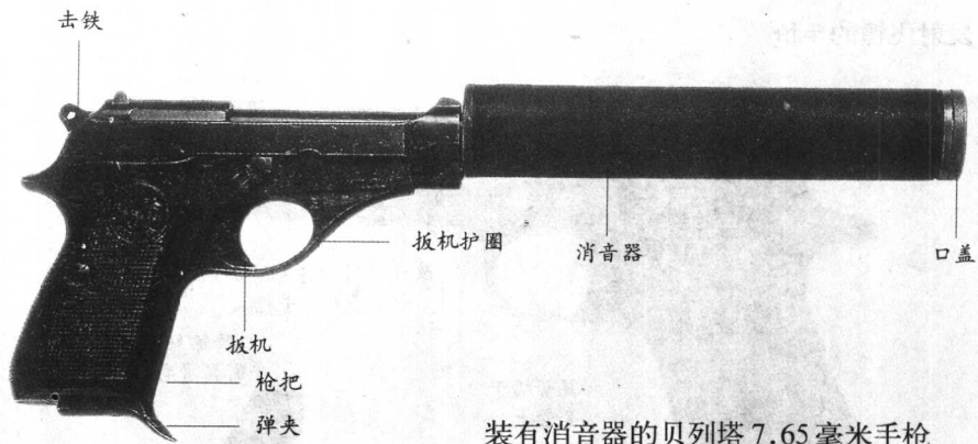
装有消音器的贝列塔7.65毫米手枪