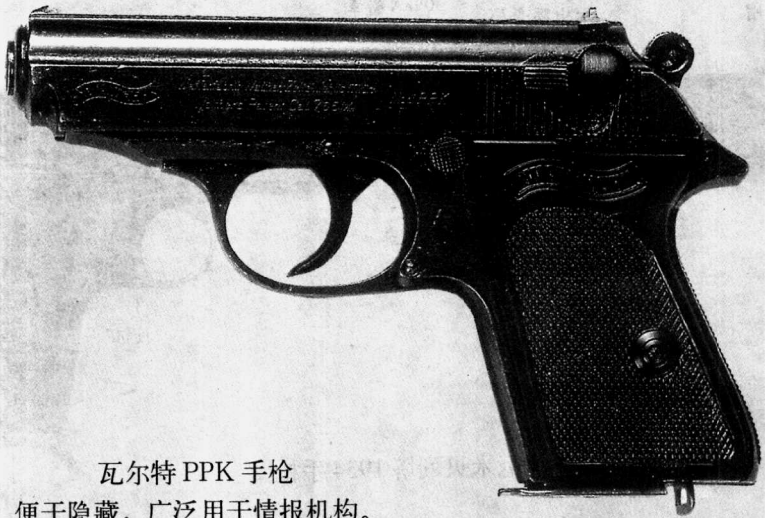
瓦尔特 PPK 手枪 便于隐藏，广泛用于情报机构。