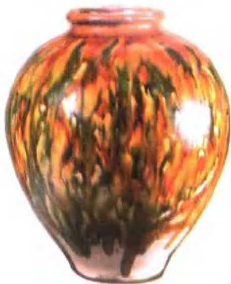
图版 19 唐三彩罐