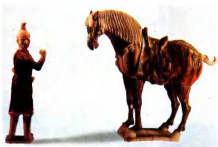
图版 9 唐三彩牵马俑及马