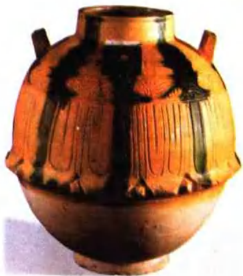
图版 22 唐三彩罐