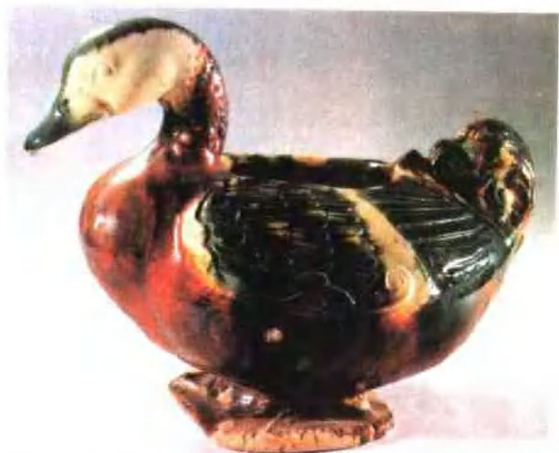
图版 13 唐三彩鸳鸯壶