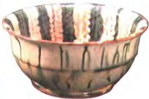
图版 14 唐三彩碗