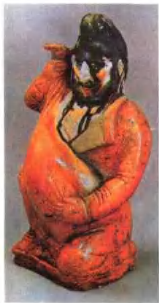
图版 11 唐三彩胡人抱瓶俑