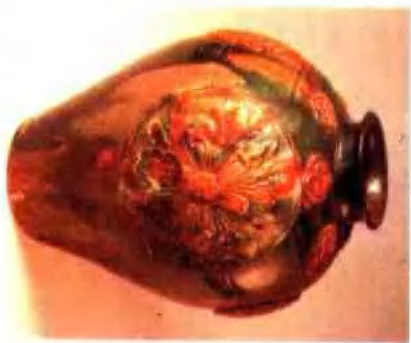
图版 3 唐三彩贴花陶罐