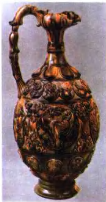
图版 20 唐三彩凤首壶