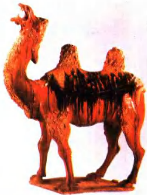
图版 21 唐三彩骆驼