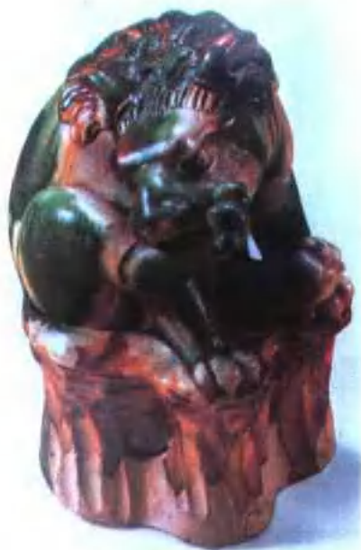
图版 16 唐三彩狮子