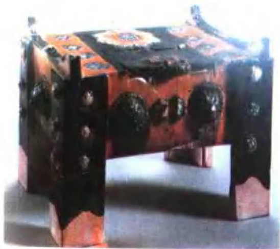
图版 15 唐三彩钱柜