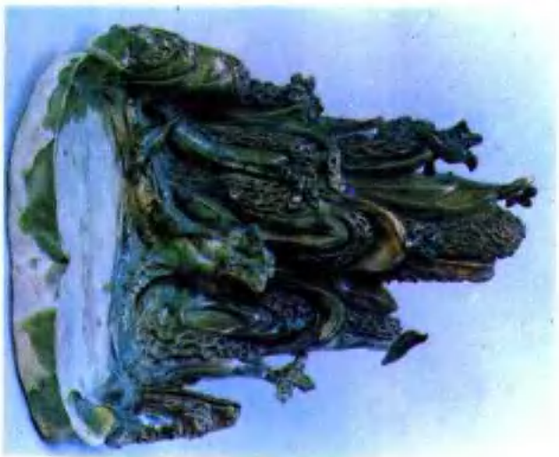
图版 2 唐三彩假山水池