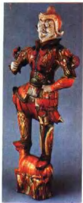
图版 6 唐三彩力士俑