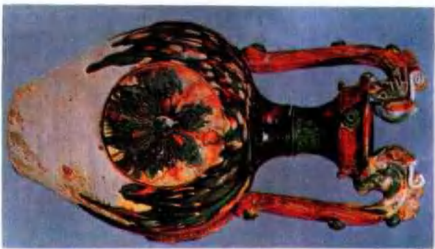
图版 1 唐三彩双龙柄壶