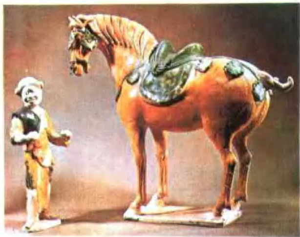
图版 10 唐三彩马及牵马俑