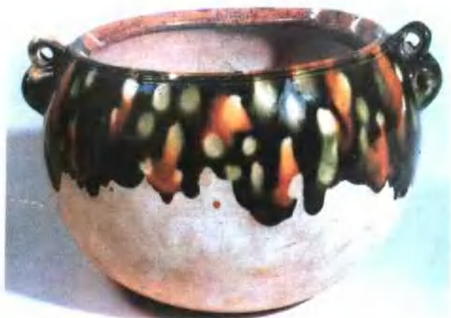
图版 12 唐三彩双系罐