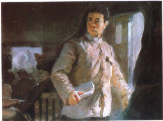
弃医从文 (油画) 张洪年 作