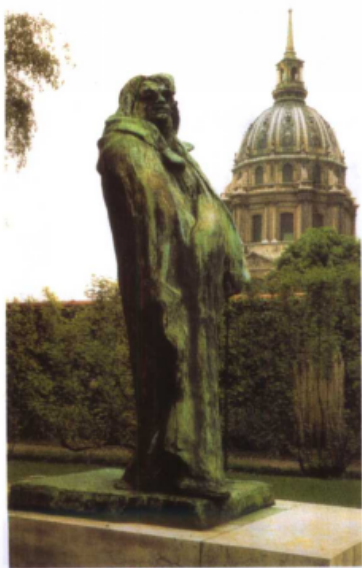
左下图 巴尔扎克像 (雕塑) 〔法〕罗丹 作