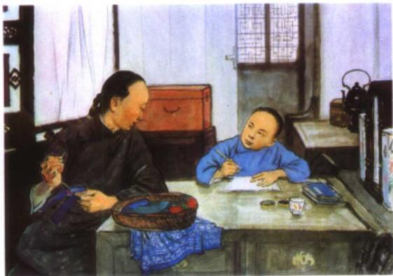
幼年时期的鲁迅 (中国画) 宗其香 作