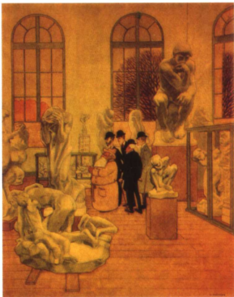
右下图 思想者 (雕塑) 〔法〕罗丹 作