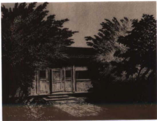
北京鲁迅故居 (版画) 荒烟 作