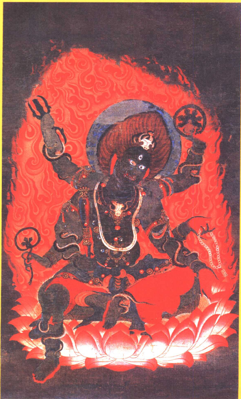
乌枢沙摩明王(秽迹金刚)