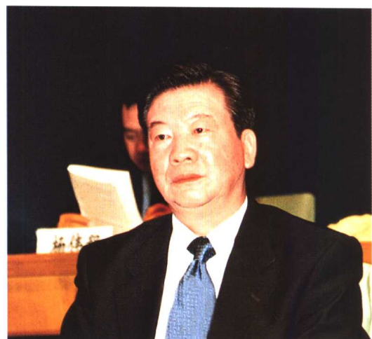
▲ 最高人民检察院副检察长梁国庆出席“中国律师2000年大会”