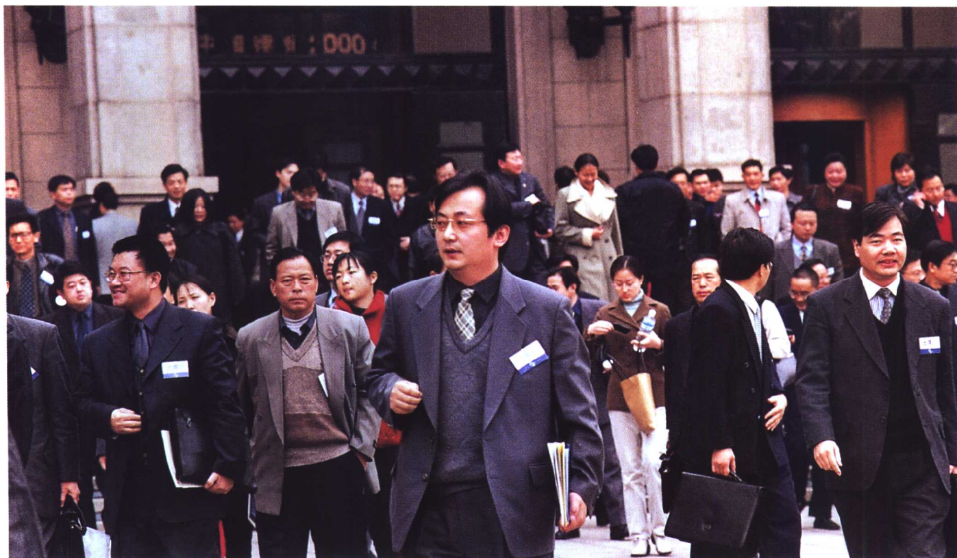
▲ “中国律师 2000 年大会”开幕式结束后，各地参会律师走出会场