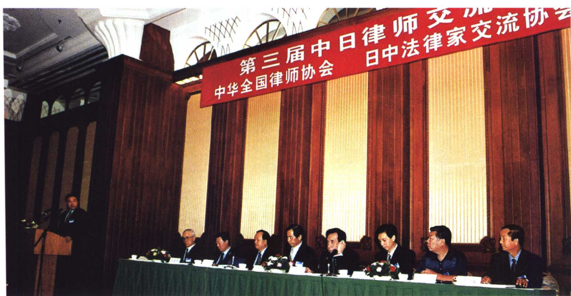
▲ 第三届中日律师交流大会在大连召开