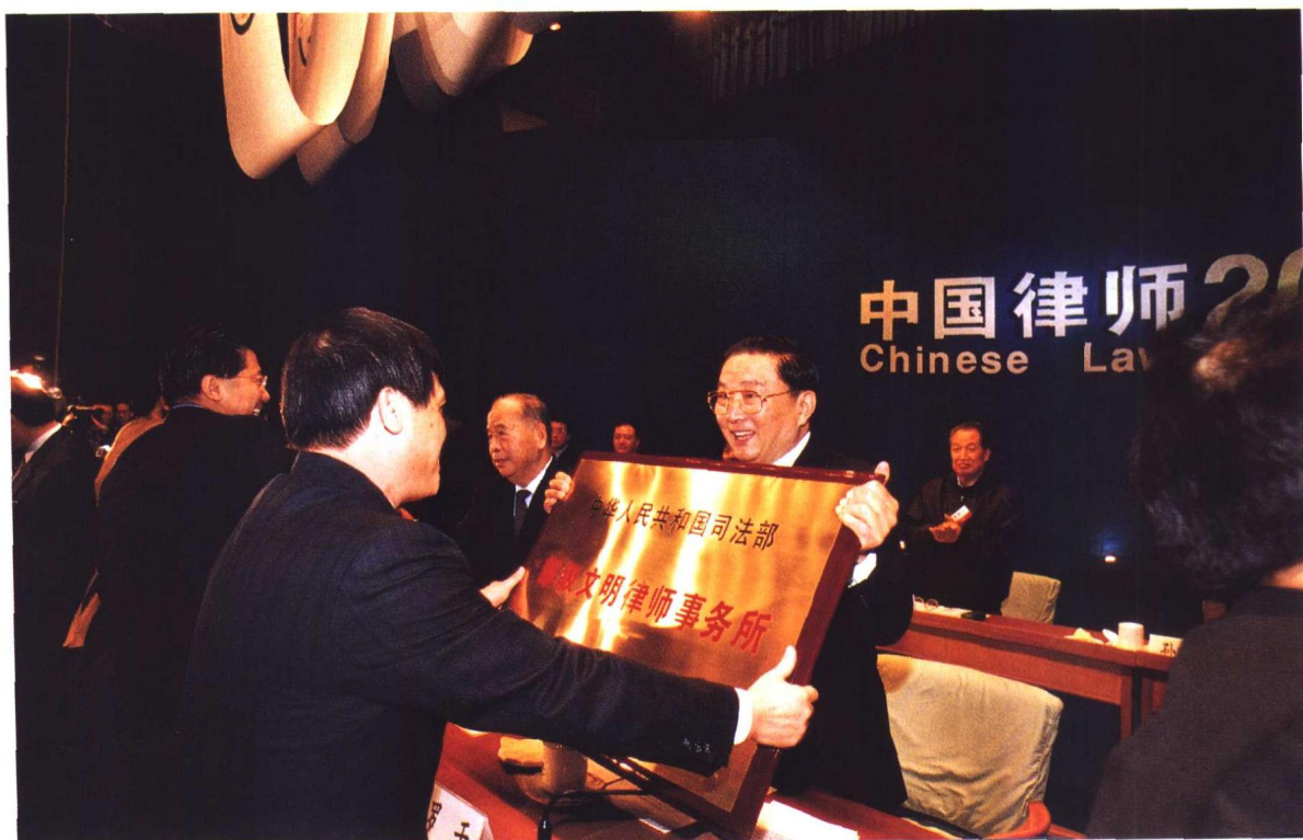
▲ 中共中央政治局委员、国务委员、中央政法委书记罗干在“中国律师2000年大会”上为司法部评选的部级文明律师事务所颁奖