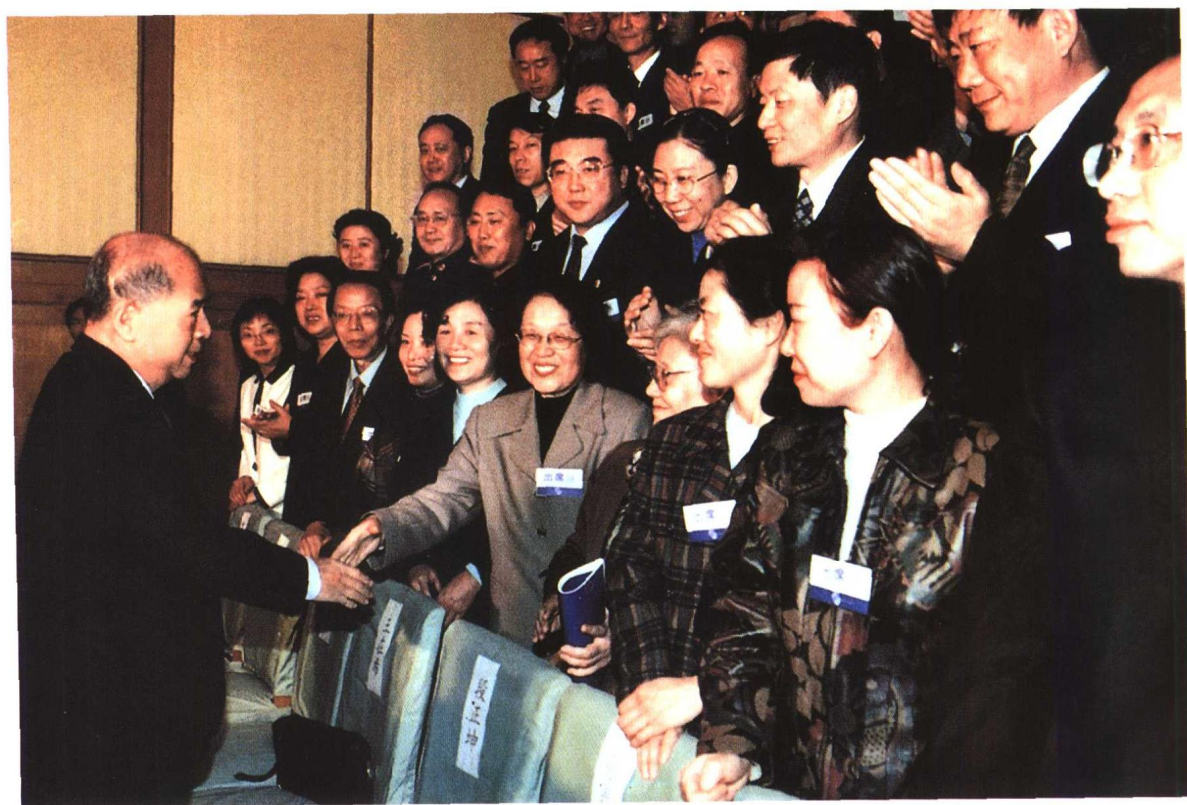
▲ 中共中央政治局常委尉健行出席“中国律师2000年大会”并接见参会的各地律师协会会长、秘书长及全国律师协会常务理事