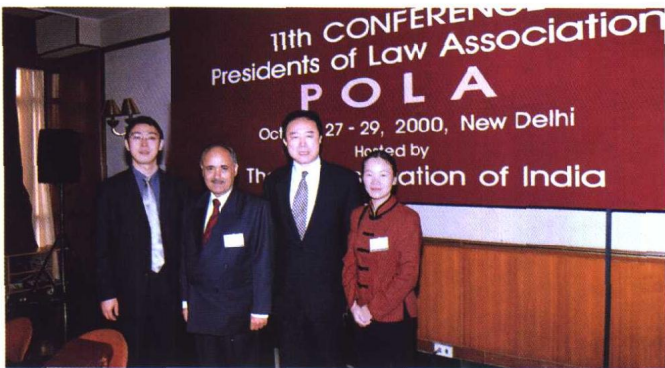
▲ 全国律协副会长于宁(右二)在第八届亚洲国家律协会长会议上与东道主印度律师协会荣誉秘书长巴辛先生合影