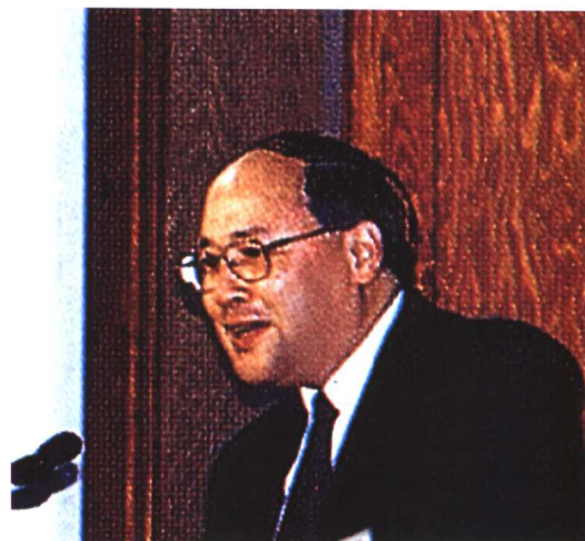
▲ 中国证监会首席顾问梁定邦教授在“中国律师2000年大会”上演讲