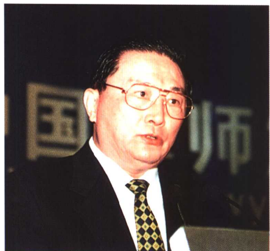
▲ 中共中央政治局委员、中央政法委书记罗干出席“中国律师2000年大会”