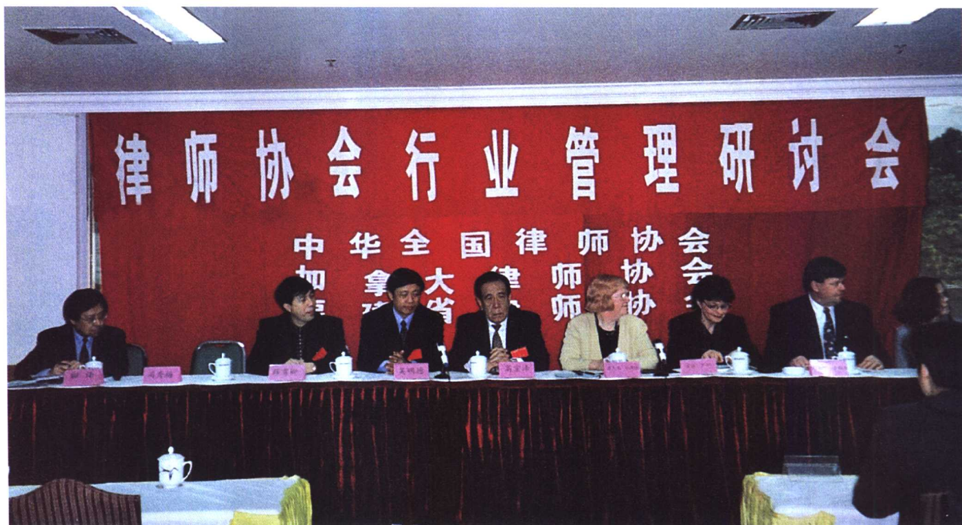
中华全国律师协会、加拿大律师协会、福建省律师协会于2000年3月17日—19日在福建省福州市举办了“律师协会行业管理讲习班”