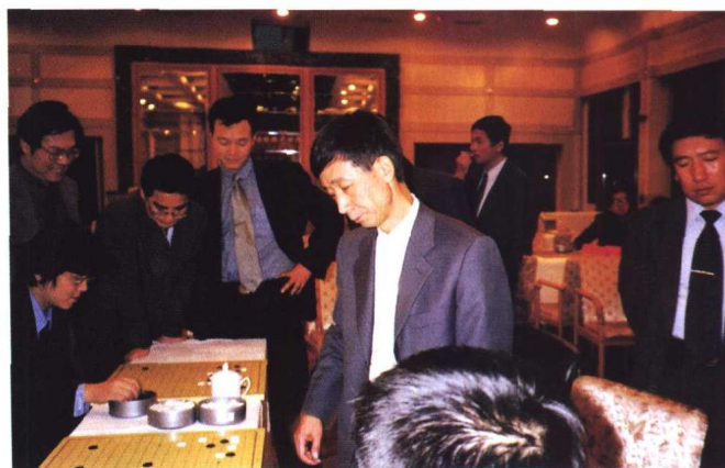
▲ 围棋协会副会长、国手王汝南八段(中)与律师下指导棋