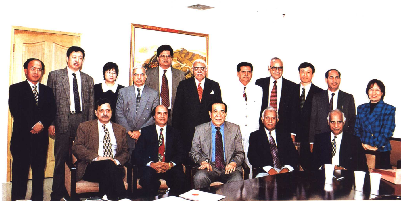
中华全国律师协会会长高宗泽与巴基斯坦律师会谈并合影