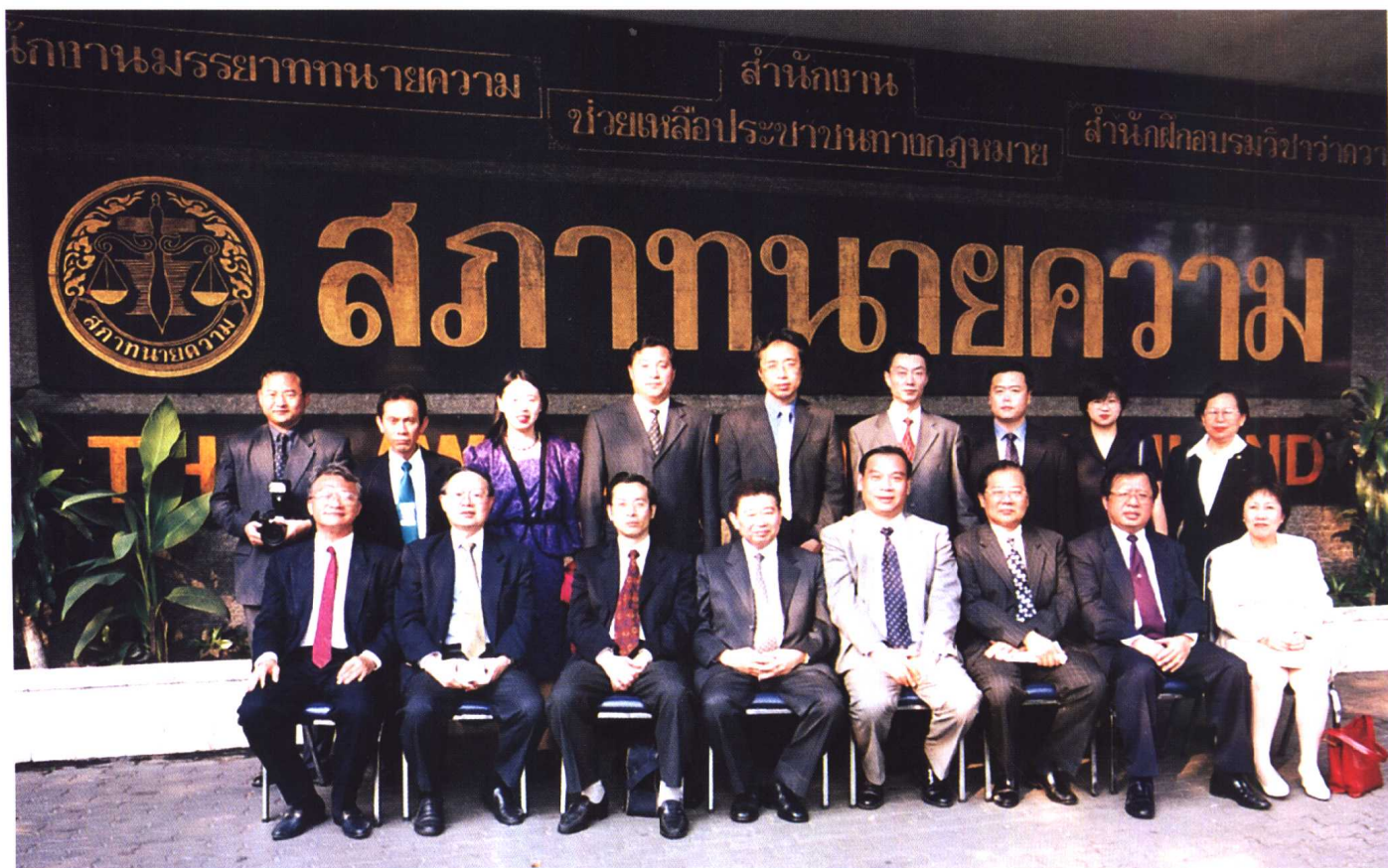
中国律师代表团访问泰国，与泰国律师院长高梧桐(前排左四)合影