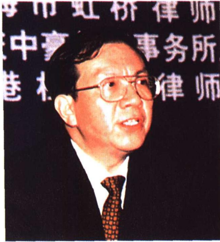
▲ 中共上海市委副书记刘云耕在“新世纪中国律师发展战略研讨会”上讲话