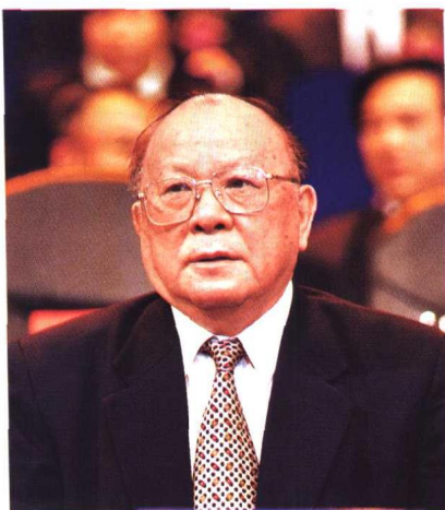
▲著名法学家、中国政法大学教授江平在“中国律师2000年大会”上演讲