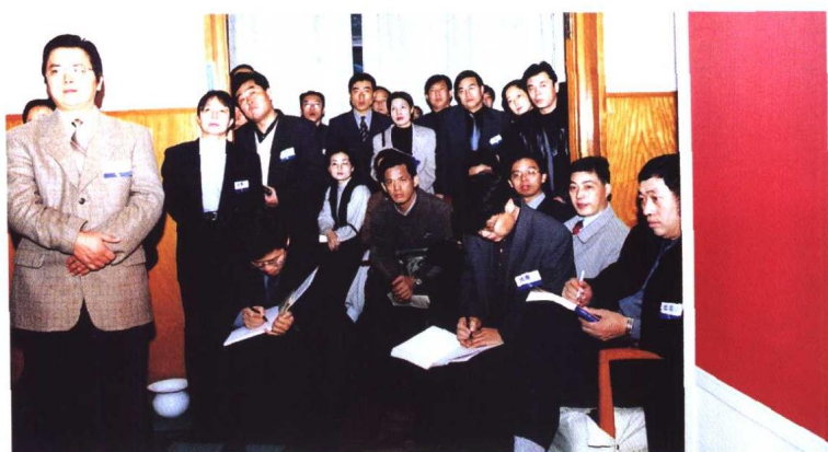
⑤ “中国律师2000年大会”分会场之二