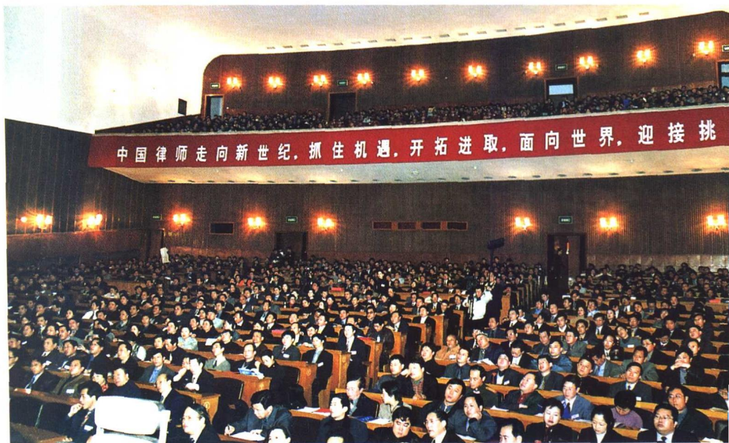
▶“中国律师2000年大会”开幕式会场