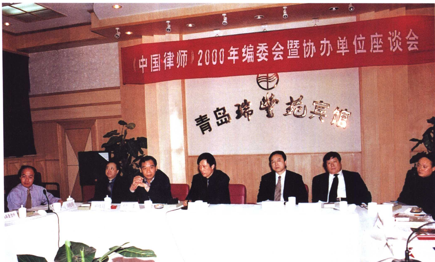
《中国律师》杂志社在青岛召开编委会暨协办单位座谈会