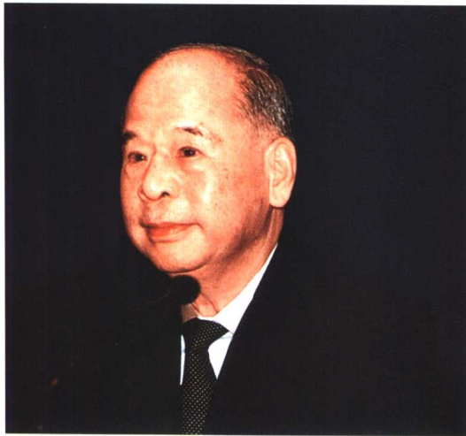
▲ 中共中央政治局常委尉健行出席“中国律师2000年大会”