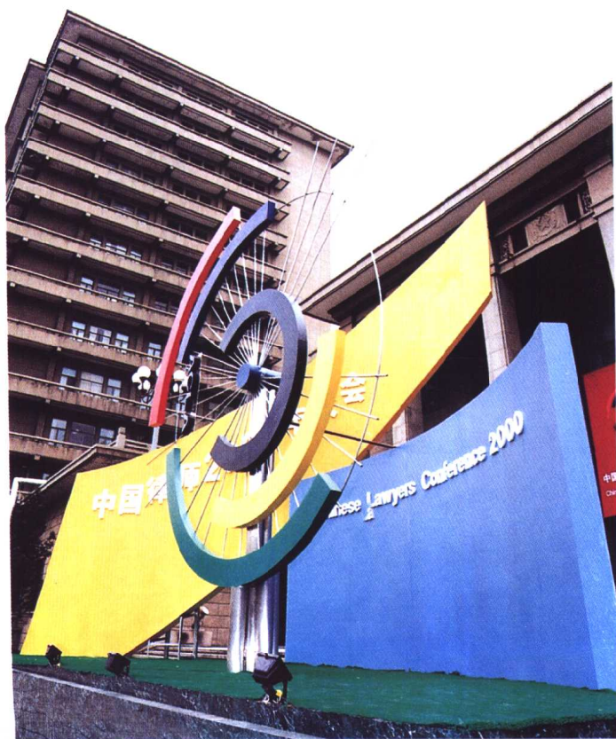
◀ “中国律师 2000 年大会”会标