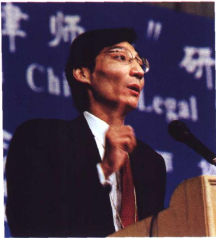
▲ 全国律协副会长朱洪超在“WTO与中国律师业”研讨会上演讲