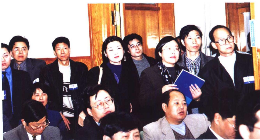
⑥ “中国律师2000年大会”分会场之三