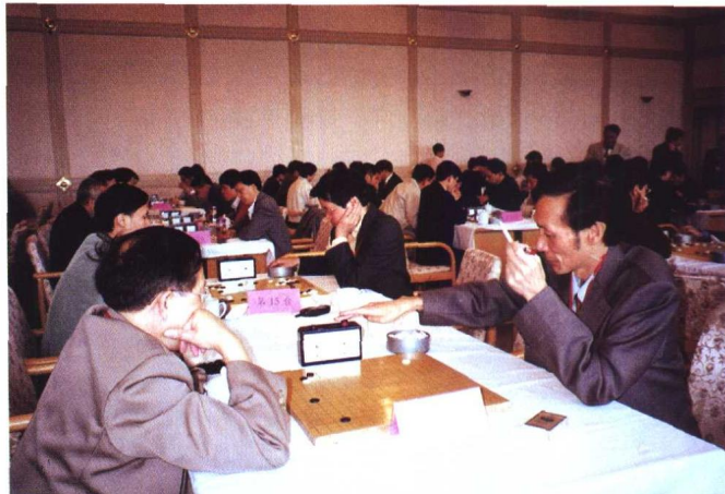
▲ “大红鹰杯”全国律师围棋赛对弈现场