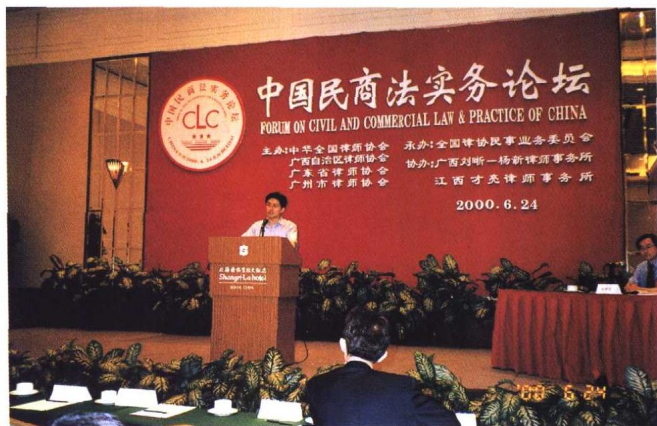
▲ 全国律协民事委员会在广西北海召开2000年年会