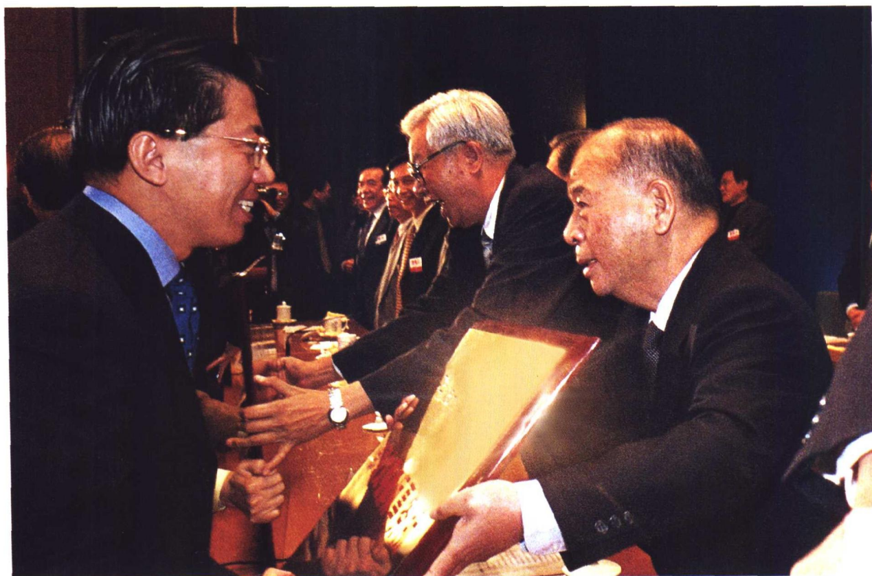
▲ 中共中央政治局常委尉健行在“中国律师2000年大会”上为司法部评出的部级文明律师事务所颁奖