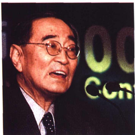
▲著名经济学家、北京学历以宁教授在“中国律师2000年大会”上演讲