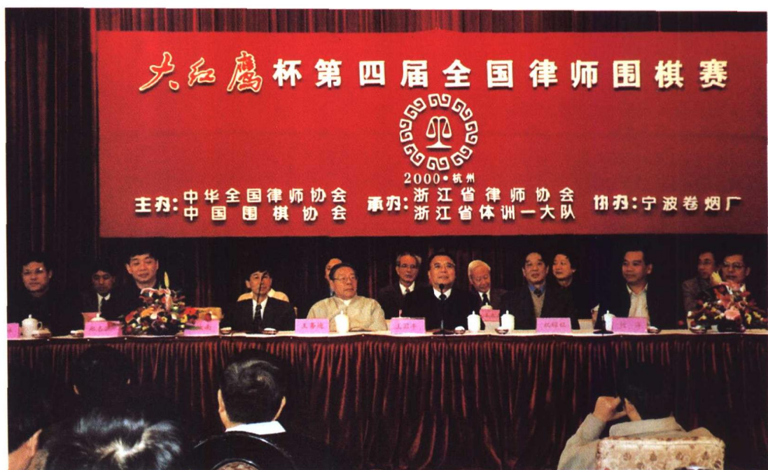
▶ “大红鹰杯”第四届全国律师围棋赛开幕式