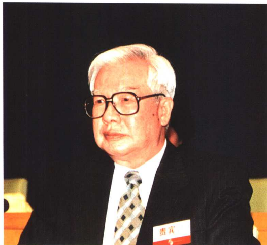
▲ 全国政协副主席罗豪才出席“中国律师2000年大会”