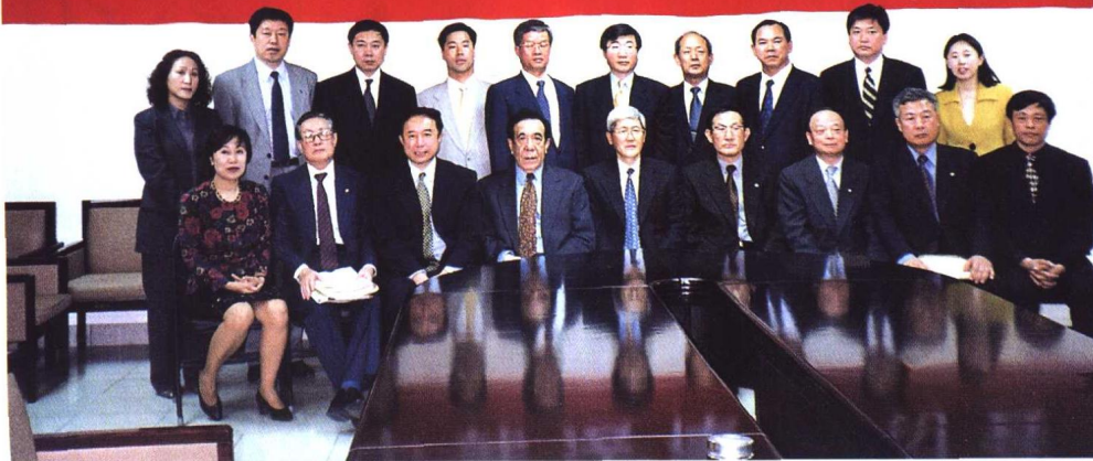
④ 2000年5月, 来京参加第五届中韩律师研讨会的韩国律师与中国律师合影