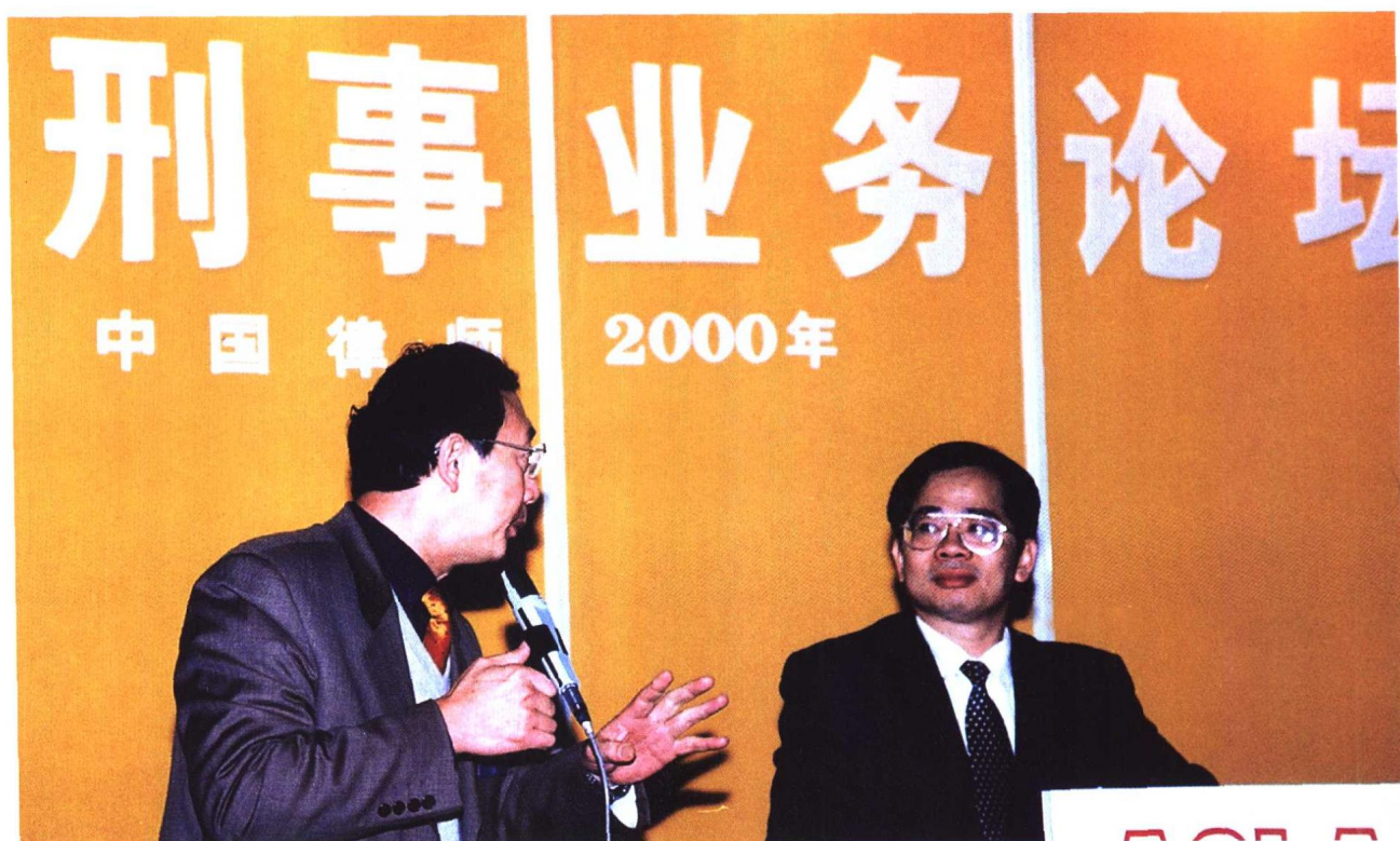
④ “中国律师2000年大会”分会场之一——刑事业务论坛