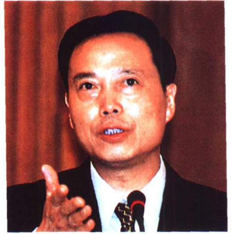
▲ 全国人大常委会法工委副主任胡康生在“新世纪中国律师发展战略研讨会”上作报告