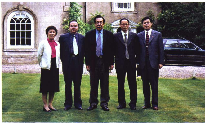
▲ 2000年5月,全国律协代表团访英时在英国律师会会员登记处合影