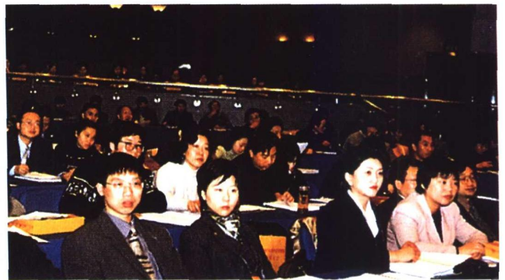
“WTO与中国律师业”研讨会会场