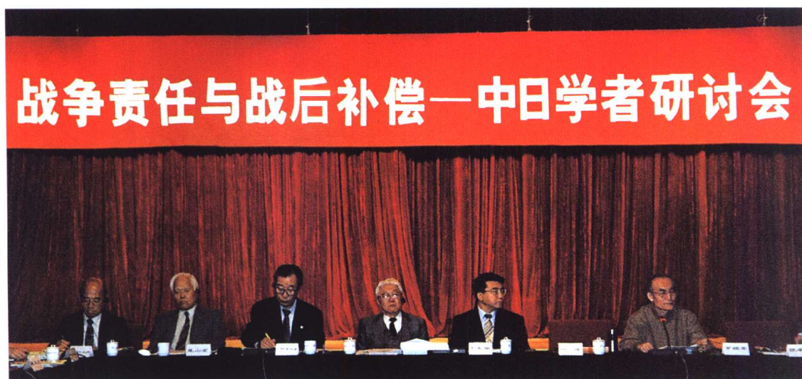
▲ 中日友协、全国律协在抗日战争纪念馆召开“战争责任与战后赔偿”中日学者研讨会