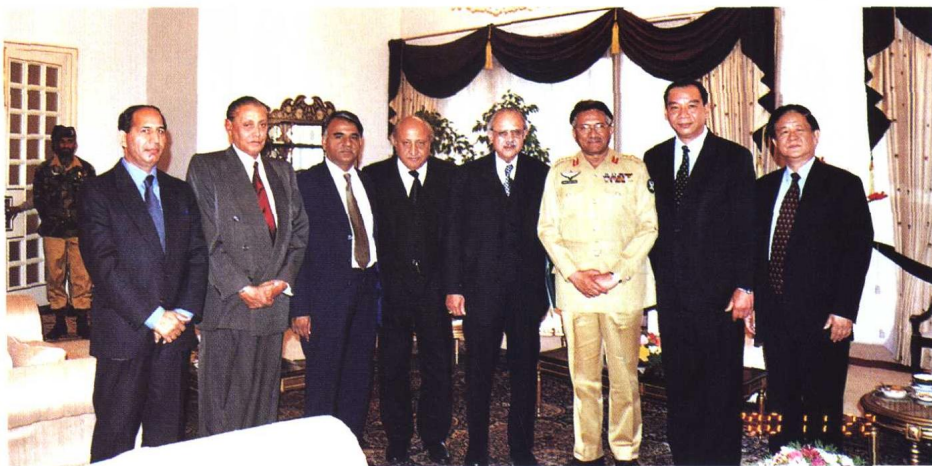
▲ 巴基斯坦首席执行官穆沙拉夫接见到访的中国律师代表团并合影留念(右二为中国律师代表团团长付洋,右一为中国驻巴基斯坦大使陆树林)