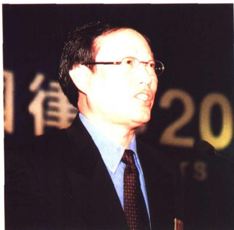
▲建设部建筑司司长金德钧在“中国律师2000年大会”主会场演讲