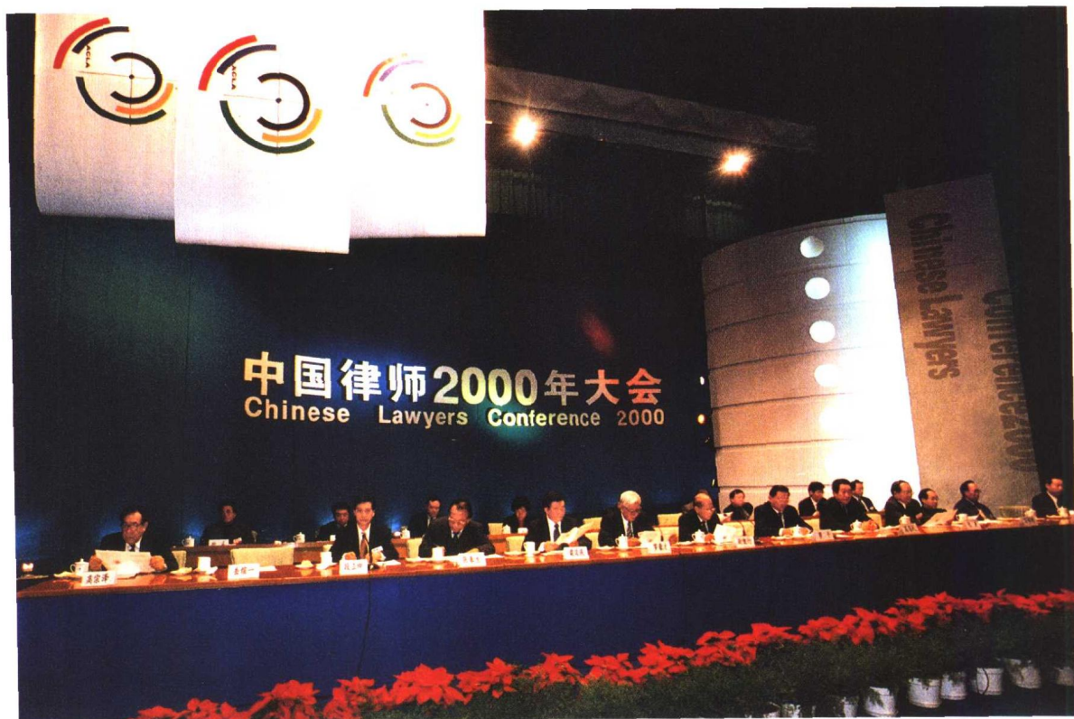
▲ “中国律师2000年大会”主席台