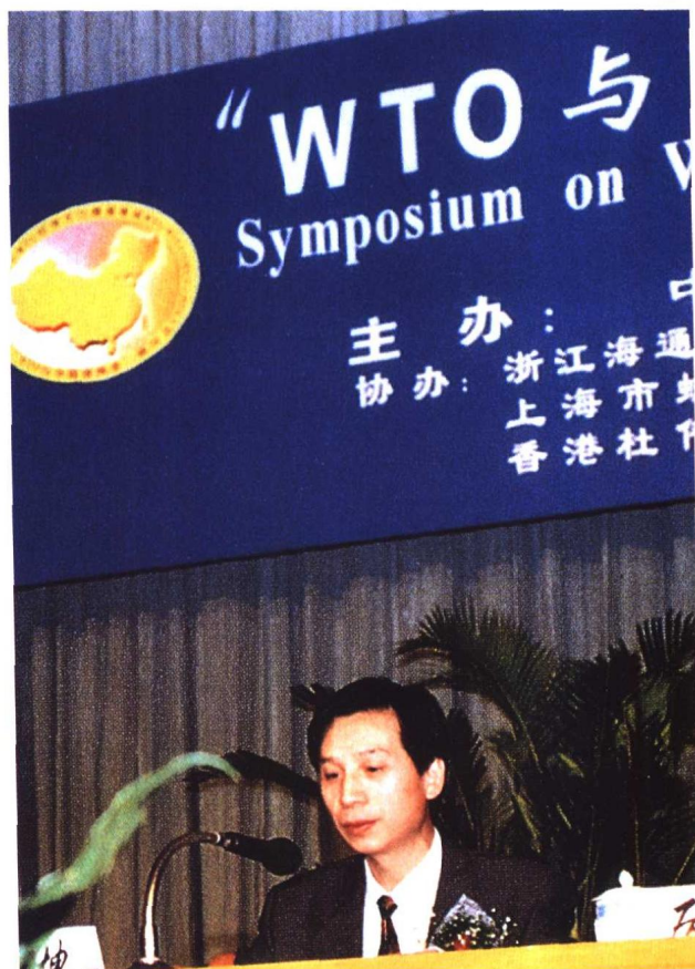
司法部段正坤副部长在“WTO与中国律师业”研讨会上发表重要讲话