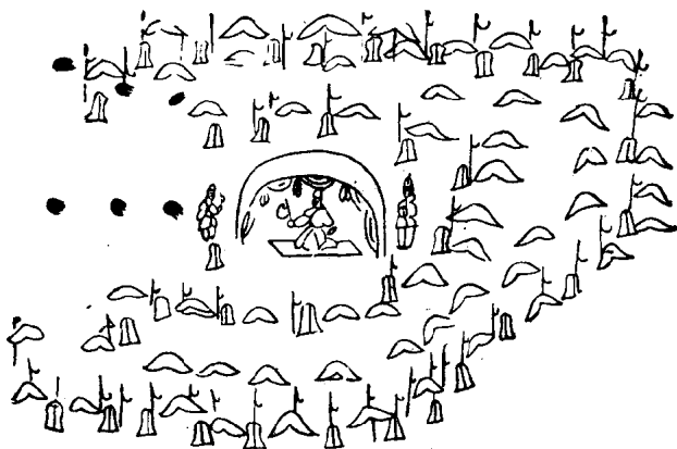
甘肃嘉峪关魏晋墓砖画 营垒

1972年在甘肃嘉峪关发掘清理了8座魏晋时期的墓葬。内有壁画600多幅,内容有农桑畜牧、屯垦、出猎、宴乐等,反映出这一时期现实生活的各个方面。由于经济发展,人口也有显著增加。公元265年,晋代魏时,魏、蜀共有94万户,537万余口,加上吴亡时的户口,三国合计,共有146万余户,767万余口。太康元年(280)平吴后,全国户口共有245万余户,1600余万口。到太康三年(282)共有377万户。户口增加是比较快的。当然这数字并不完全可靠,其中有一部分是豪强荫底下的户口被检括出来的。