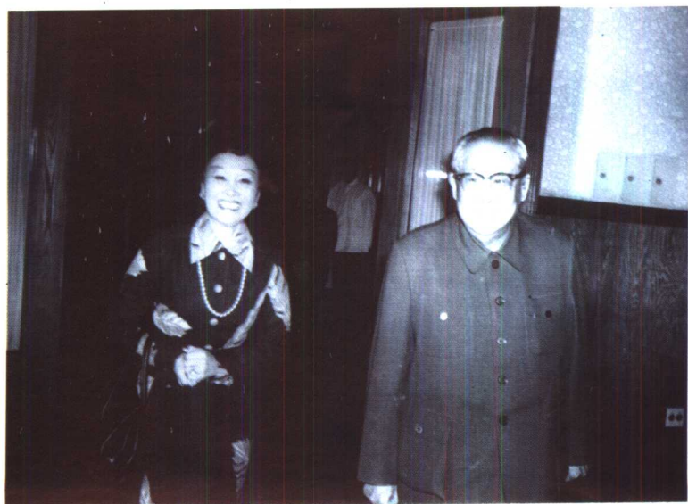
1981年，陈香梅与舅舅廖承志在北京。