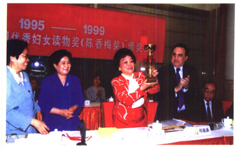
陈香梅在中国优秀妇女读物颁奖会上。