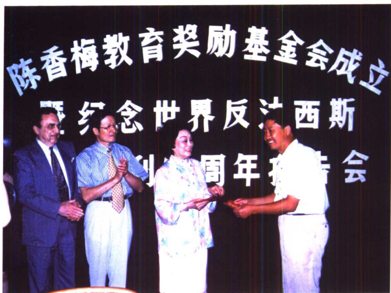
在陈香梅教育奖励基金会成立会上。