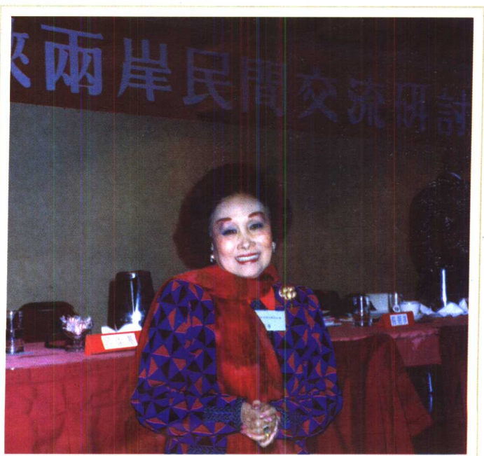
在促进海峡两岸民间交流研讨会上讲话。