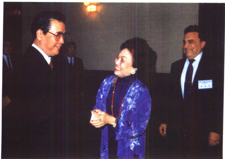
1996年1月23日，陈香梅、郝福满在钓鱼台与李鹏相叙。