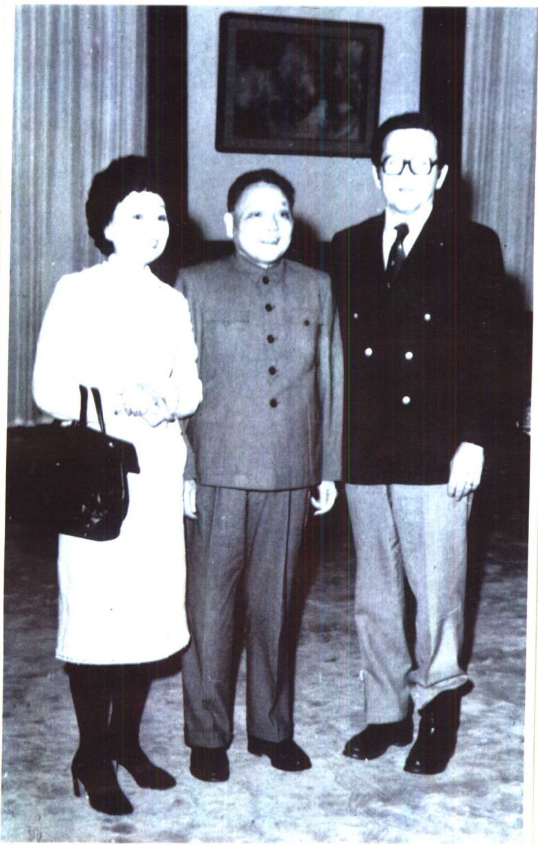
1981年元旦，邓小平在北京人民大会堂设宴招待里根总统的特使陈香梅女士。