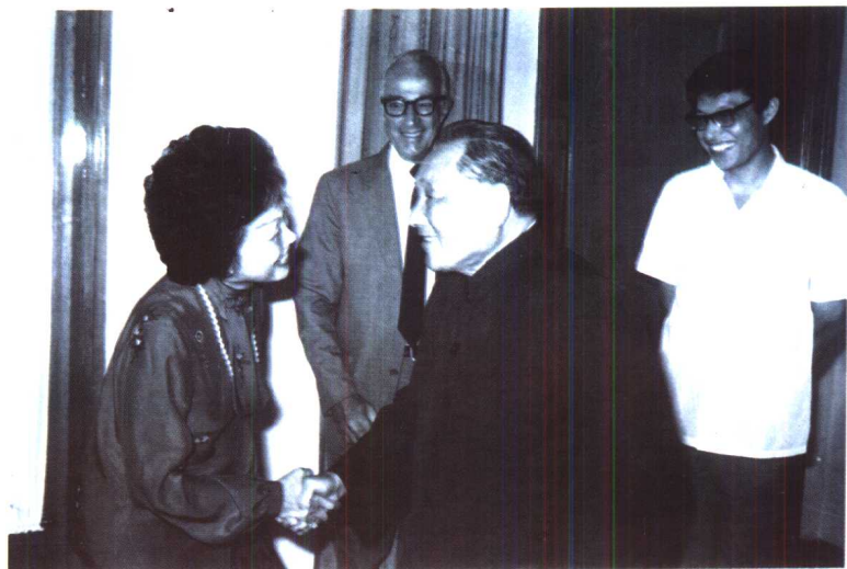
1983年，邓小平再次接见陈香梅。