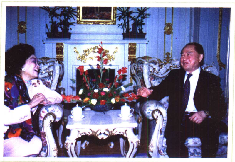
1996年在上海和老友汪道涵谈海峡两岸关系。