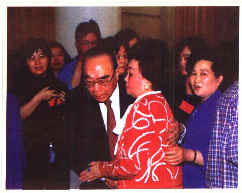
1999年，陈香梅与中国首任驻美大使柴泽民畅谈。