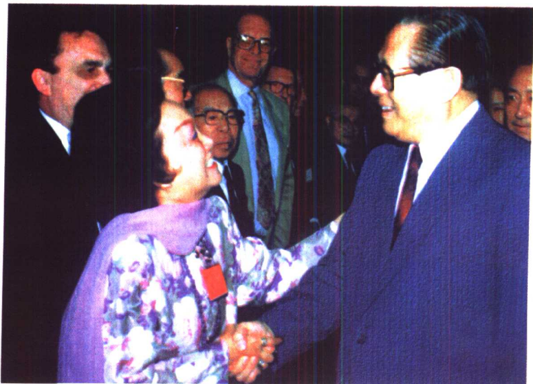
陈香梅第二次带领台湾投资访问团到北京访问，受到江泽民主席的欢迎。