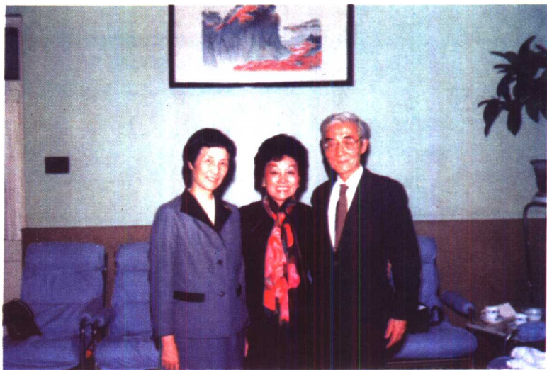
陈香梅同中国前驻美大使章文晋夫妇在一起。