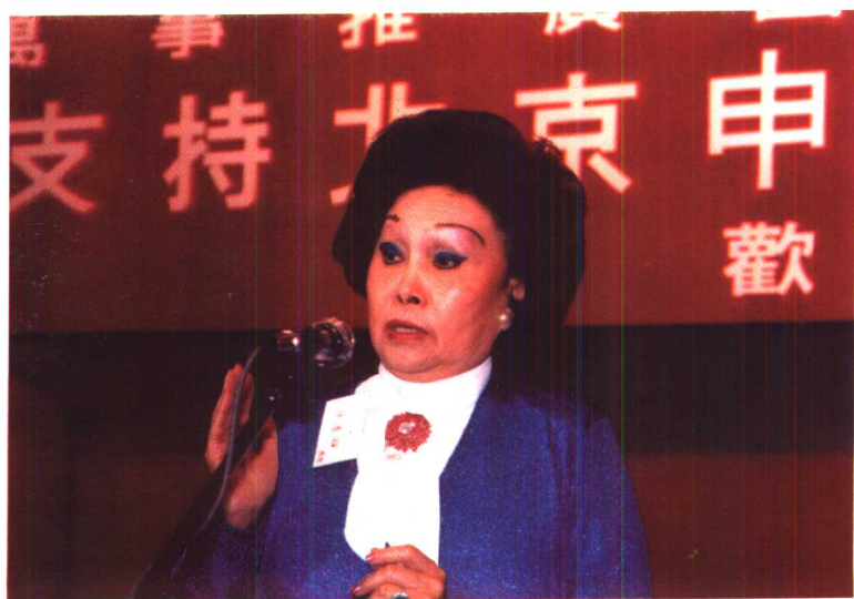
在支持北京申办奥林匹克运动会上讲话。