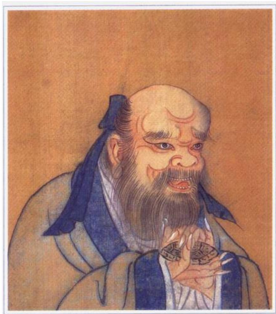
鬼谷子（战国）清人绘

战国时期的思想家，纵横学派的创始人，相传名利(或利)。楚国人或传为齐国人。因隐于清溪鬼谷，亦称鬼谷先生。长于养性持身和纵横之术。苏秦、张仪俱出其门下。今本《鬼谷子》为南朝梁陶弘景注。《隋书·经籍志》始著录《鬼谷子》三卷，列入纵横家。