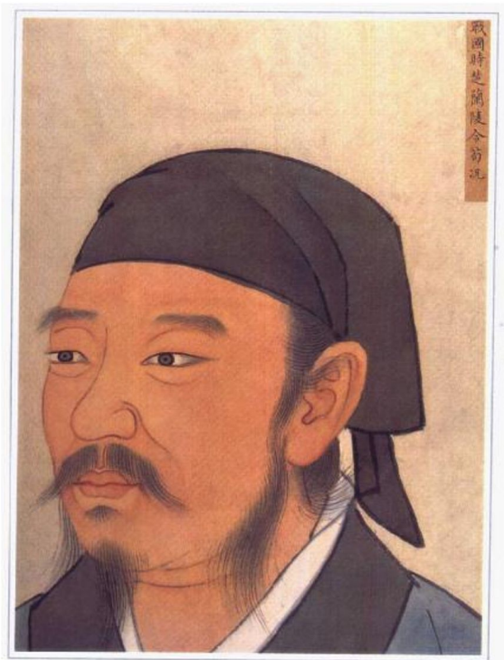
荀况（前313—前238）清殿藏本

战国时期思想家、教育家。又称荀卿，汉时避宣帝讳，改称孙卿。赵国人，游学于齐，后三为祭酒。晚年赴楚，春申君使为兰陵（今山东苍山县兰陵镇）令，定居其地著书终老。韩非、李斯都是他的学生。其学说以孔子儒学为本，主张礼治，倡性恶之说，谓人性皆恶，重视环境和教育对人的影响，与孟子性善说相反。他批判地继承了先秦诸子学说，提出“制天命而用之”的人定胜天思想，推动了古代唯物主义的发展。著有《荀子》。