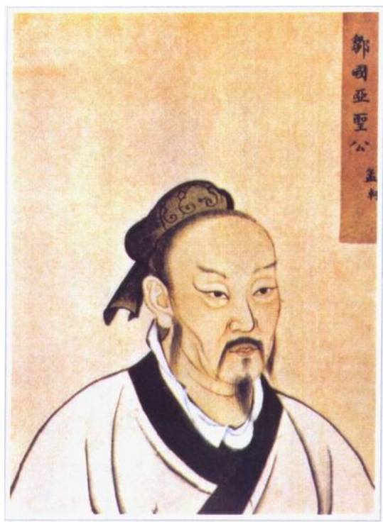
孟 轲 (约前372—前289) 清殿藏本

战国时期的思想家、政治家、教育家。字子舆。邹(今山东邹县)人，是鲁国贵族孟孙氏的后代。早年丧父，少时受业于子思门下，周游宋、滕、魏等国，并任过齐宣王的客卿。后与弟子致力于著书立说。政治上主张“法先王”、“行仁政”、“减刑法”，并认为“民贵君轻”，在经济上要求统治者恢复“井田制”，“轻徭薄赋”，以达到百姓“不饥不寒”之目的；在世界观方面提出“先知先觉，后知后觉”，“劳心者治人，劳力者治于人”。他的学说对后世儒家影响很大，被认为是孔子学说的继承者，尊为“亚圣”。《汉书·艺文志》著录《孟子》十一篇，今存七篇。