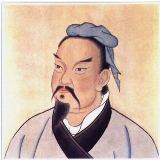
孙 武（春秋末）明万历《三才图绘》刻本

春秋末期军事学家，中国古代军事学的奠基人。字长卿，也称孙武子。齐国乐安（今山东）人。生卒年不详，约活动于前六世纪末至前五世纪初。因齐国内乱，孙武出走吴国。以《兵法》十三篇向吴王阖闾进见，被任为将，率吴军攻破楚国。所著《孙子兵法》八十二篇，总结了春秋时期军事战争经验，揭示了“知彼知己，百战不殆”这一指导战争的普遍规律，是中国不朽的军事名著，对后世产生了广泛而深刻的影响。