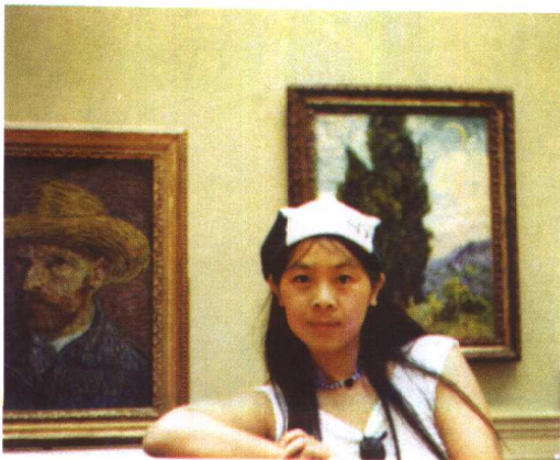
在纽约大都会博物馆梵高画像前