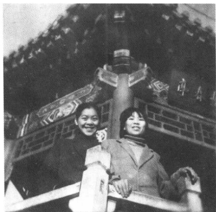
上师专时，与姐姐在加格达奇铁路公园