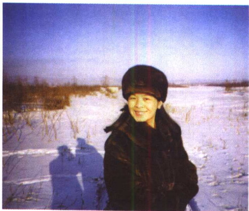
故乡的冬天，雪地上的影子还是两个人