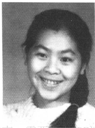
在大兴安岭师专任教时