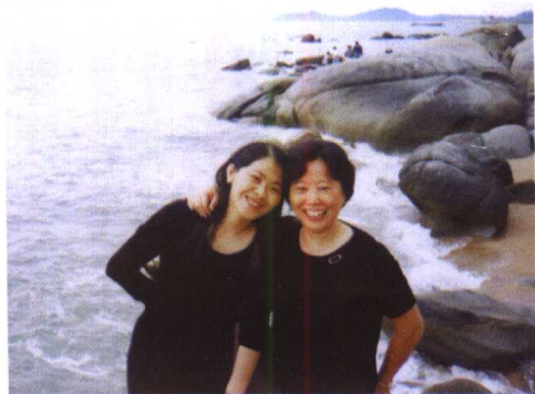
与蒋主席（子丹）在一起