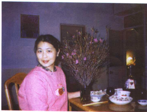
2002年故乡的除夕夜，从雪野中采回的达子香花，饺子，美酒，卧室温柔的灯光