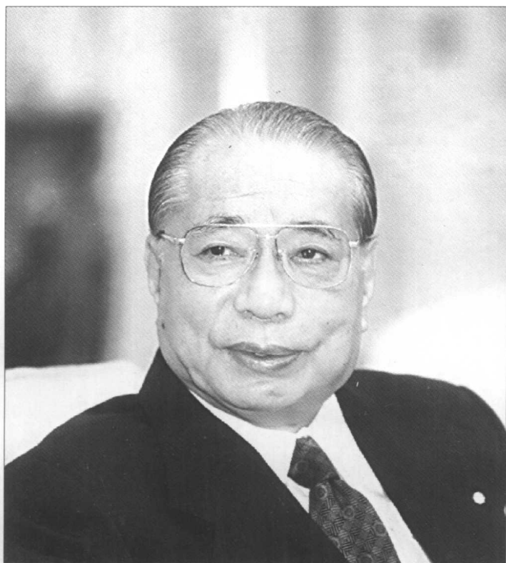
著者池田大作先生近照