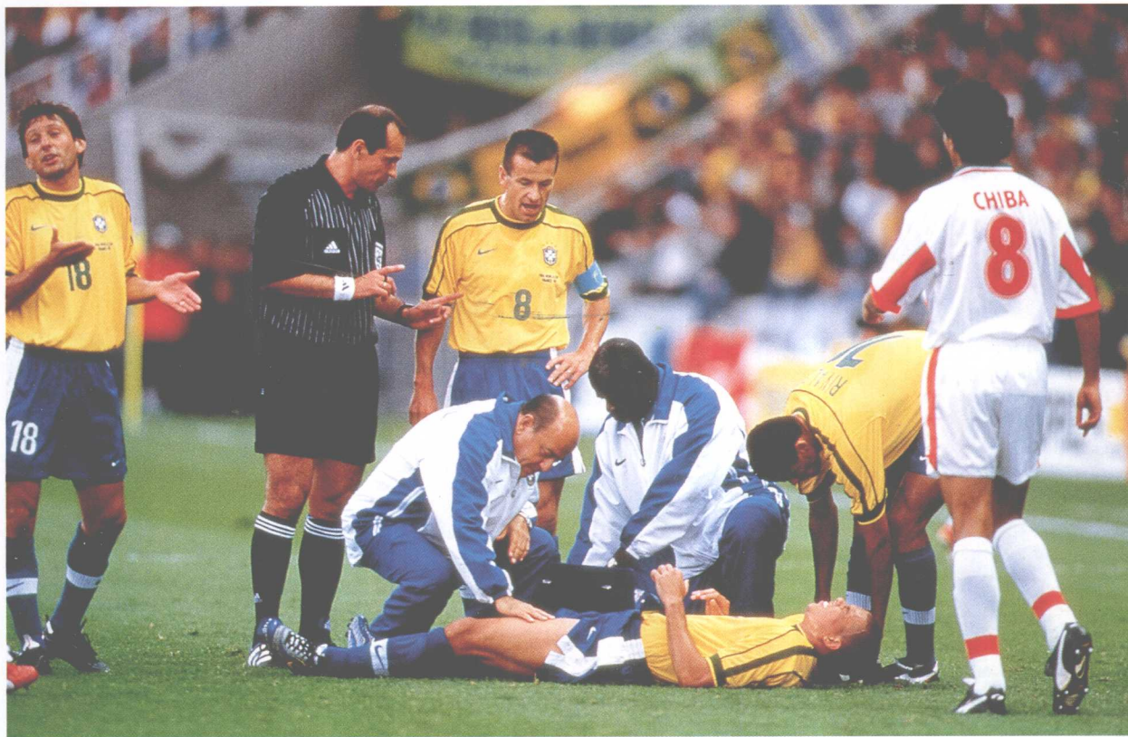
摩洛哥人只能用粗暴犯规才会使敏捷、弹跳力好的罗纳尔多与球分离。

令对方只能用粗野的犯规来招架；第18分钟罗纳尔多大腿被摩洛哥8号希巴猛踩一脚，被迫接受冷冻治疗数分钟。多家媒体对这位球星赞不绝口：“超级球星罗纳尔多：巴西劲旅势不可挡。”