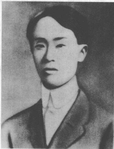
李叔同于日本留学时留影。

那么我就问他:“既要到虎跑寺去,总要有人来介绍才对。究竟要请谁呢?”他说:“有一位丁辅之是虎跑的大护法,可以请他去说一说。”于是他便写信请丁辅之代为介绍了。