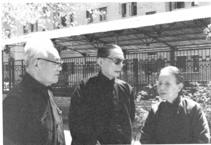
1981年与巴金（左）、冰心（右）在一起。