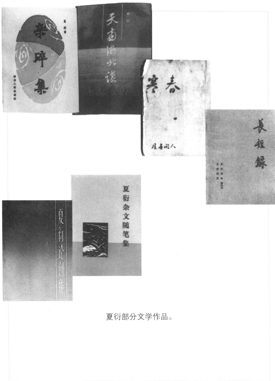
夏衍部分文学作品。