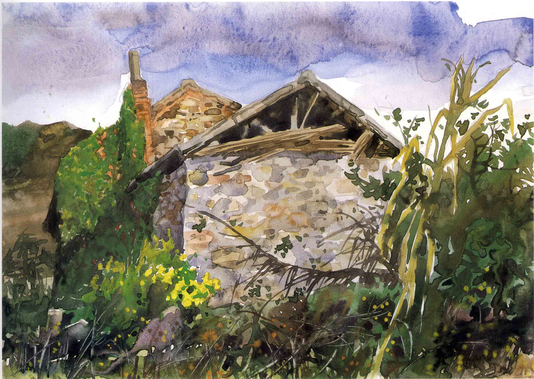
老房子 35.5cm × 25cm 1999年