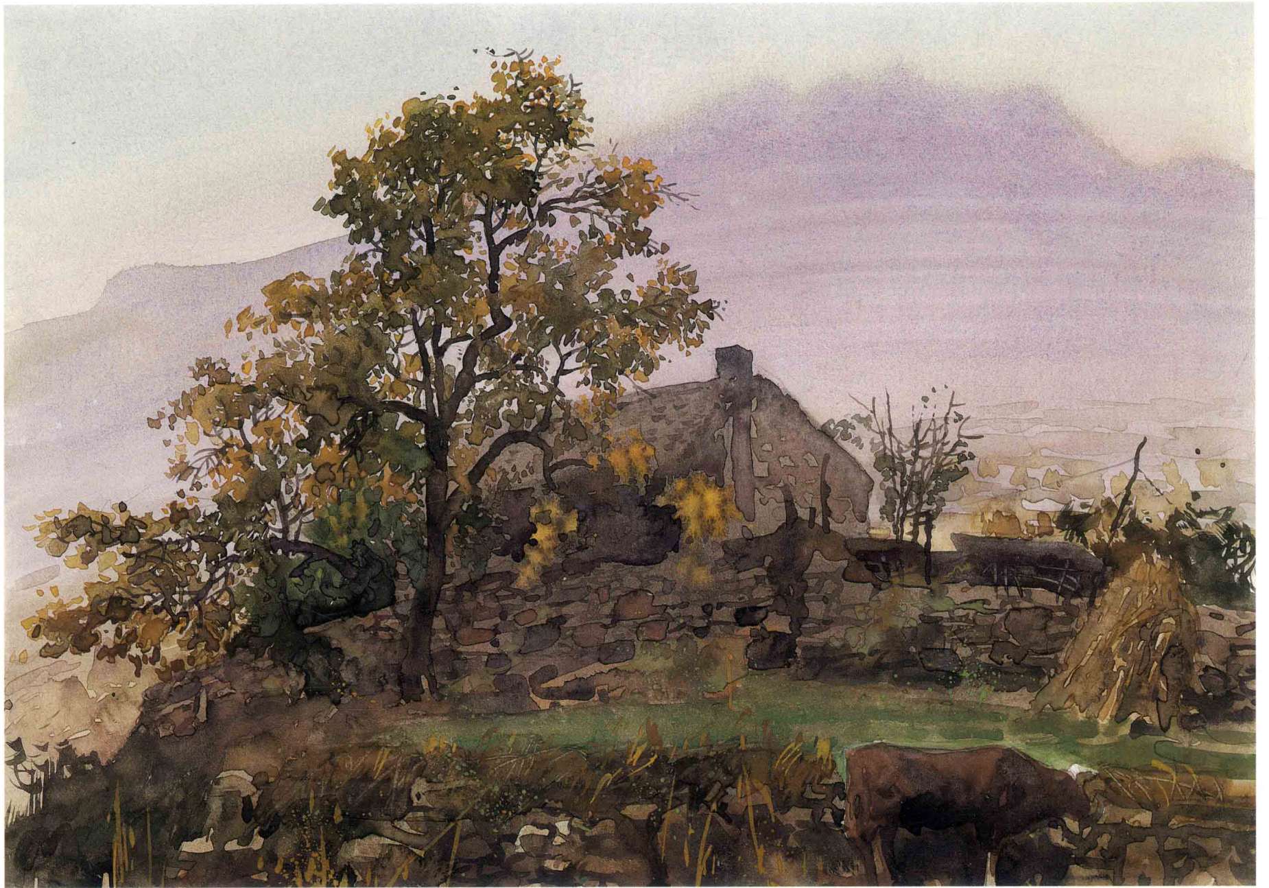
远山的雾 35.5cm × 25cm 1999年