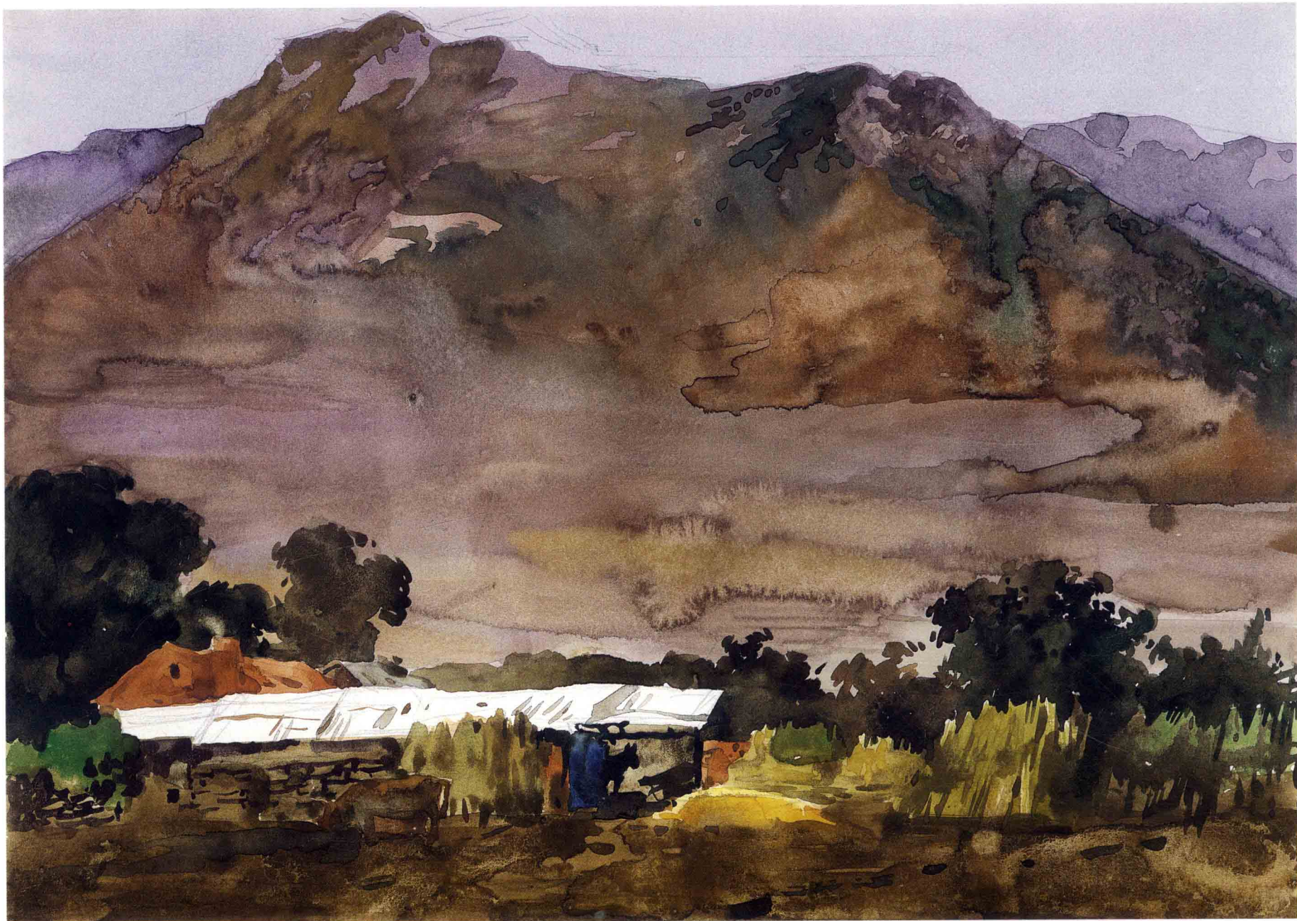
微风 35.5cm × 25cm 1999年