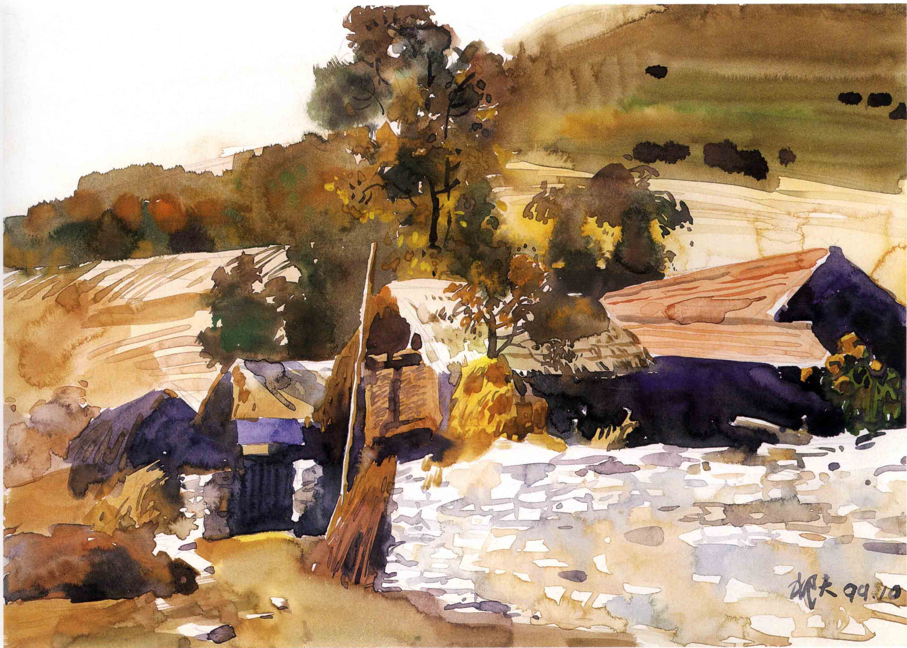
小村之恋 35.5cm × 25cm 1999年