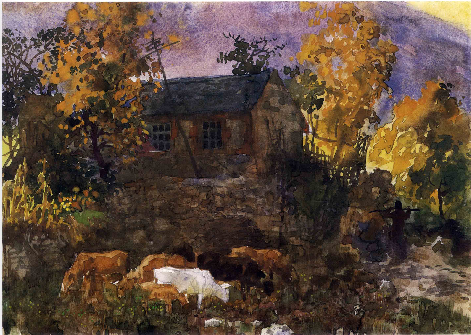
房东家的后院 35.5cm × 25cm 1999年