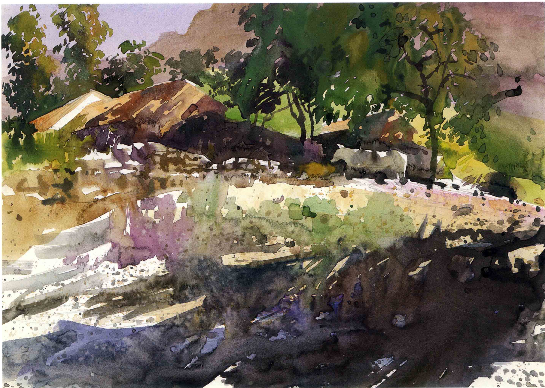
村头 35.5cm × 25cm 1999年