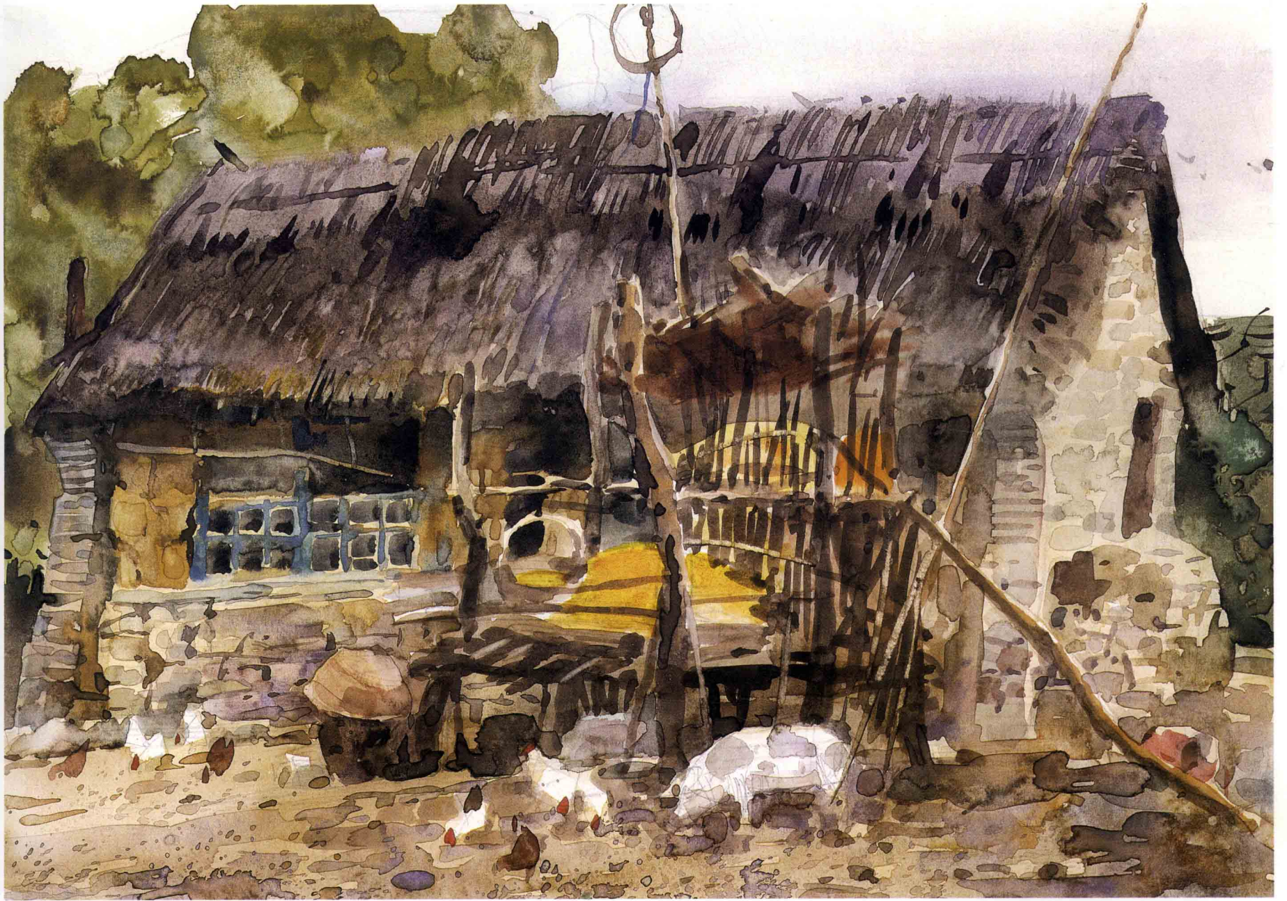
草房 35.5cm × 25cm 1999年