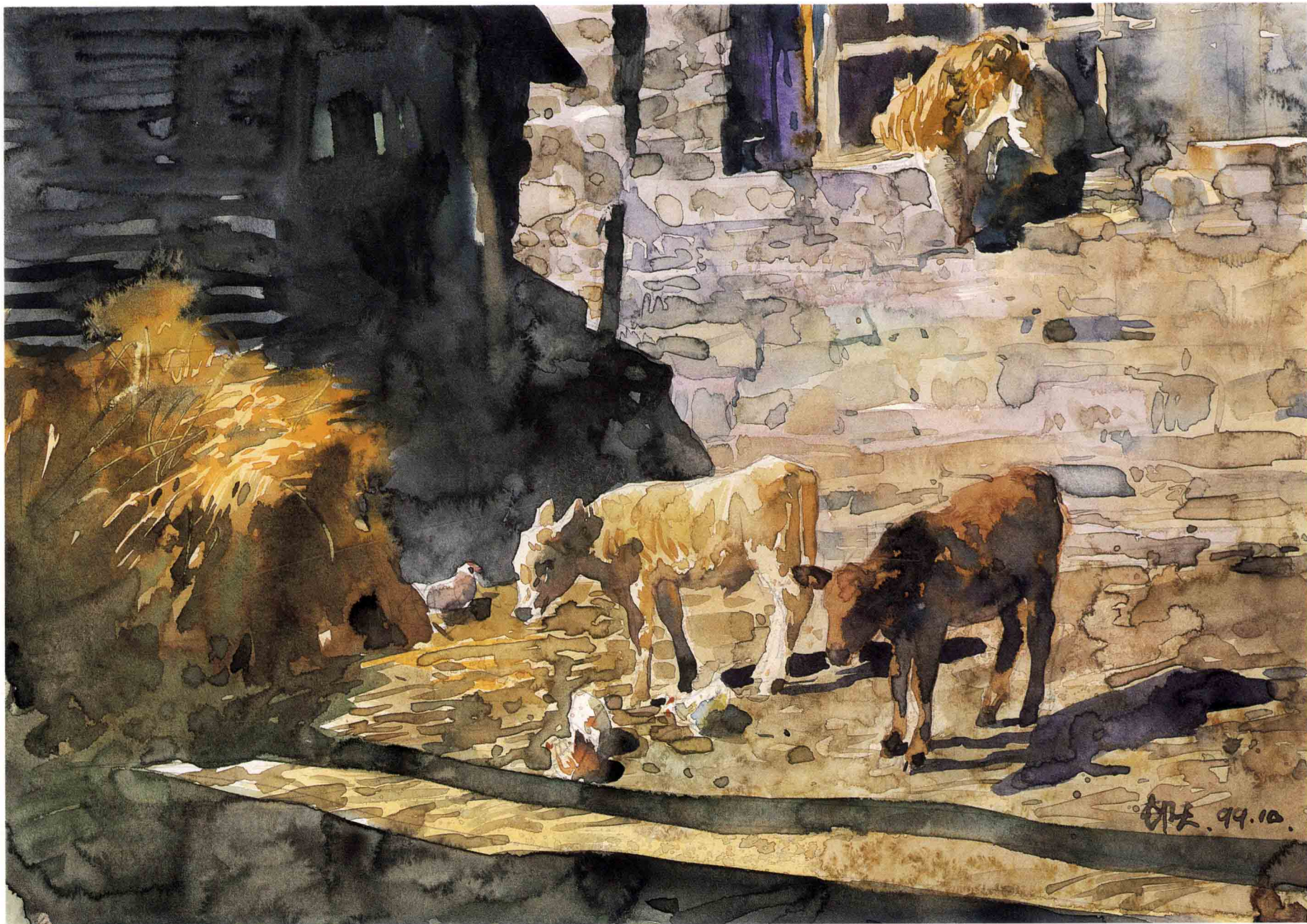
房东家小院 35.5cm × 25cm 1999年