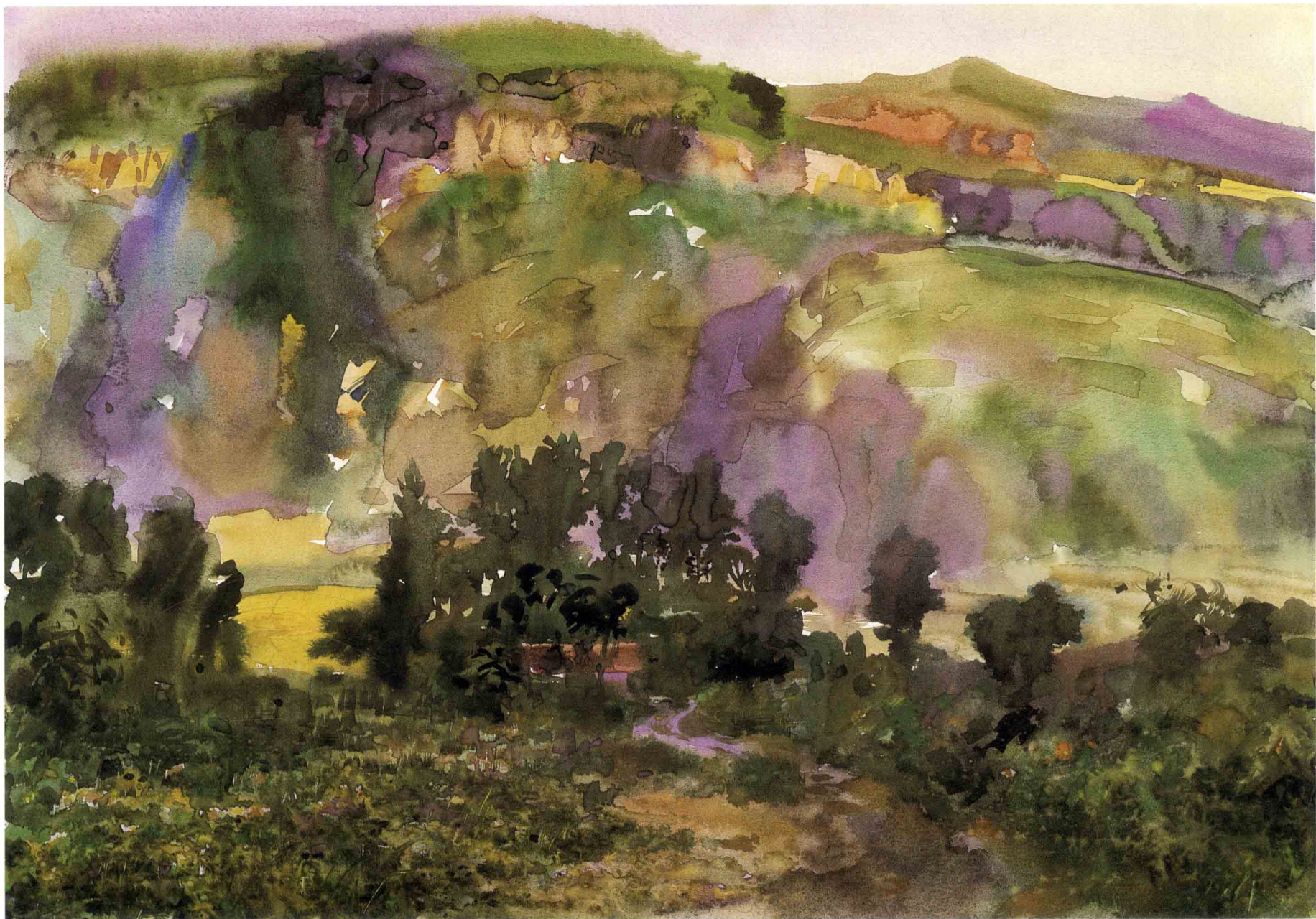
核伙沟 35.5cm × 25cm 1999年