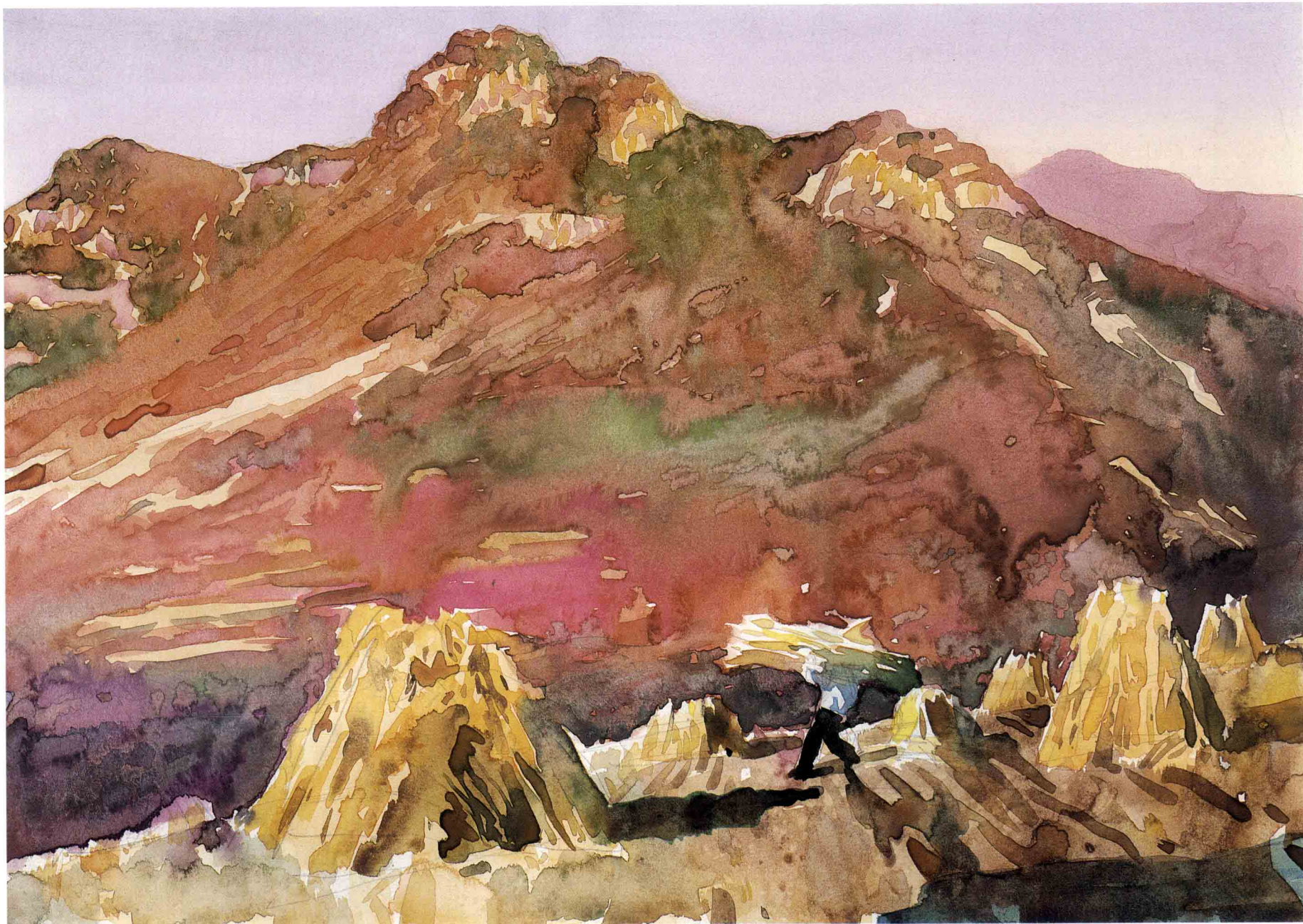
收割 35.5cm × 25cm 1999年