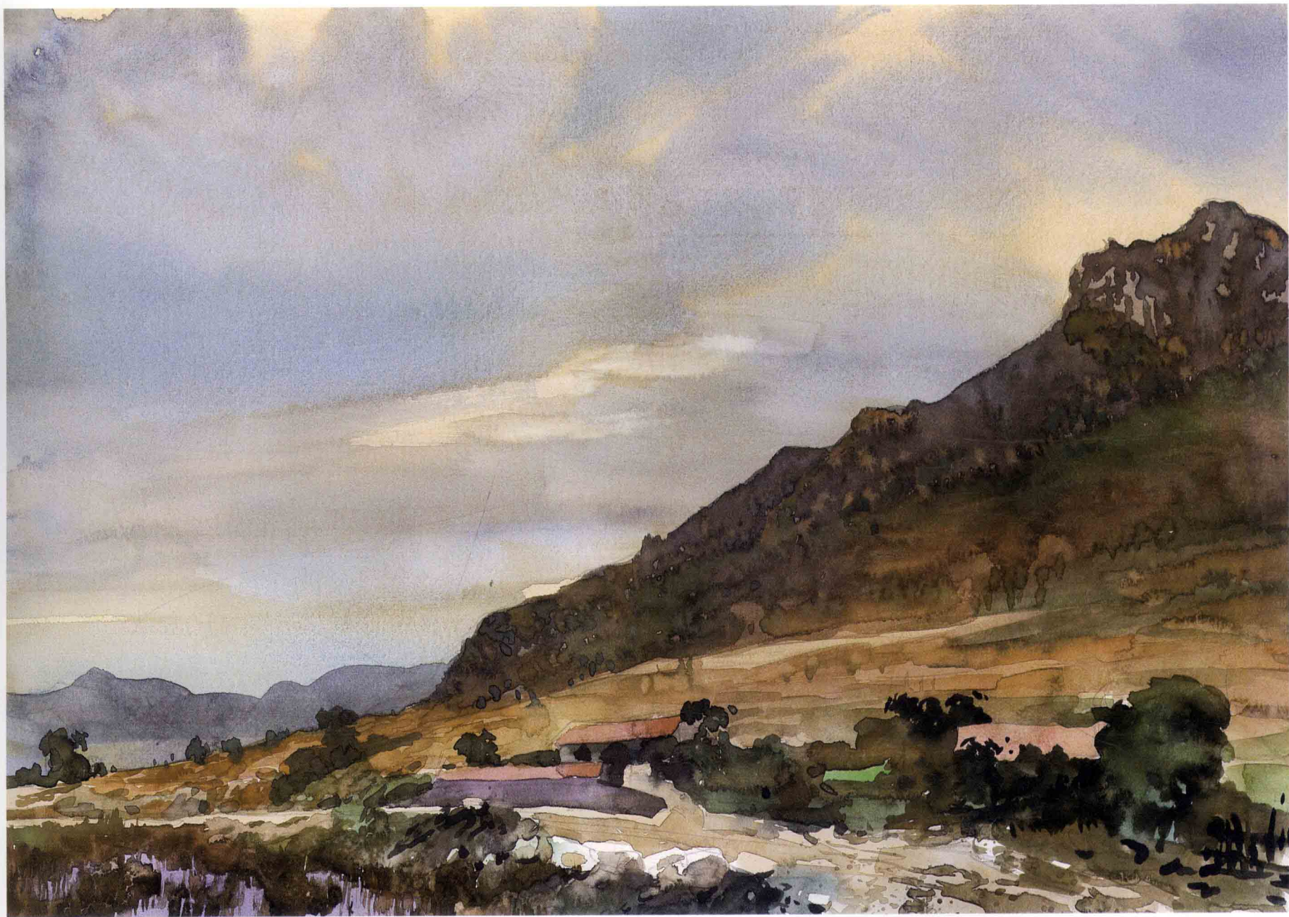
通往山外的小路 35.5cm × 25cm 1999年