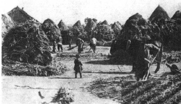
◀ 清代末年农家的秋收场院