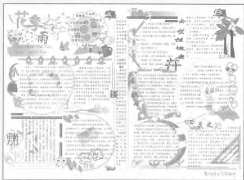
《花季雨季》 Cz2003 常州市市北实验初级中学