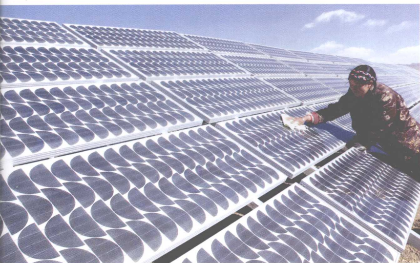
■ 西藏措美县哲古镇光伏电站的管理员在擦净硅光板上的尘土

区政府全年用于科学技术的支出达 1.9 亿元，同比增长 75.14%，重点支持了特色农牧业、高原生物、藏医药、新能源、生态建设与环境保护等领域先进适用技术的应用与推广。中国社会科学院民族问题专家扎洛在对比研究西藏今昔的科技状况后给出了这样一组数据：和平解放前的西藏，没有一所现代科学技术研究机构，只有不足 100 名从事藏医和天文历算的科技人员。到 2007 年，西藏自治区已有各类科研机构 40 所，各级农牧业科技推广机构 140 个，各类专业技术人员近 40 万人，其中科研人员近 2000 人；自治区还建有重点实验室和工程技术研究中心 9 个，各类科技示范