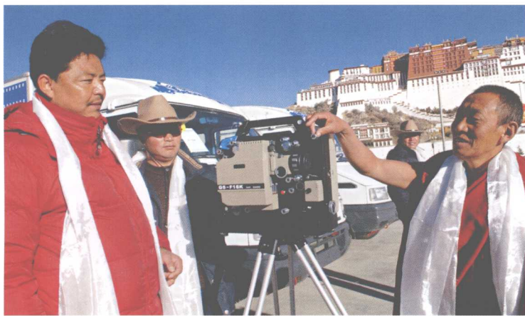
■ 西藏实施一村一月放映一场电影工程，图为电影放映员在调试放映机。