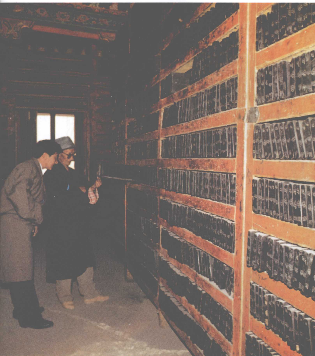
■ 在西藏档案馆找资料