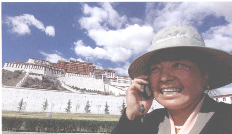
■ 一位藏族妇女在用手机打电话