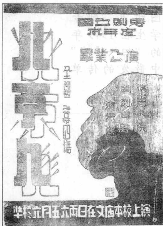
图十三 第六届 毕业生公演曹禺名作 《北京人》海报(1943 年6月于江安)