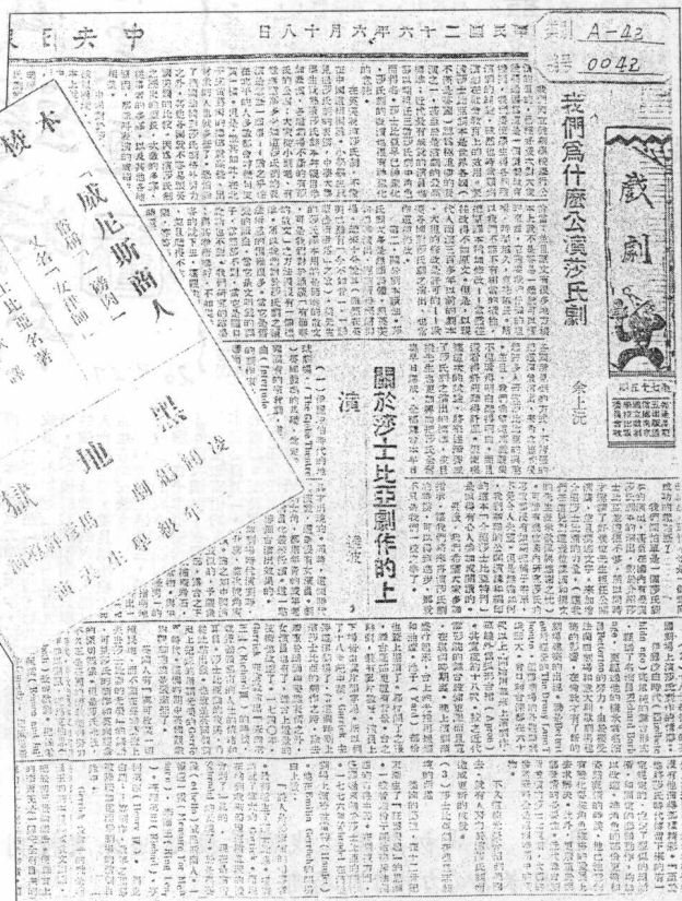
图七 余上沅于1937年6月18日在《中央日报》上发表文章谈为什么要演莎士比亚剧 公演莎士比亚名剧《威尼斯商人》预告(1937年4月)