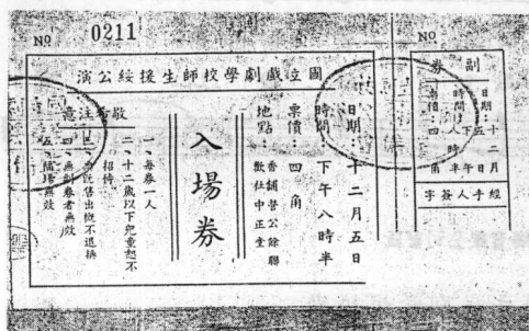
图五 国立戏剧学校师生援绥公演入场券(1936年秋季以来,绥远驻军傅作义等部先后击败了日伪军的进犯,收复了百灵庙和大庙等地。绥远抗战

的胜利,振奋了全国人民。为声援绥远将士,国立戏剧学校于当年12月在南京举行了公演,剧目有:《母亲》([俄]高尔基作、田汉改编,马彦祥导演);《东北之家》(章泯作,余上沅导演);《镀金》([法]腊皮虚作,曹禺改编、导演);《红灯笼》(王思曾作,陈治策导演)