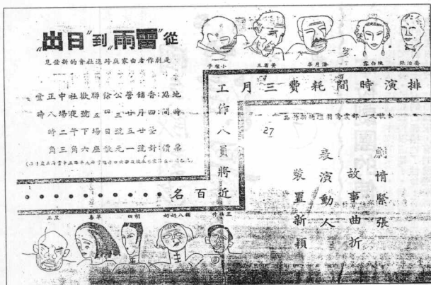
图六 国立戏剧学校公演《日出》海报 (1937年4月)