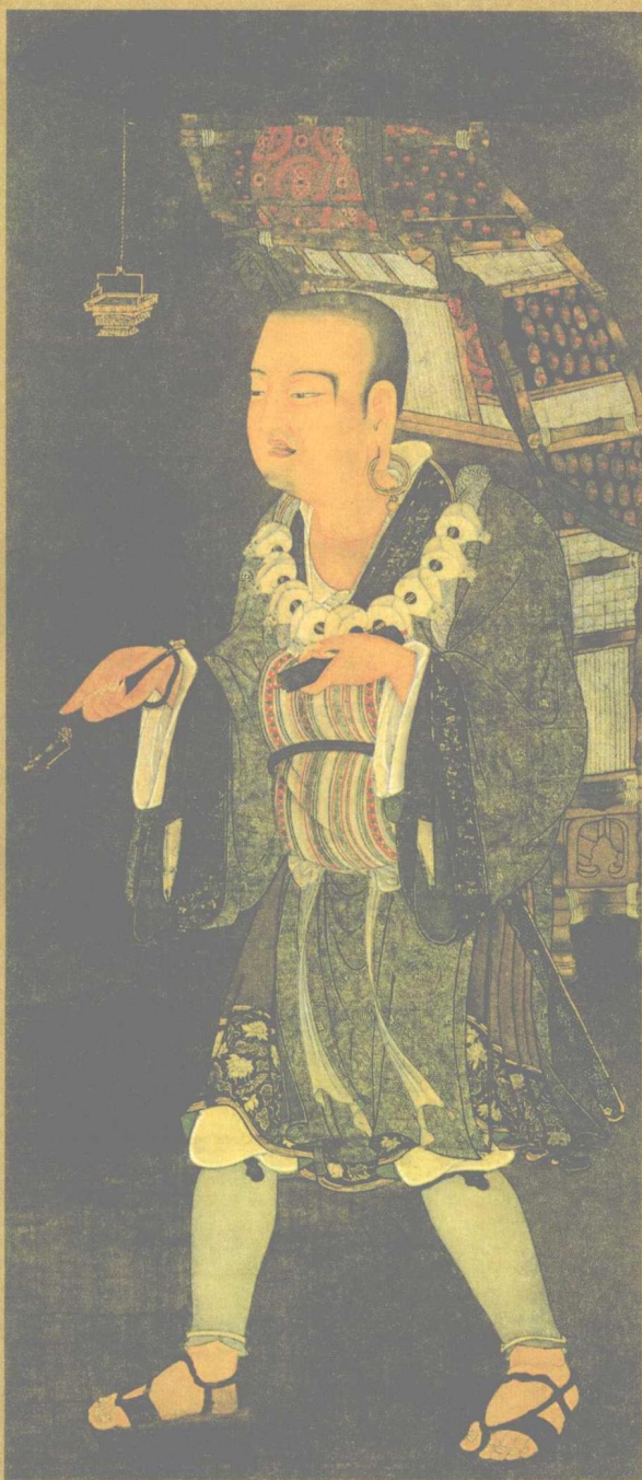
玄奘法師 MASTER MONK XUAN XANG