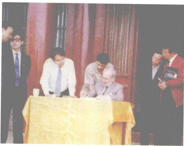
尼泊尔驻中 国大使马拉 参观玄奘故 里，并题词 纪念玄奘