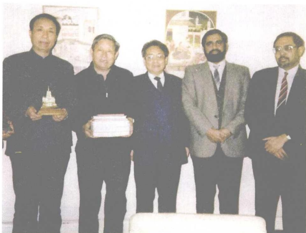
印度驻中国大使海达尔(右二)参观玄奘故里,并赠送佛塔、佛像