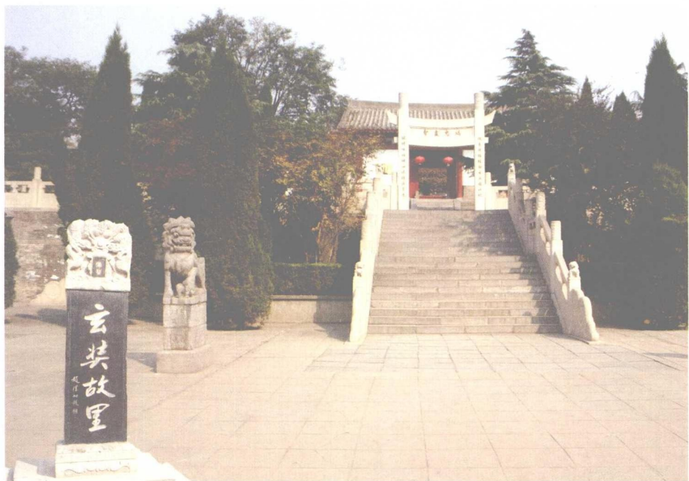
驰名中外的玄奘故里