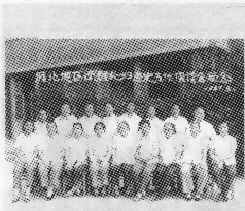
1983年8月,西雁北妇 运史座谈会合影留念。