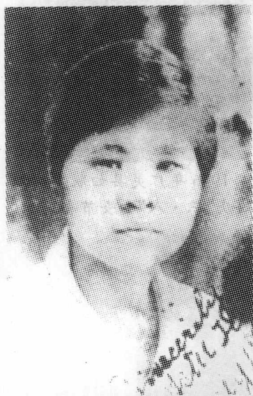
抗日民族女英雄李林。