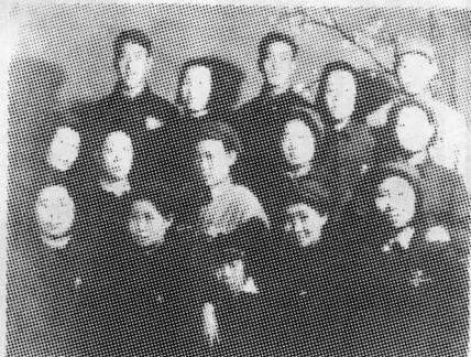
1948年晋绥五边区妇委会领导与 绥蒙区妇联会部分领导、工作人员合影。