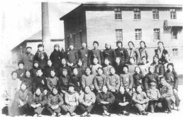
1964年3月，各县出席雁北专区劳动模范大会的全体女劳模与专区妇联会领导合影。