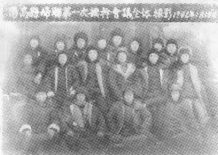
1946年1月阳高县妇联会第一次 扩干会议部分妇女代表合影。