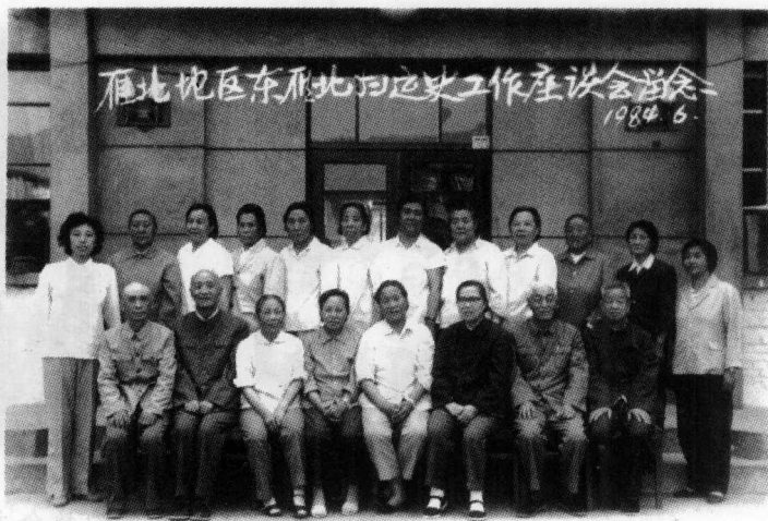
1984年6月，东雁北妇运史座谈会成员合影留念