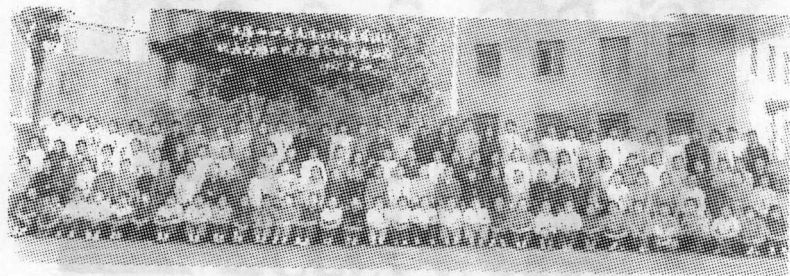
1965年8月，出席山西省先进妇联基层组织代表会雁北代表团全体代表留念。