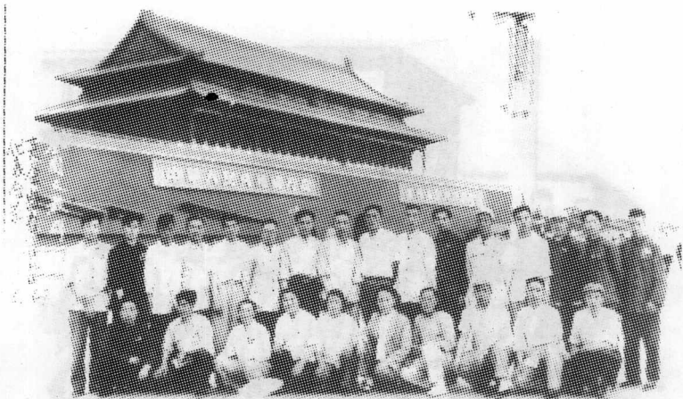
1960年6月，晋北专区出席全国文教群英会的妇女代表与男同志代表合影留念。