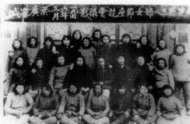
1946年广灵县妇联会组织 妇女欢庆“三·八”妇女节合影。