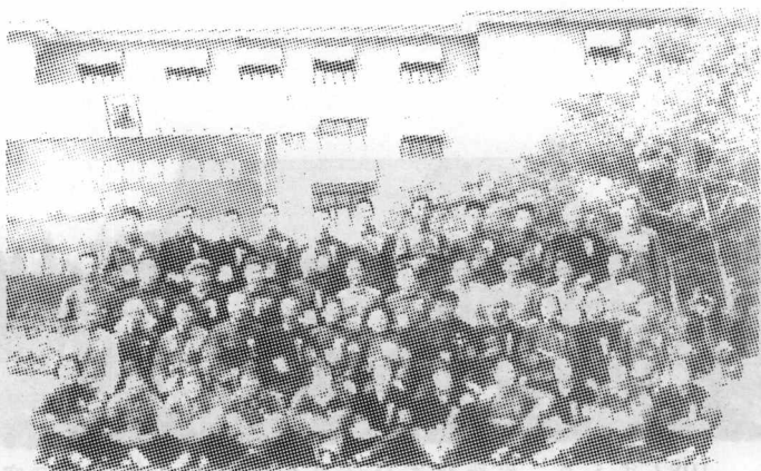
山西省赴北京参加国庆观礼的雁北 妇女代表与山西全省的代表一起合影留念。