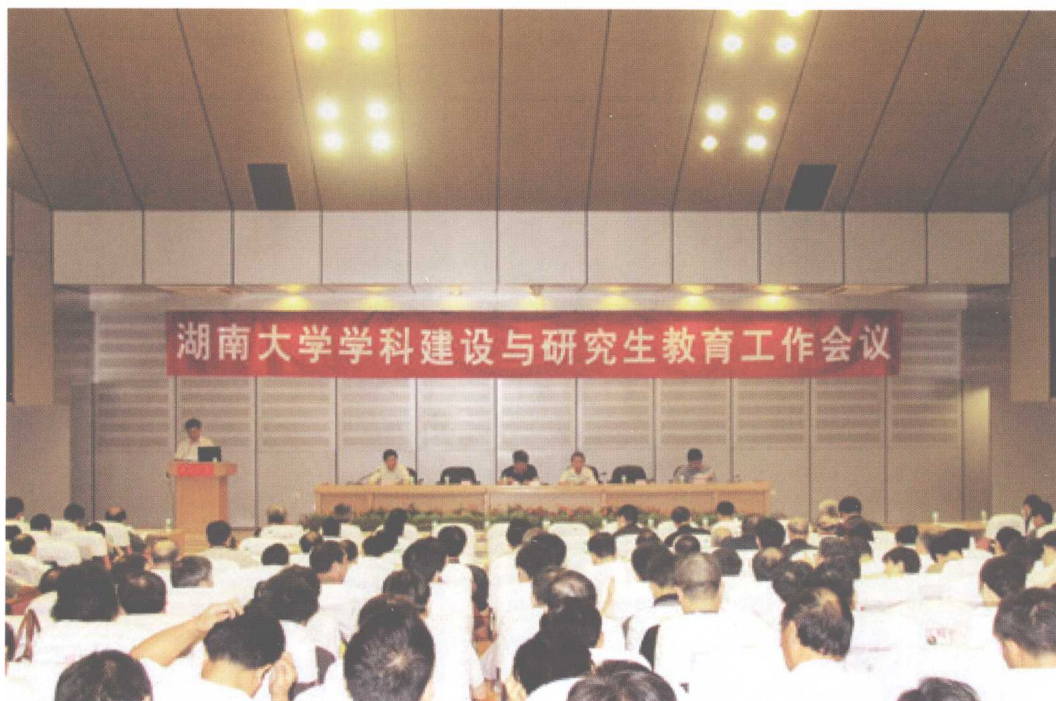
湖南大学学科建设与研究生教育工作会议召开。