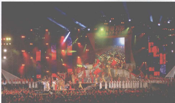
校庆系列之青春万岁文艺晚会。