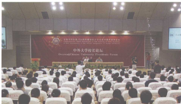
校庆系列之中外大学校长论坛。