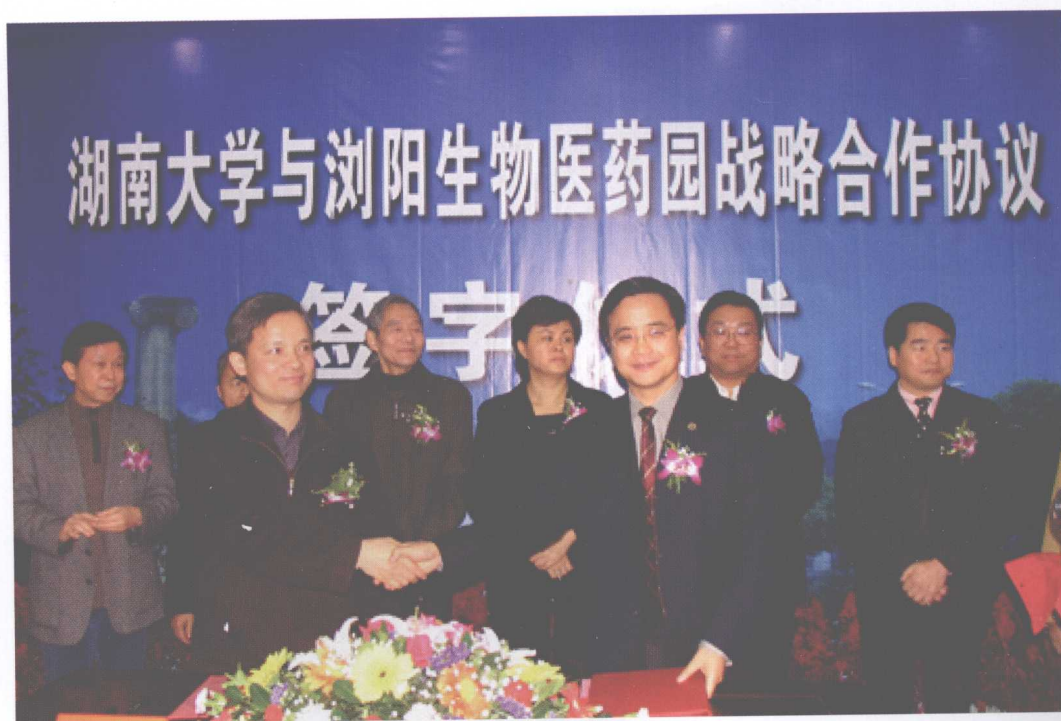
我校与浏阳生物医药园签订战略合作协议。