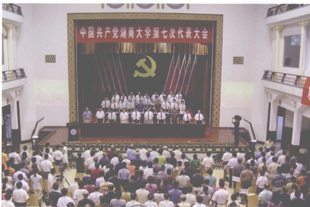
湖南大学第七次党代会开幕。