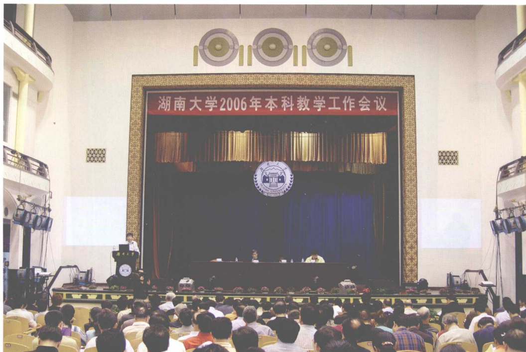
湖南大学2006年本科教学工作会议召开。