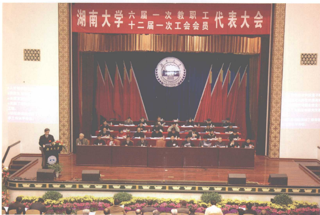
湖南大学六届一次教教职工、十二届一次工会会员代表大会开幕。