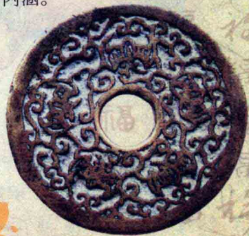
五福（蝠）花钱 (古代厌胜钱)

尧是帝喾的次子，先后被封于陶、唐两地，所以也称“陶唐氏”或“唐尧”。尧在位期间行德政，勤政务，任人唯贤，社会得到较快的发展，老年时让位给舜。