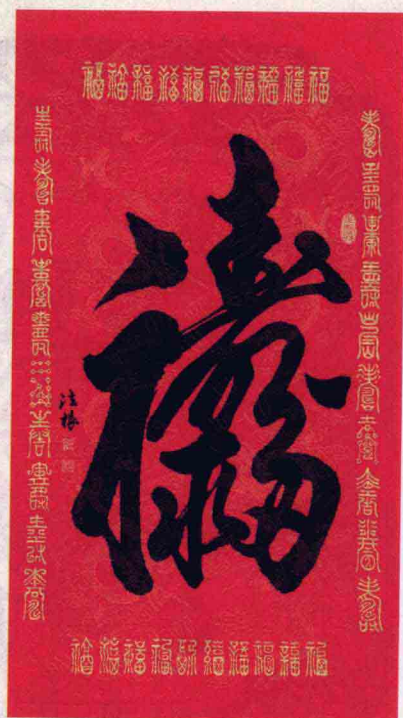
福禄寿喜 法根 当代书法家