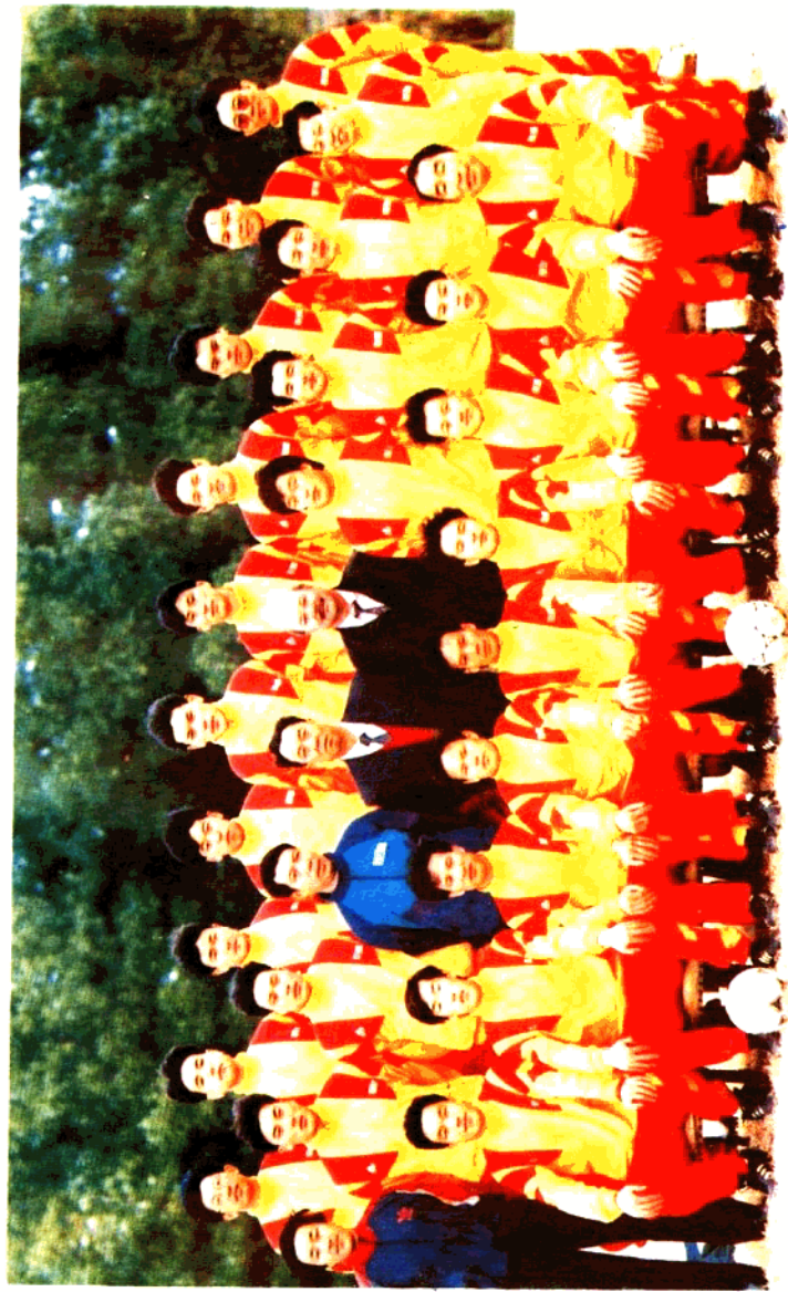
'92 中国足球最佳阵容评选揭晓颁奖