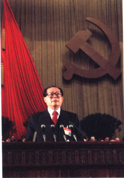
中共十四大在北京举行。 江泽民代表中共十三届中 央委员会向大会作报告

核心，是正确地认识和处理计划与市场的关系。实践的发展和认识的深化，要求我们明确提出我国经济体制改革的目标是建立社会主义市场经济体制。