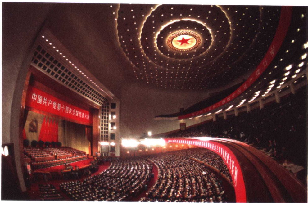
1992年10月12日，中共十四大在北京人民大会堂隆重开幕

奇特组合。此后类似的各种大赛层出不穷，礼仪小姐、葡萄酒王后、空姐等大赛……古老的中国在经济、文化等各个领域开始与世界接轨。