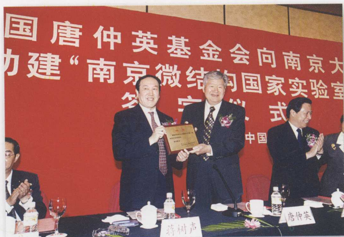
唐仲英基金会向我校捐资助力建“南京微结构国家实验室”协议在宁签署