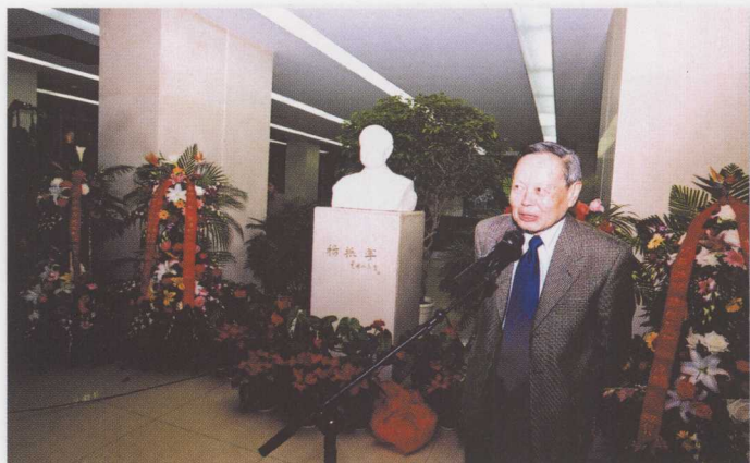
我校在图书馆为诺贝尔物理学奖获得者 杨振宁先生举行塑像揭幕仪式