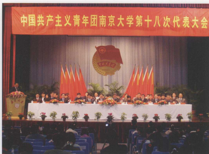
中国共产主义青年团南京大学第十八次代表大会在大礼堂举行