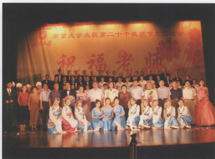
我校举行庆祝第二十个教师节大型文艺晚会