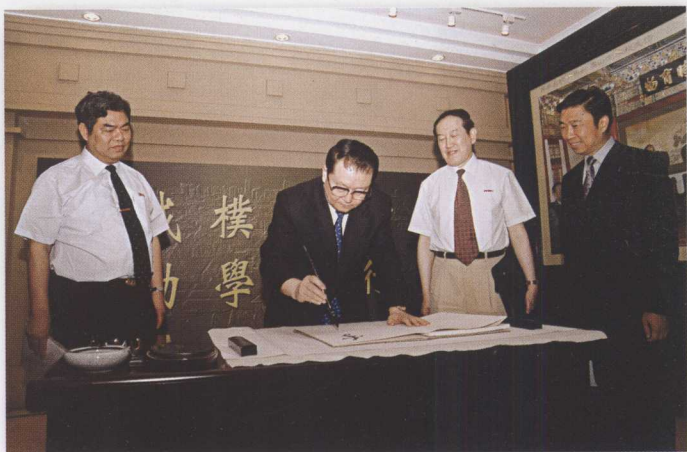
中共中央政治局常委李长春同志来我校视察