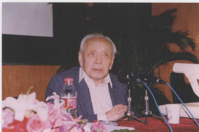
10月13日，国际数学界学术泰斗陈省身教授在我校浦口校区作题为《我的数学生活》的演讲