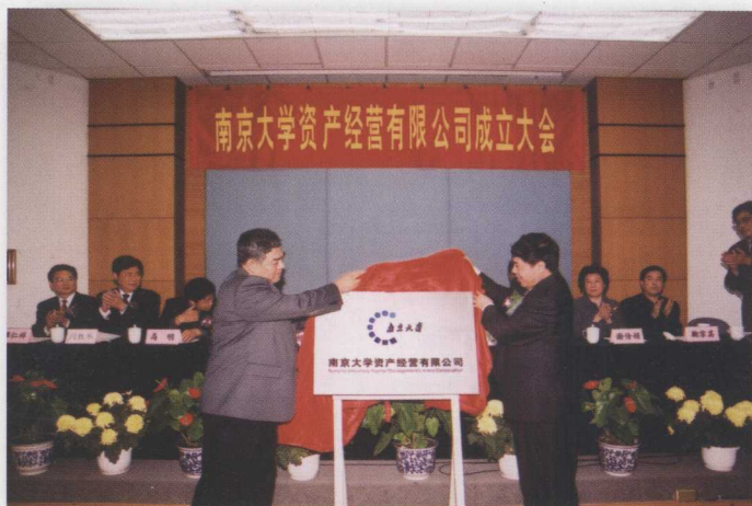
南京大学资产经营有限公司成立