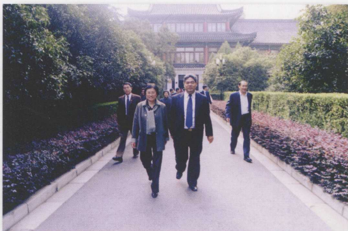
教育部副部长、党组成员吴启迪一行五人来我校考察