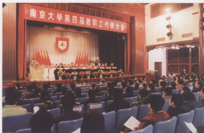
南京大学第四届教职工代表大会开幕