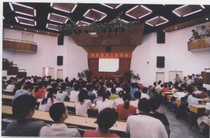
2001年度诺贝尔经济学奖获得者莫里斯来我校作学术报告