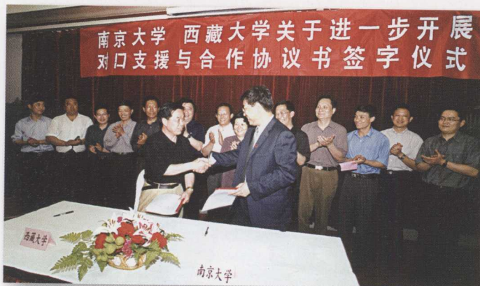
我校与西藏大学签订对口支援与合作协议