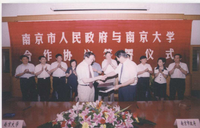
南京大学和南京市人民政府签署合作协议