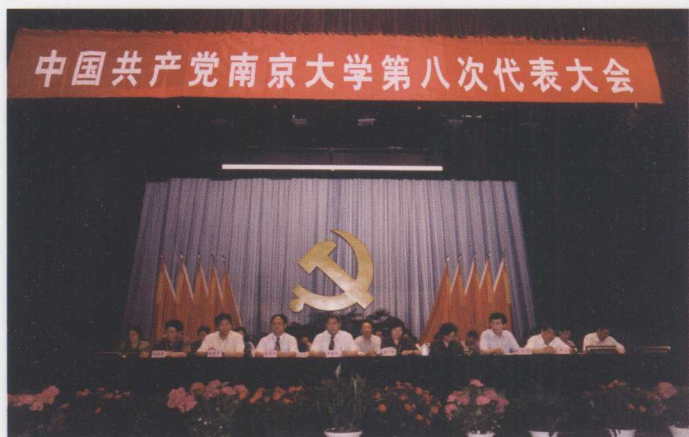
中国共产党南京大学第八次代表大会在我校大礼堂胜利召开