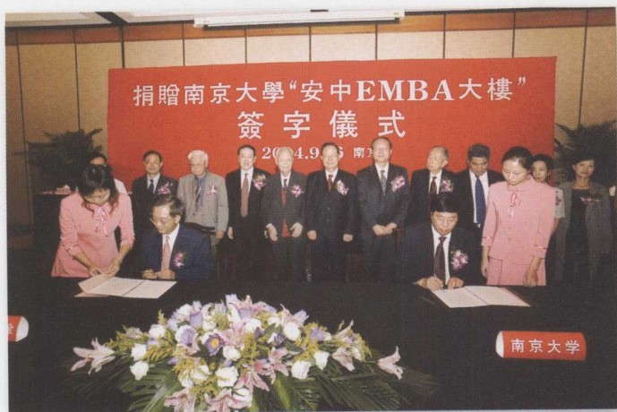
“南京大学安中EMBA大楼捐赠协议签字仪式”在金陵饭店举行