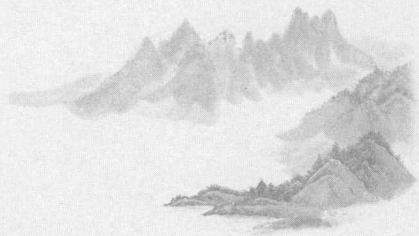
图 解 周 易

出版者 万卷出版公司 地 址 沈阳市和平区十一纬路 29 号 邮 编 110003 联系电话 024-23284089 电子信箱 hzbzs@mail.lnpgc.com.cn 印 刷 环球印刷(北京)有限公司 经 销 各地新华书店发行 幅面尺寸 720mm × 1000mm 1/16 印 张 25.5 字 数 300 千字 版 次 2008 年 1 月第 1 版 2008 年 1 月第 1 次印刷 策 划 李英健 责任编辑 丁建新 书 号 ISBN 978-7-80759-106-1 定 价 19.20 元