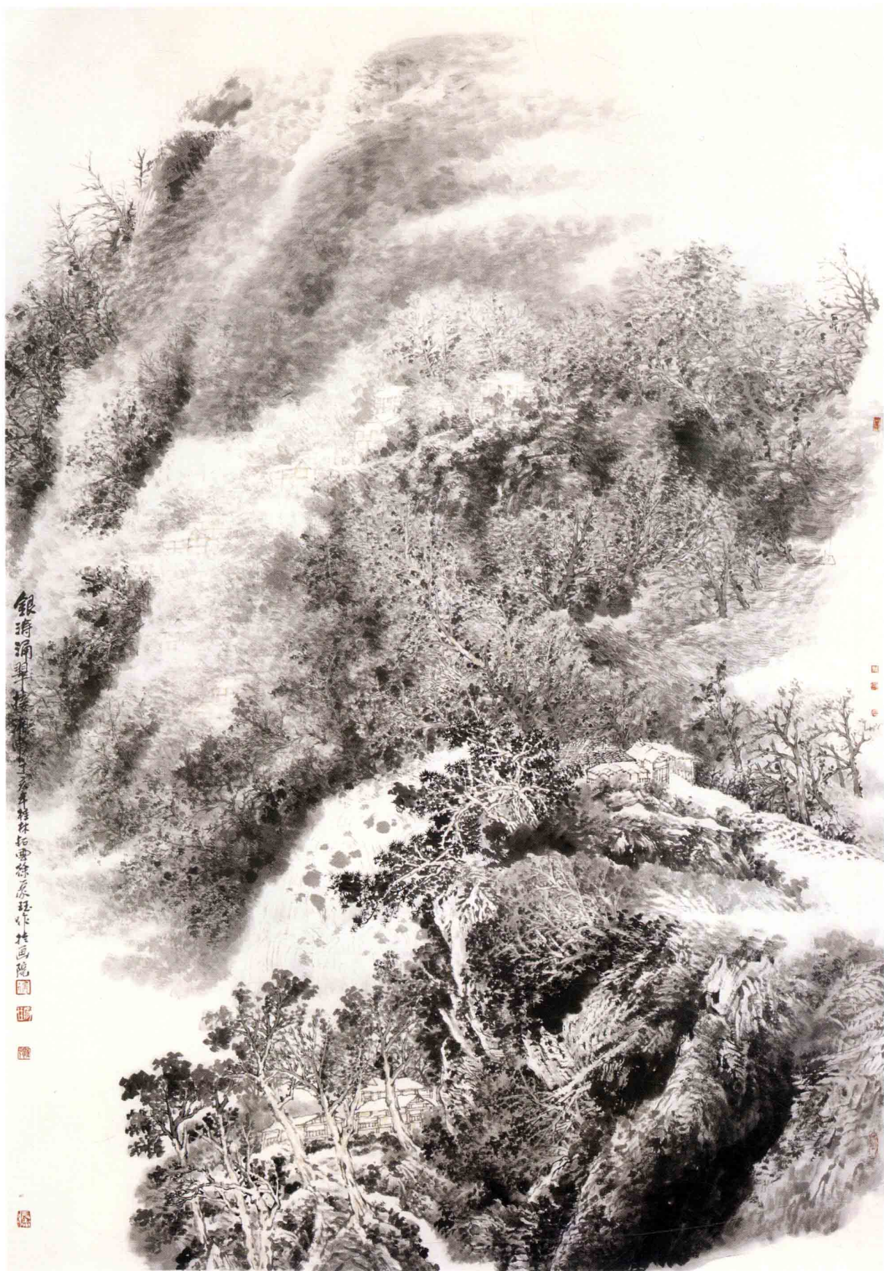
银涛涌翠接湘南 45cm × 68cm