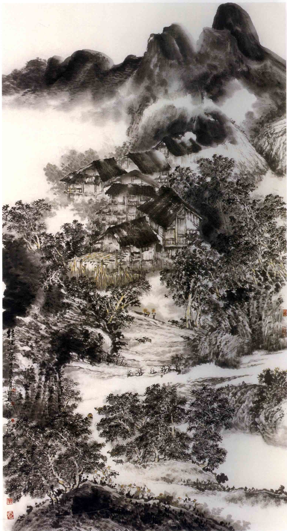
桂北山家之一 68cm x 137cm