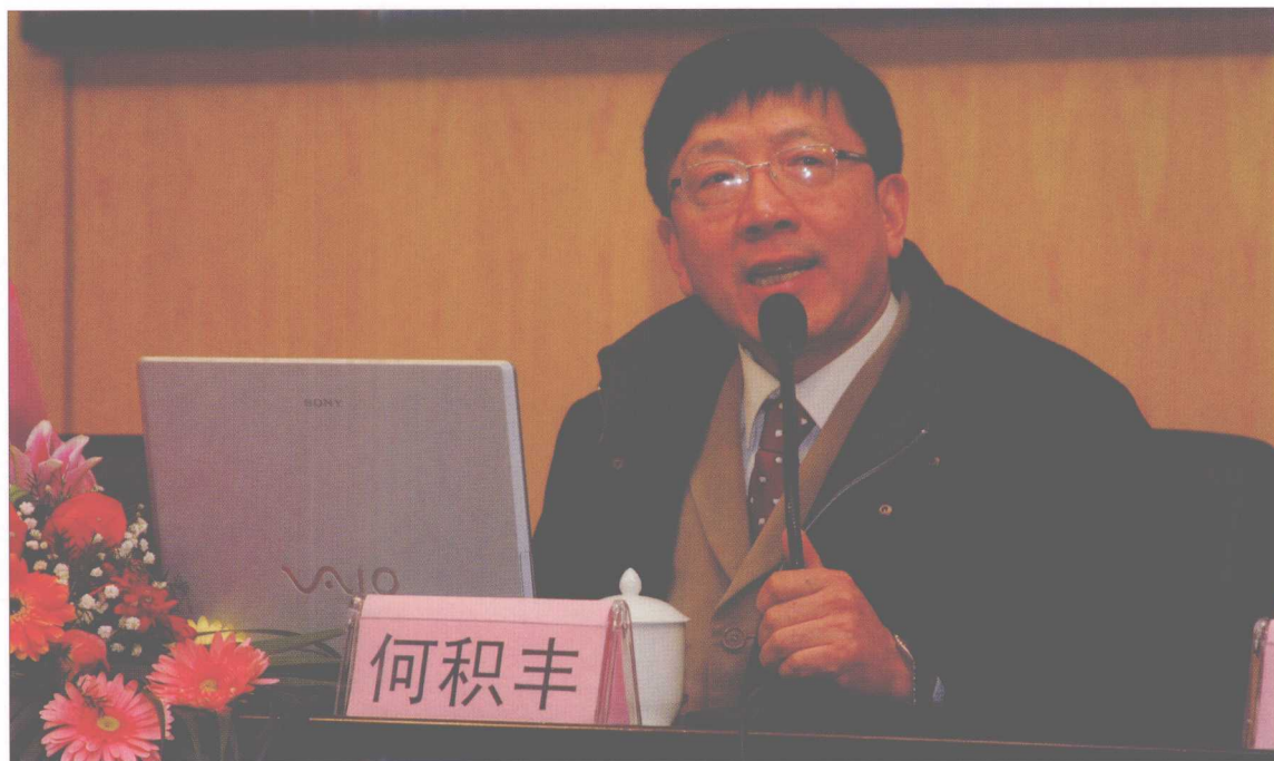
我校何积丰教授当选为中国科学院院士