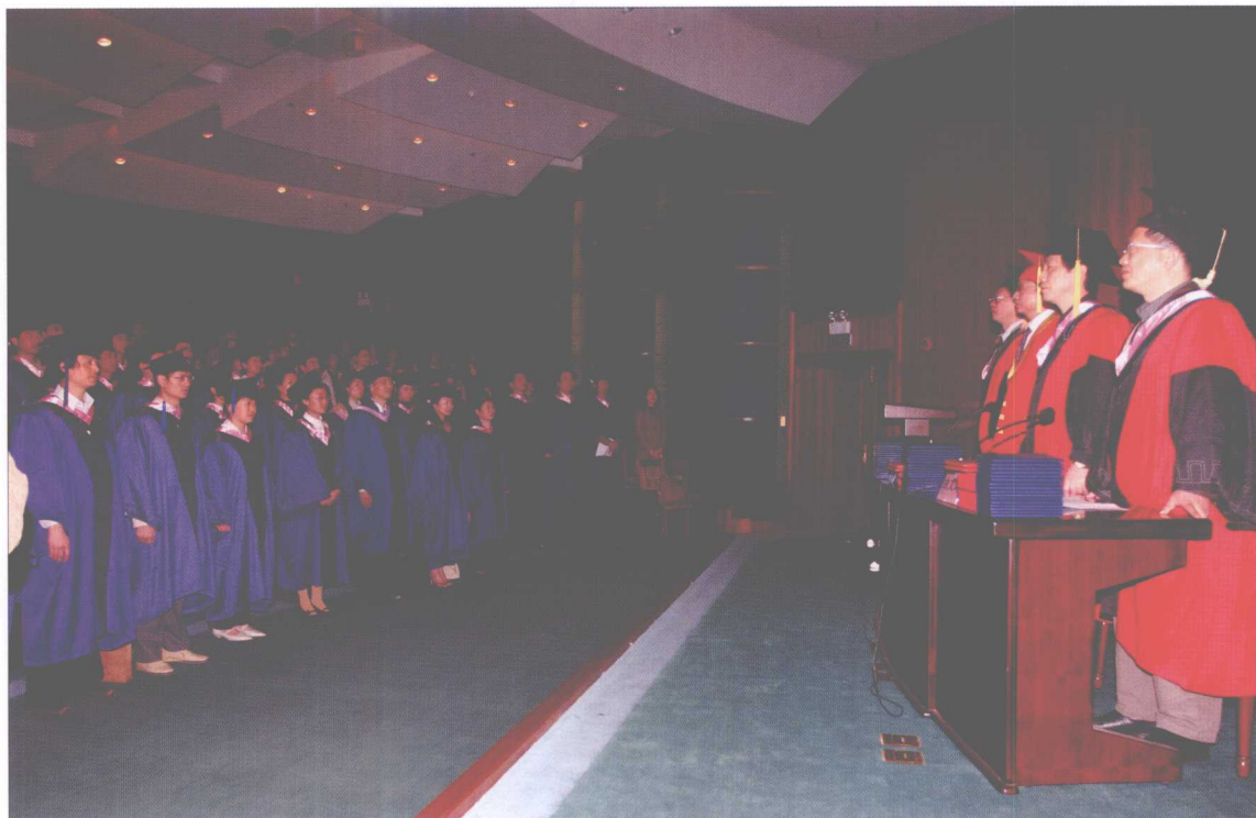
我校首届公共管理硕士毕业