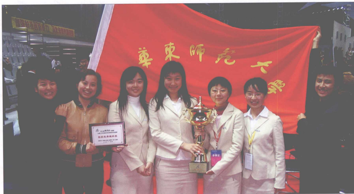
第九届全国“挑战杯”大学生课外学术科技作品竞赛，我校喜获“优胜杯”