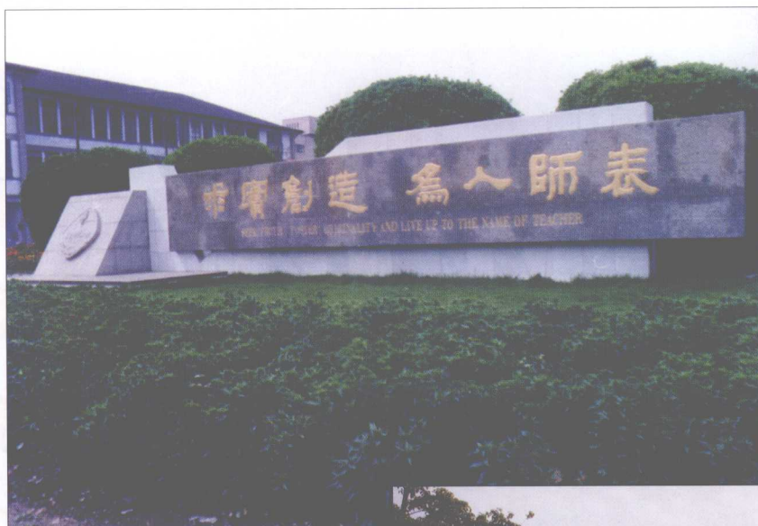
华东师大校训： 求实创造 为人师表