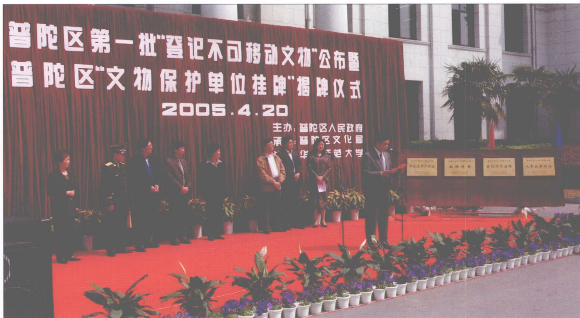
我校文史楼被列为普陀区第一批“登记不可移动文物”