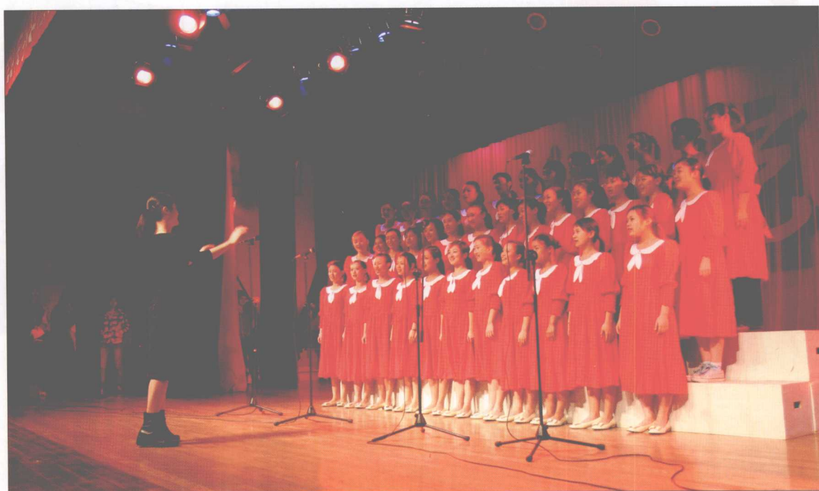
第九届研究生文化艺术节开幕