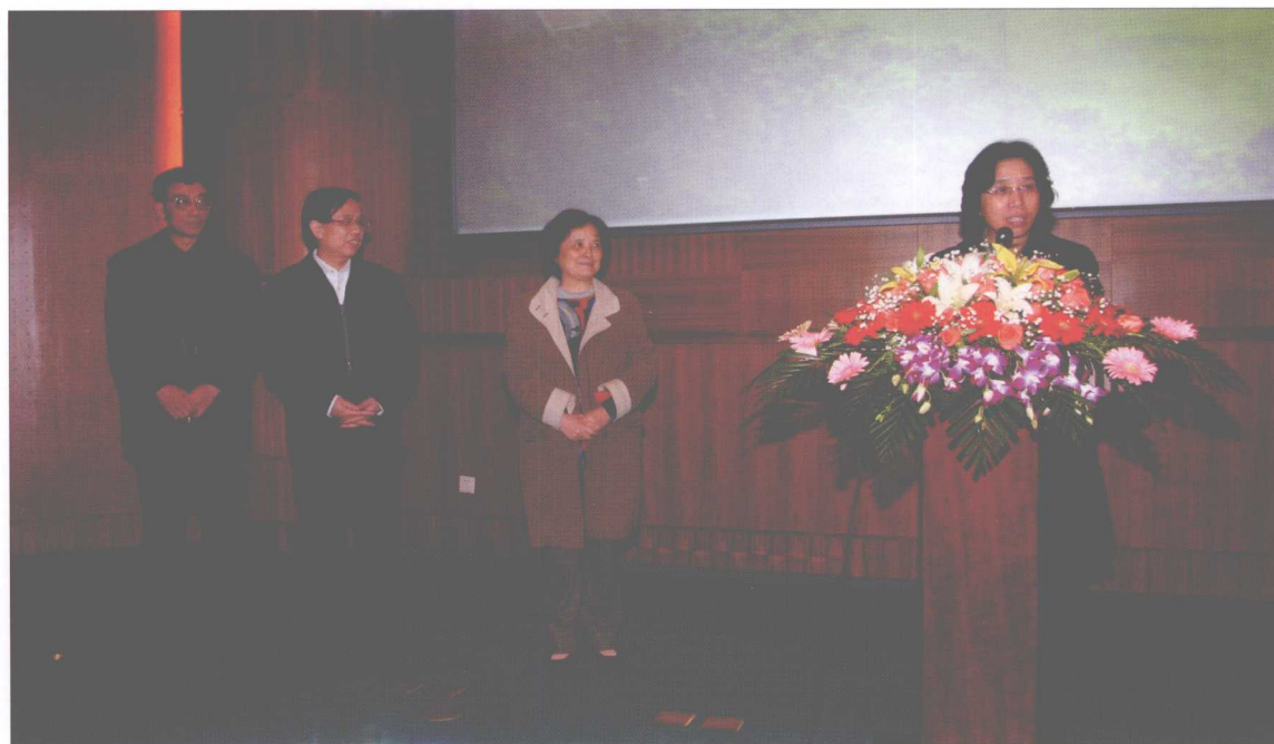
教育部副部长陈小娅（右一）来我校视察