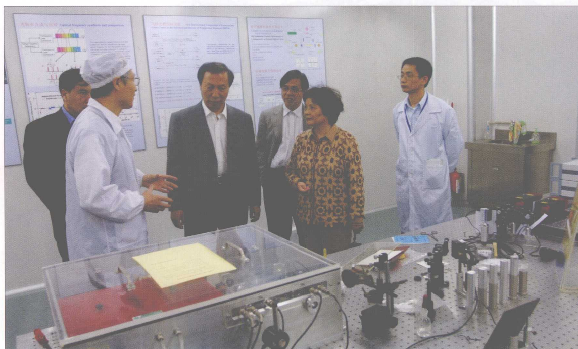
教育部副部长赵沁平（中）来我校视察