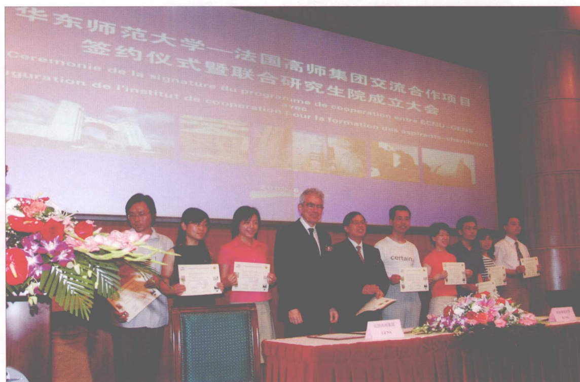
华东师范大学、法国高师集团交流合作项目签约仪式暨联合研究生院成立大会