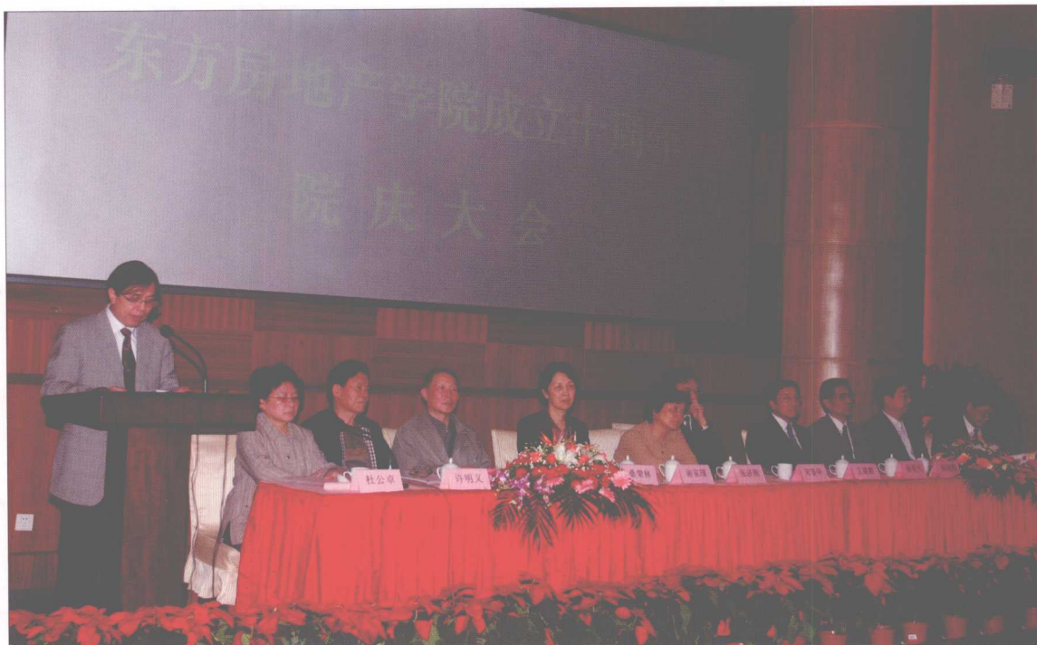
庆祝我校东方房地产学院成立十周年