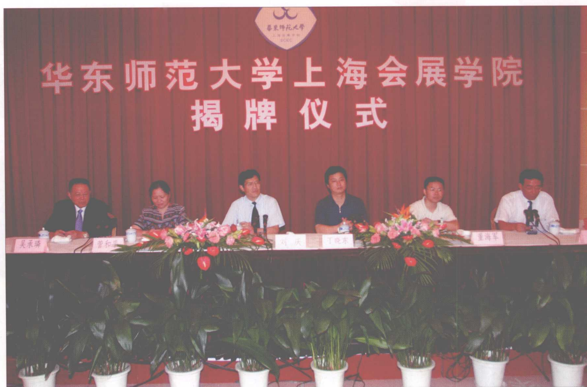
全国首家会展学院——“华东师范大学上海会展学院”成立