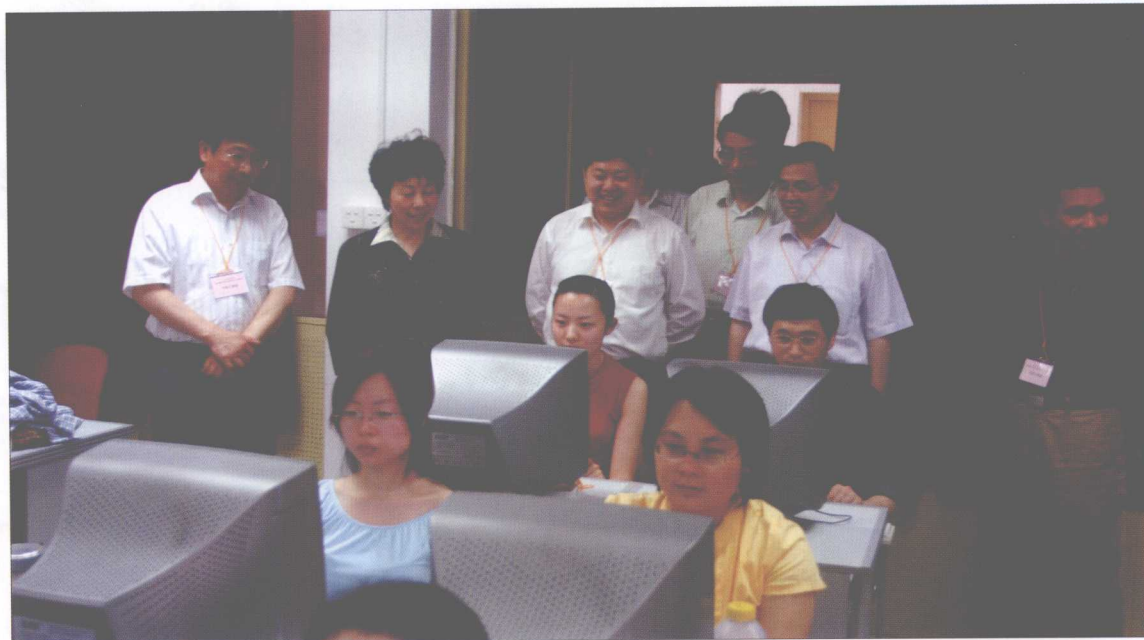
严隽琪副市长（左二）来我校视察