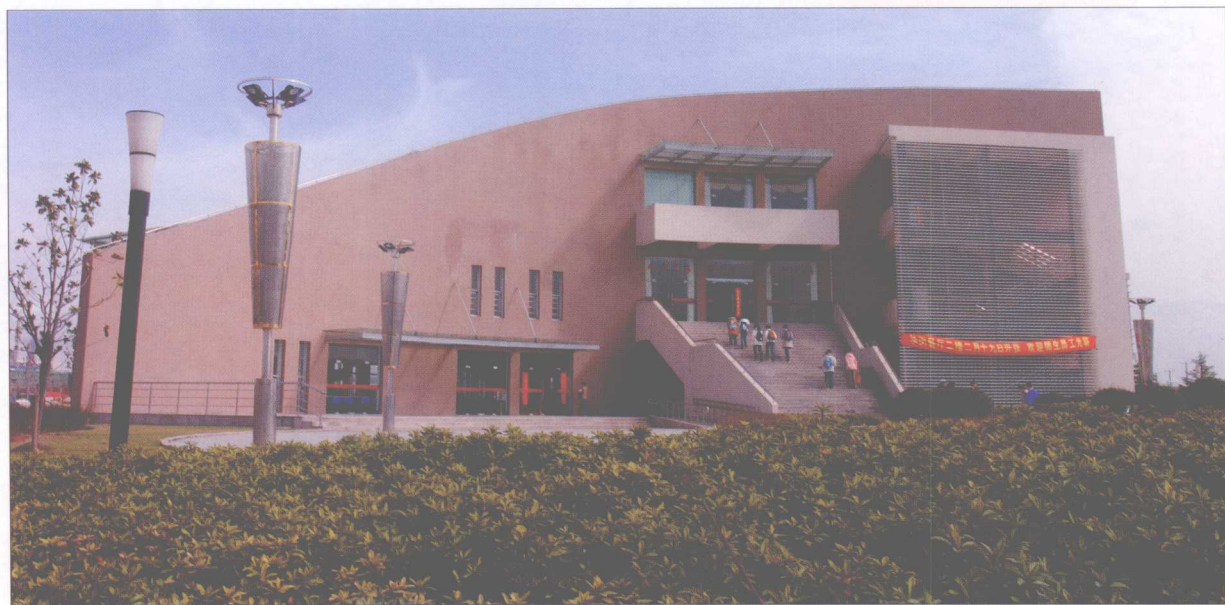
闵行校区食堂——华闵餐厅