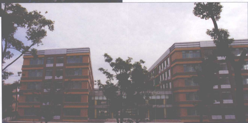
闵行校区法商大楼