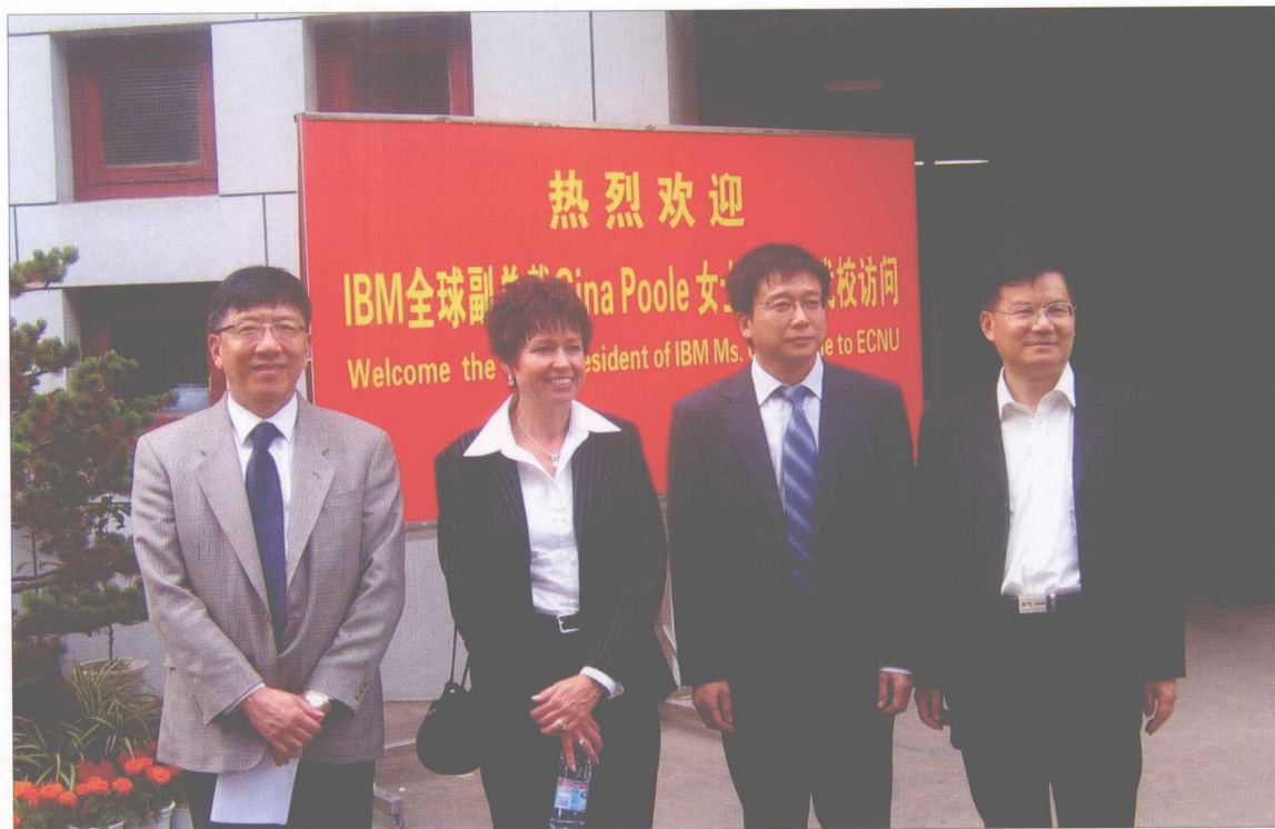
IBM 全球副总裁 Sina Poole 女士（左二）来我校访问