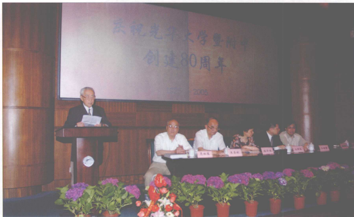
庆祝光华大学暨附中创建 80 周年