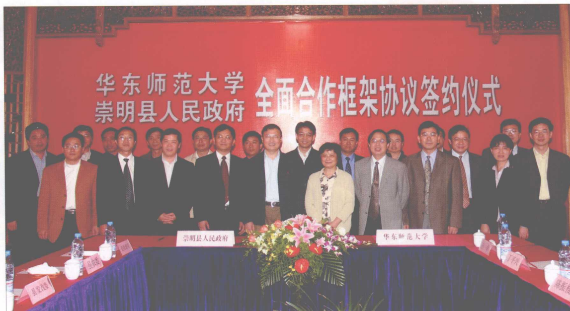
华东师范大学、崇明县人民政府全面合作框架协议签约仪式