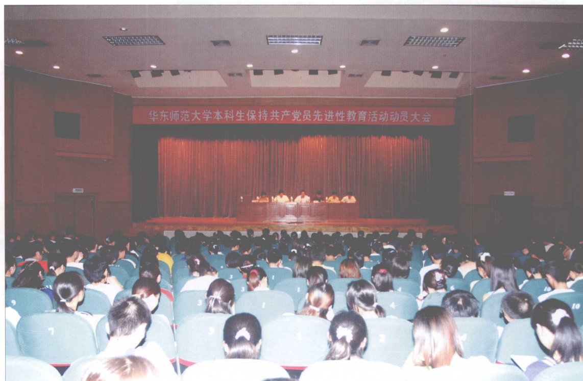
本科生“保持共产党员先进性教育活动”动员大会