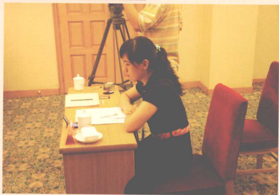
▶ 分分秒秒，一丝不苟