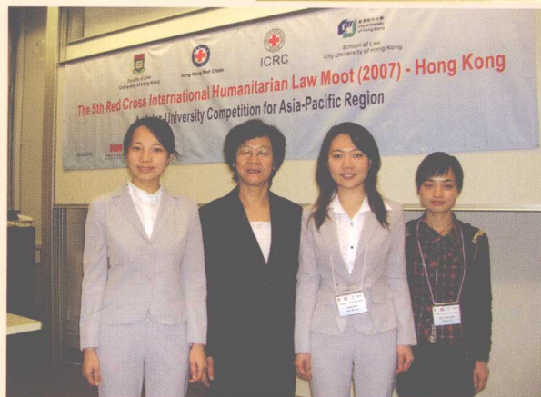
◀ 中国政法大学的3名队员与指导教师