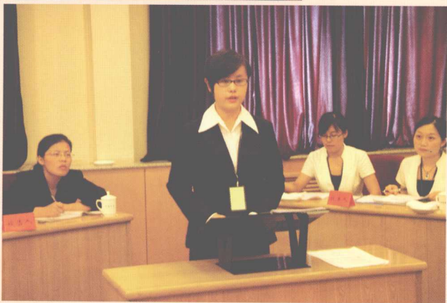
▶ “被害人有权 得到赔偿”