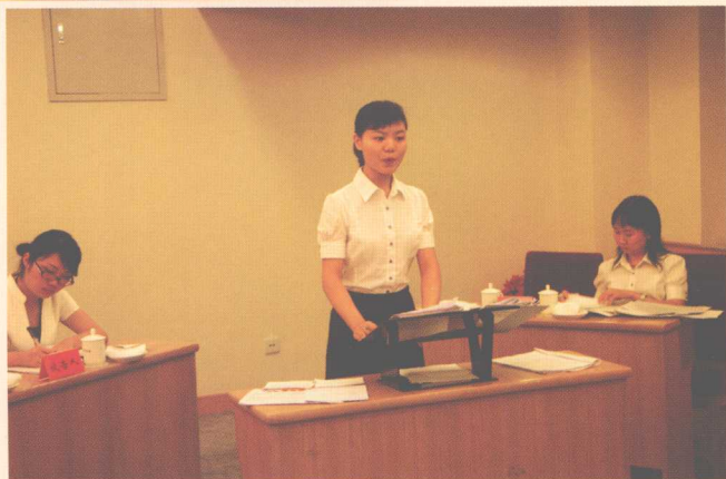
▶ “被告实施了国际刑事法院管辖权内的犯罪”