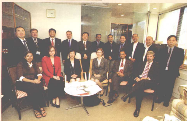
▶ 2007年国际人道法模拟法庭亚太赛区预赛法官