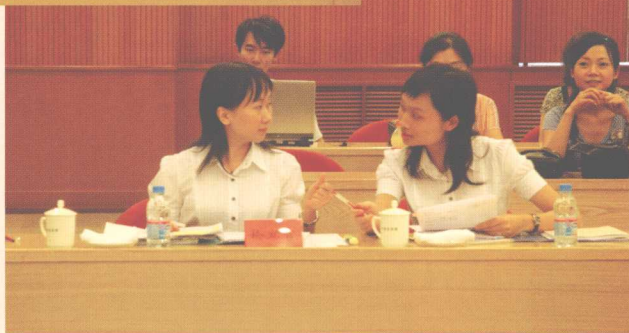
▶ 中山大学队在准备决赛