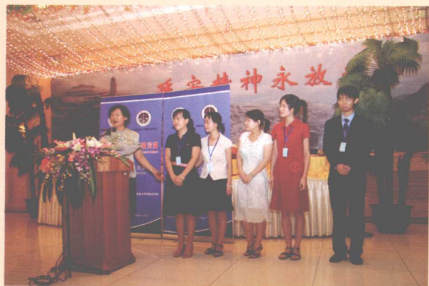
◀ 他们承办了一场大型比赛