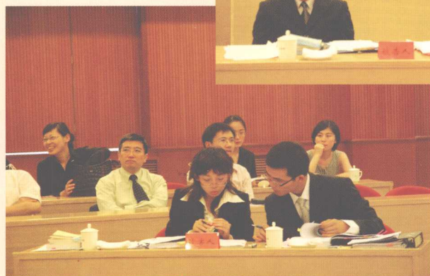
◀ 清华大学队在准备决赛