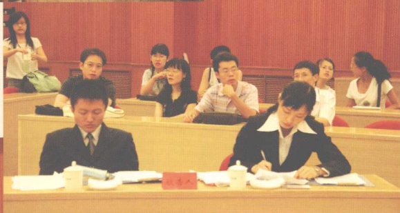
▶ 西南政法大学队在准备决赛