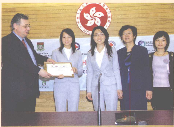
▶ 中国政法大学队首战亚太国际人道法模拟法庭竞赛