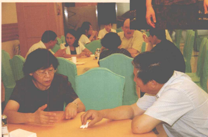
◀ 赛事是这样安排的