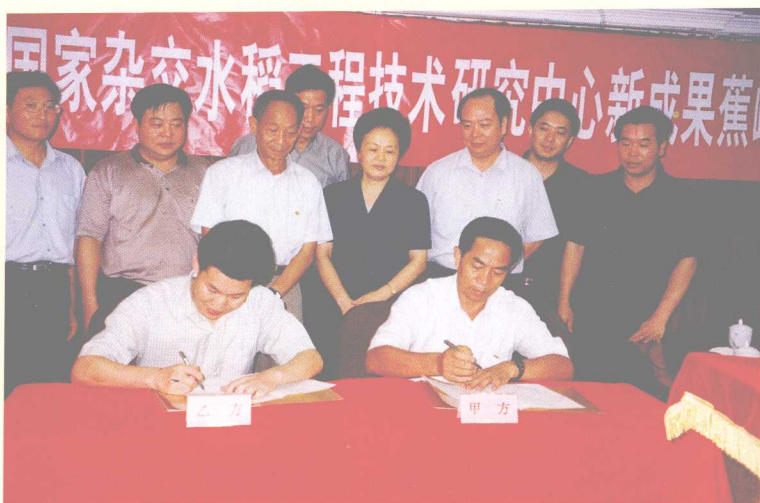
国家杂交水稻工程技术研究中心新成果蕉岭展示基地签字仪式，后排左三为袁隆平院士