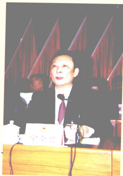
新当选的县政协主席宁全兴 在县政协八届一次会议上讲话