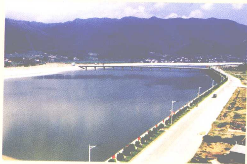
改造后的石窟河 蕉城段风采