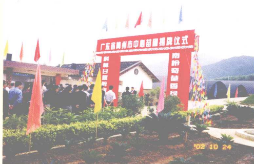
梅州市林业局领导与蕉岭县五套班子领导到县苗圃场举行中心苗圃挂牌揭幕仪式