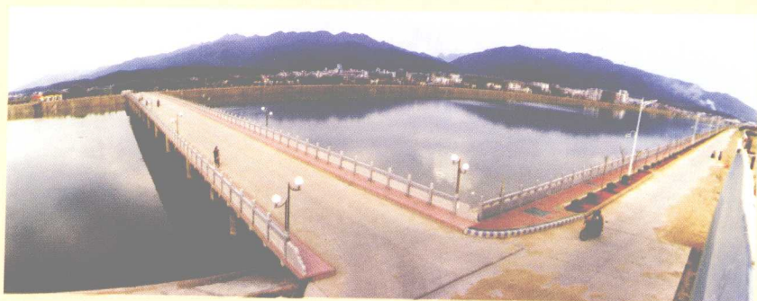
进入21世纪后动工兴建的中华大桥