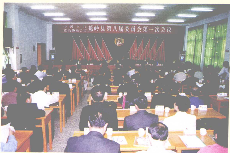
政协蕉岭县第八届委员会第一次会议会场