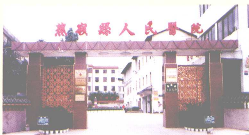
发展中的蕉岭县人民医院