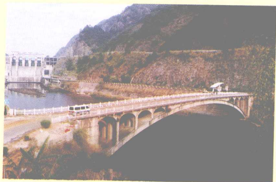
长潭水库大坝下端的长潭大桥