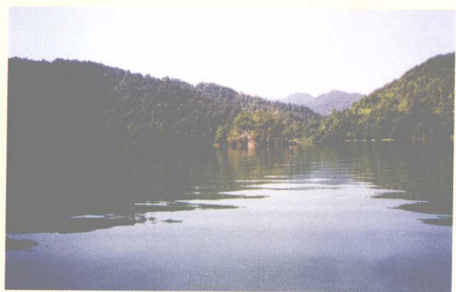
图为长潭自然保护区(库区林场)