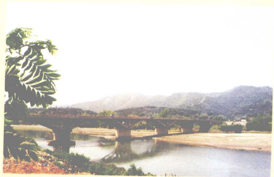
在谢晋元将军家乡兴建的晋元大桥