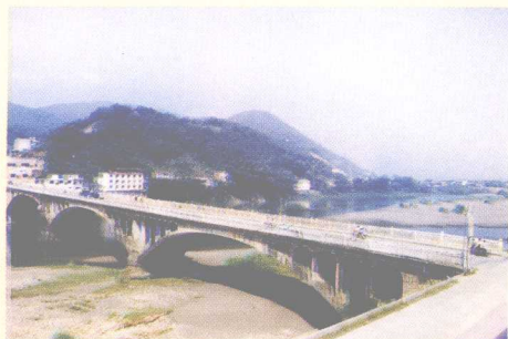
石窟河南端的新镇大桥