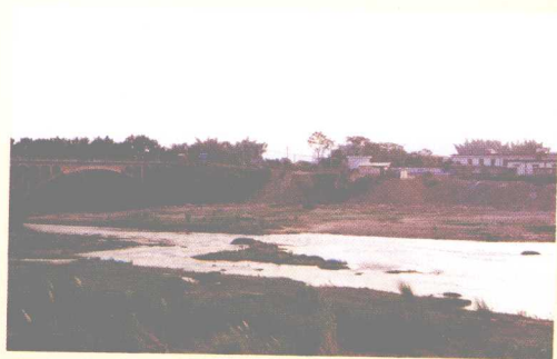
改造前的石窟河 蕉城段西堤