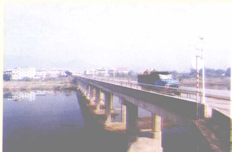
沟通蕉城与长潭两镇的 榕子渡大桥