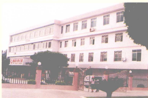
蕉岭县人民医院锡林 门诊大楼