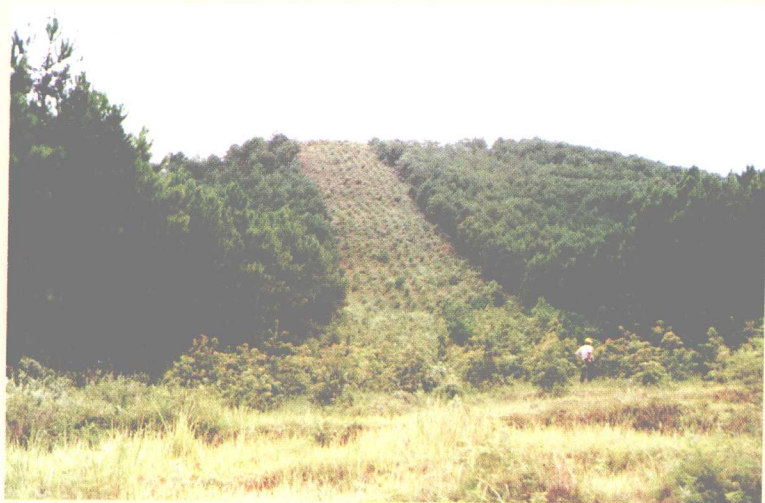
图为遍及全县山林之中的生物防火林带