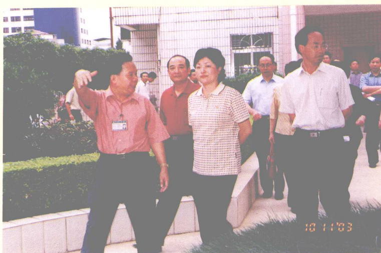
雷于蓝副省长在市委书记刘日知等陪同下亲临蕉岭县调研卫生事业发展情况