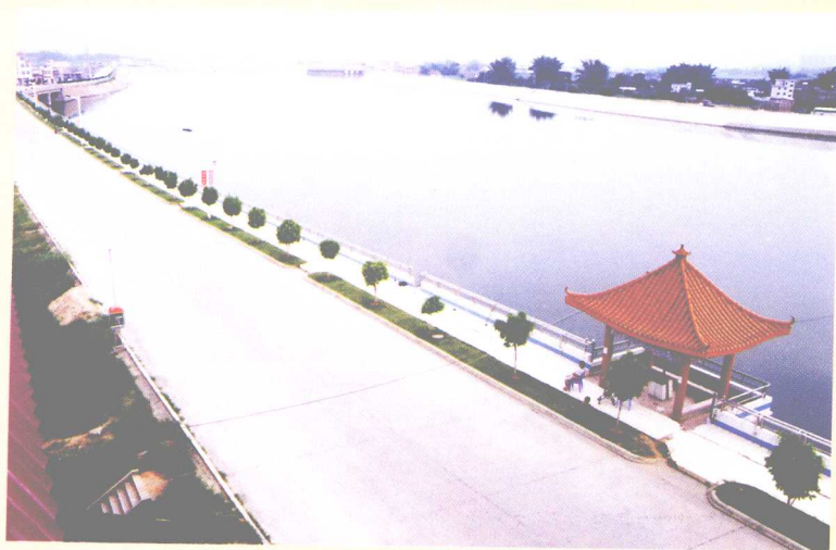
堤路一体的石窟河蕉城段防洪大堤