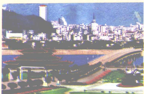
沟通县城至长潭 旅游区的逢甲大桥