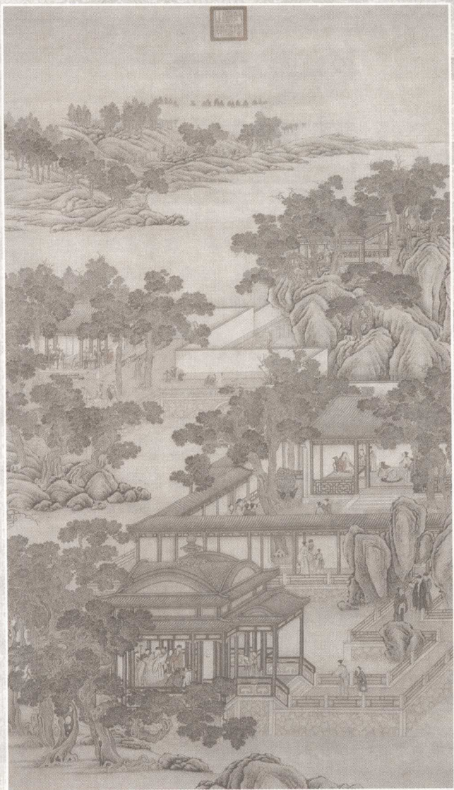
冻池冰嬉图 清·佚名