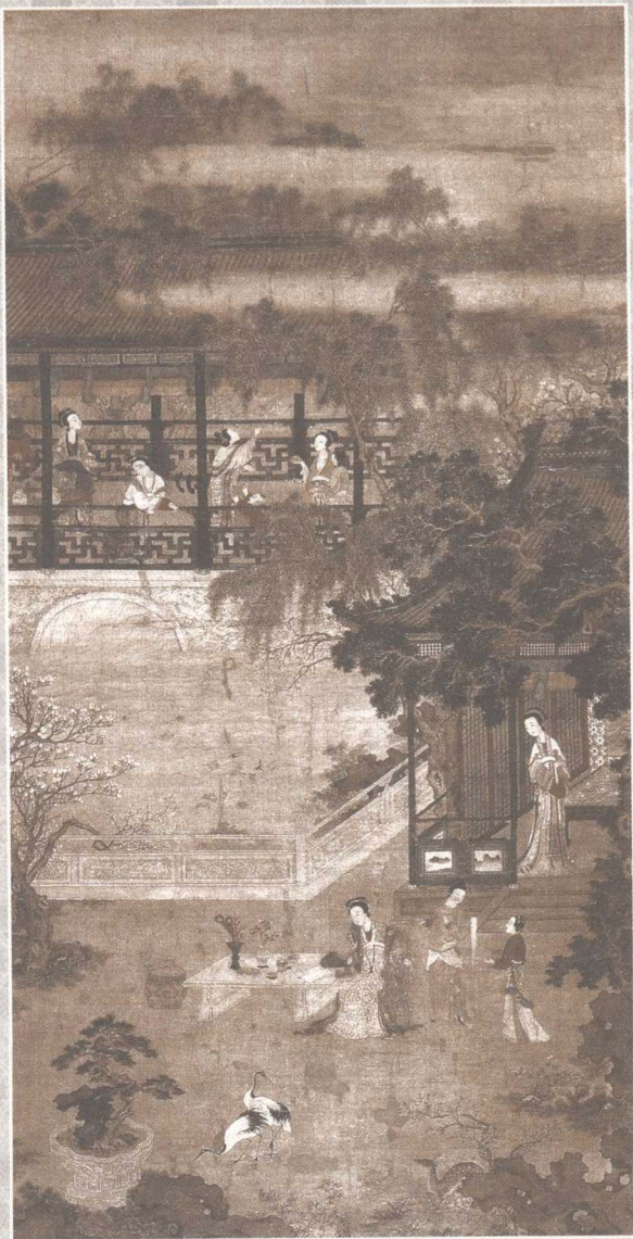
春庭行乐图 明·佚名