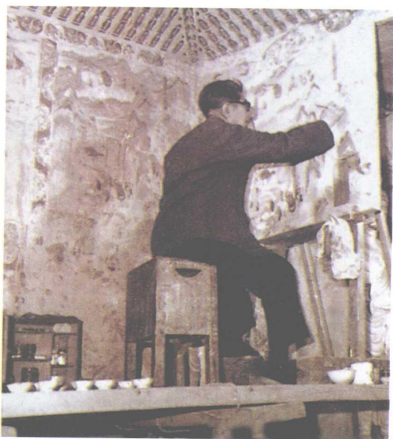
常书鸿在临摹壁画