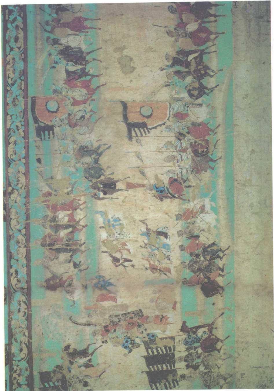
《百年敦煌学，艰辛百年，辉煌百年》插图