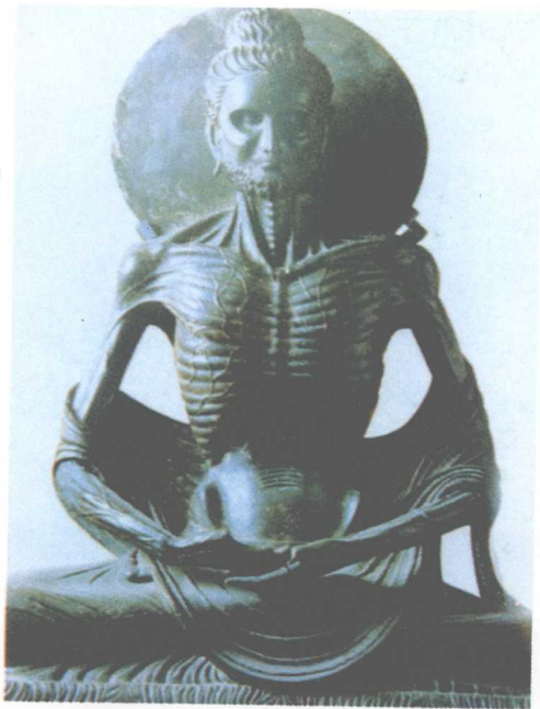
佛苦修像(印度犍陀罗雕刻)