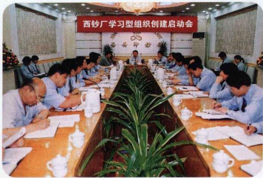
2003年5月西安印钞厂学习型组织创建 正式启动