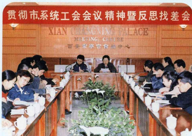
西安印钞厂创建学习型企 业步入第二阶段，自下而上开 展反思找差、对标管理