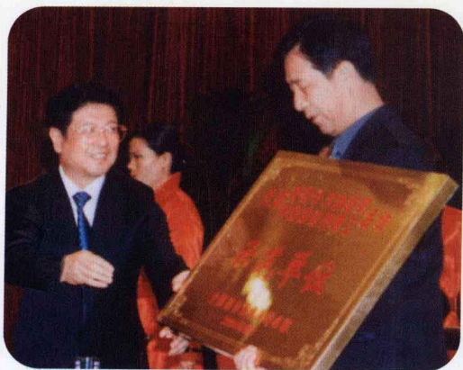
2004年10月17日，西钞厂被全国总工会等九部委命名为全国23家创建学习型组织示范单位之一。图为中共中央政治局委员、全国总工会主席王兆国同志（左一）向西安印钞厂党委书记王平顺同志颁奖