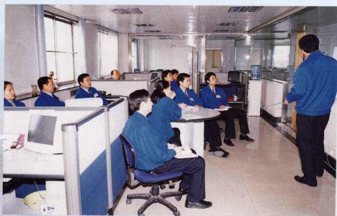
各车间、部室自发开展“周五课堂”等团队学习，进行技术业务交流、研讨，知识共享