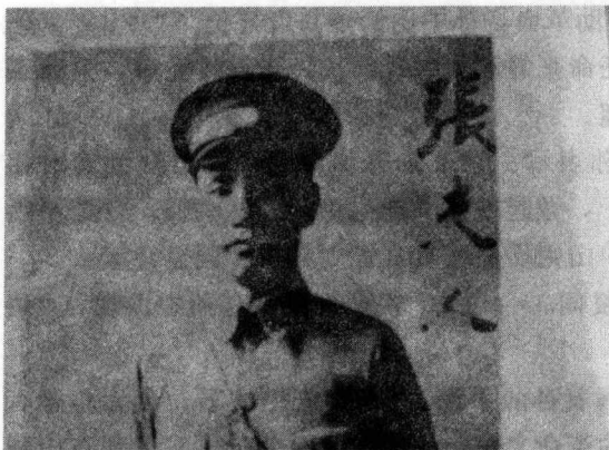
蒋介石赠送张夫人的戎装照

29日在上海加入了中华革命党，成为较早加入中华革命党的党员之一。鉴于与陈其美的盟兄弟情谊，及其在党内的地位与作用，张静江早为蒋介石所垂青，在加入中华革命党时，蒋介石专门请张静江做监誓人。