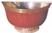
按藏族传统图案加工银器。

原来，这条巷是大昭寺左侧的吉日巷。这一带都统称八廓街，是拉萨最有名的老城的市中心。工匠们告诉我们，他们是鹤庆县新华村来的，整条巷都有他们村的同行。店铺一个挨着一个，既