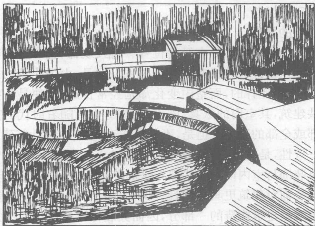
图 1-4 从莱特“落水别墅”客房二楼向外眺望别墅环境

我们看到莱特的“落水别墅”的室内外空间组织的协调性(见图1-4),看到“蓬皮杜文化中心”空间的完整与协调,看到许多优秀建筑的室内设计的完美与整体感,就不能不感叹我们那些随意的不