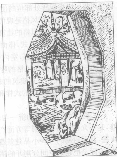
图 1-3 苏州留园曲谿楼门洞

从设计工作的分工看,建筑装饰与室内设计应是统一的。我国的现代室内设计,实际上是从现代建筑的装饰工作起步的。城市发展,离不开环境规划与建筑等构筑物的兴起。1959年,我国首都北京进行大规模的城市建设和改造。当时的人民大会堂、历史博物馆、北京火车站、民族文化宫等十大建筑受世人瞩目。当时中央工艺美术学院师生,特别是建筑装饰系(现在环艺系的前身)的老师和同学都参与了建筑装饰和室内设计工作。通过设计实践,不仅使十大建筑的装饰工作取得了很大成功,而且为我国现代建筑装饰和室内设计创造了良好的开端,积累了宝贵而丰富的经验。