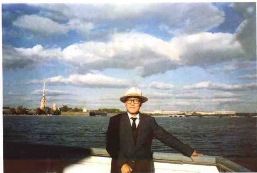
作者摄于列宁格勒风景如画的涅瓦河畔（1990年9月）