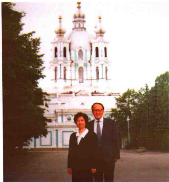
作者与夫人合影于列宁格勒斯莫尔尼宫里的教堂前 (1991年6月)