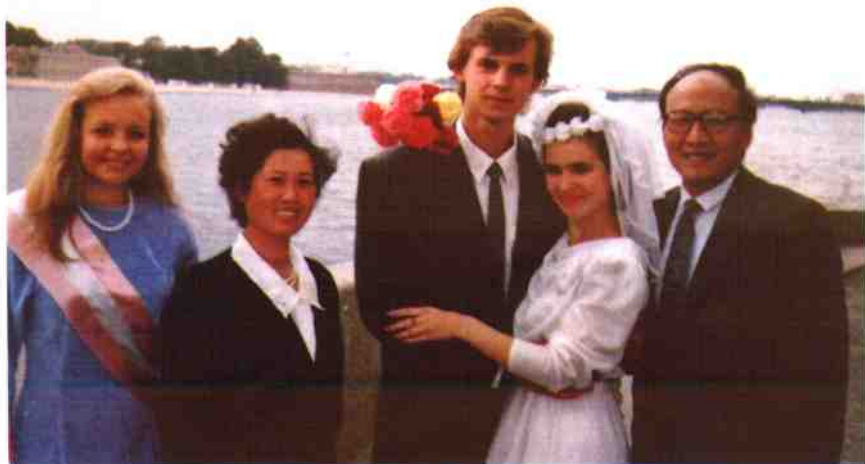
作者偕夫人参加俄罗斯朋友的婚礼(1991年)