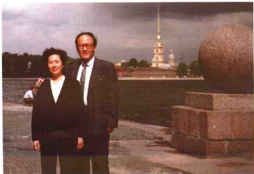
作者与夫人合影于涅瓦河畔（1991年6月）