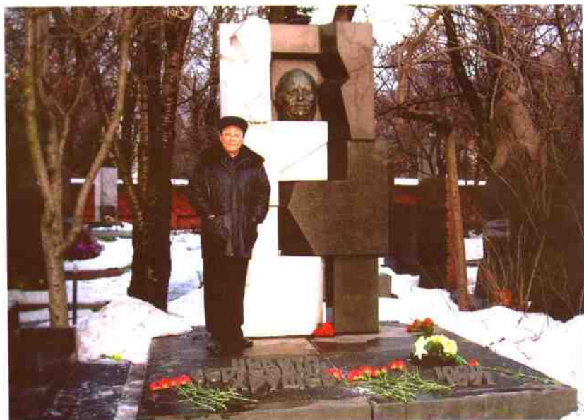
作者在赫鲁晓夫墓碑的留影（2004年12月）