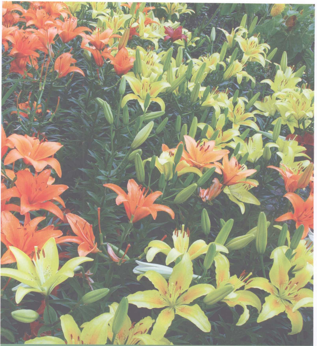
图解家居健康花草