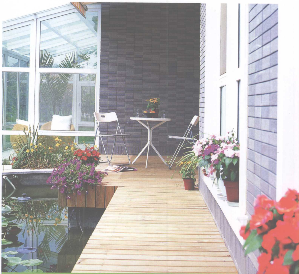
图解家居健康花草