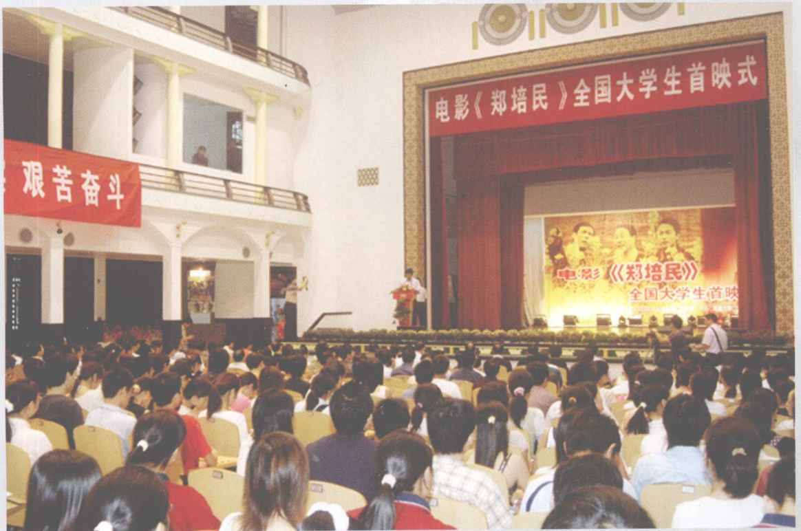
2004年9月15日，电影《郑培民》全国大学生首映式在学校大礼堂隆重举行。