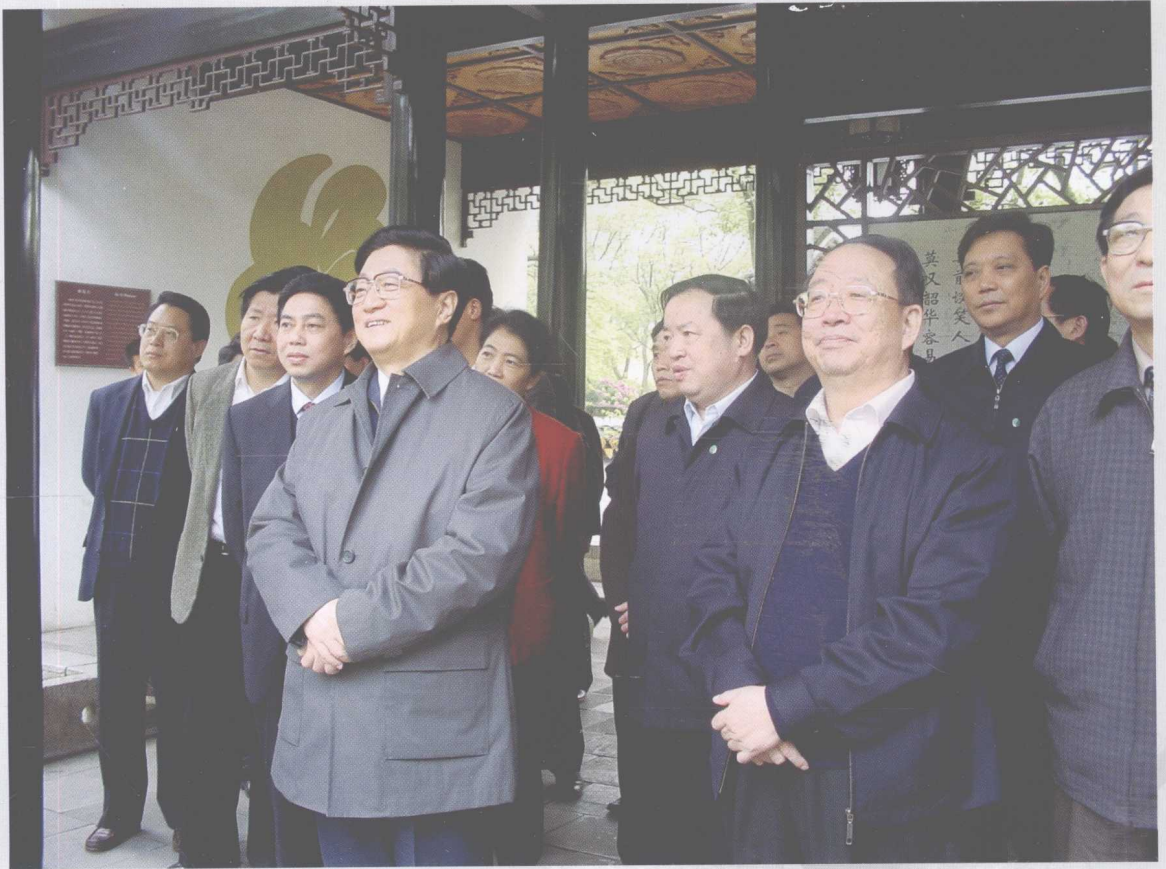
2004年3月27日，中共中央政治局常委、国务院副总理黄菊，在省委书记杨正午、省长周伯华、国防科工委主任张云川以及湖南大学党委副书记王耀中等领导的陪同下参观岳麓书院。