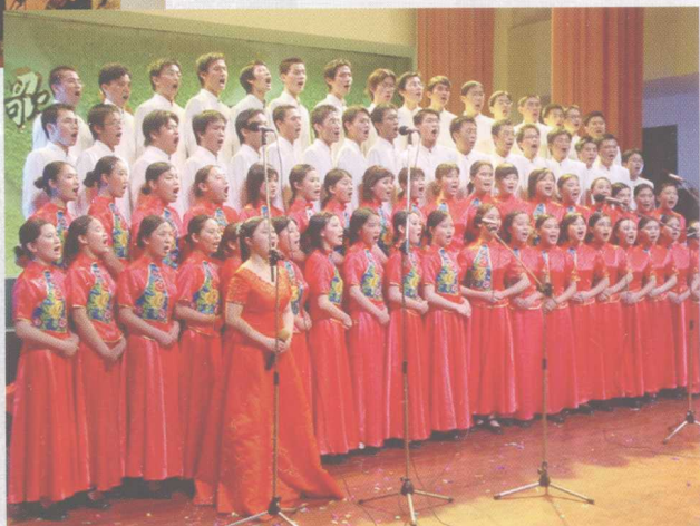
学生参加歌咏比赛。