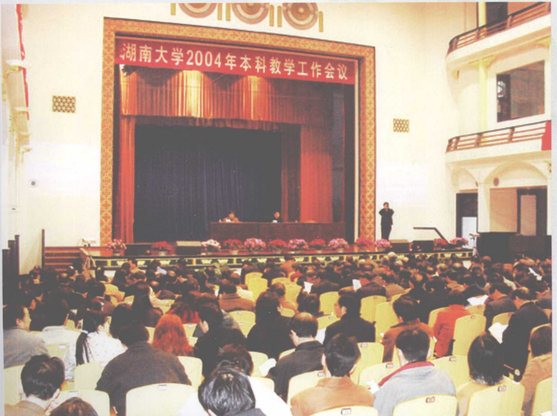
2004年3月，学校部署本科教学评建创优工作。