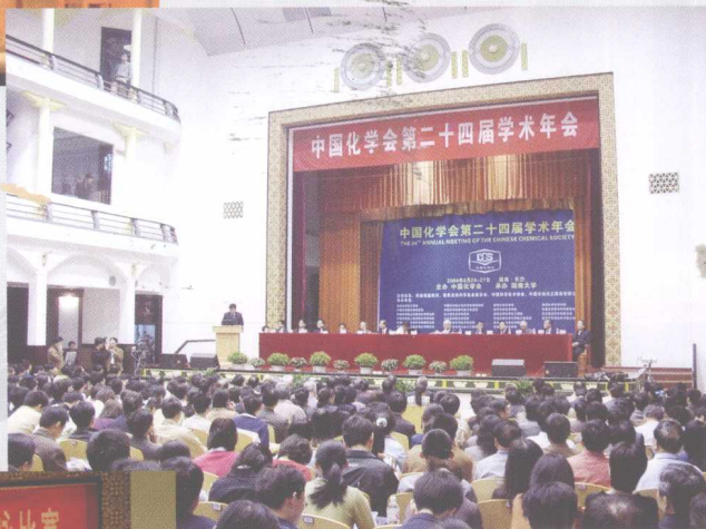
2004年4月，中国化学会第二十四届学术年会在湖南大学召开，2000余名中国化学界精英会集湖南大学。