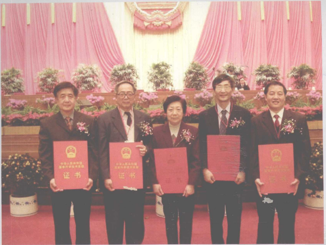
俞汝勤院士领衔的化学计量学研究小组成果“复杂体系成分分析及波谱结构解析的化学计量学”获得国家自然科学二等奖。图为2004年2月20日俞汝勤院士（左二）在人民大会堂受奖盛况。