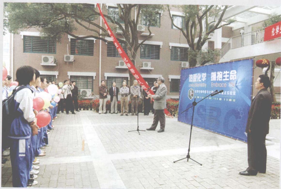
2004年10月11日，湖南大学国家重点实验室首次向公众开放。