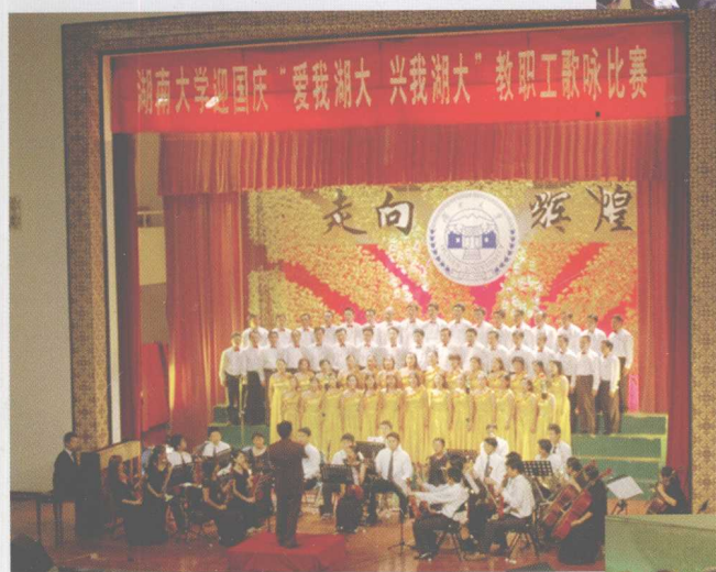
2004年9月，学校举行“迎国庆‘爱我湖大，兴我湖大’教职工歌咏比赛”。