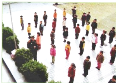
✿爸爸警察给我们上课。“立正！”看我们像不像解放军？！