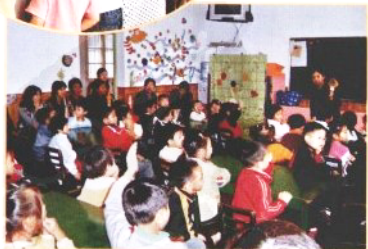
❁ 每学期定期的家长开放日活动使家长更好地了解幼儿园。