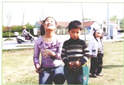
✿妈妈，我们的风筝飞上去了吗？我们一起做的呢？它在哪儿？