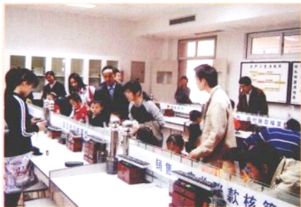
❁ 家委会组织参观泰山核电站。