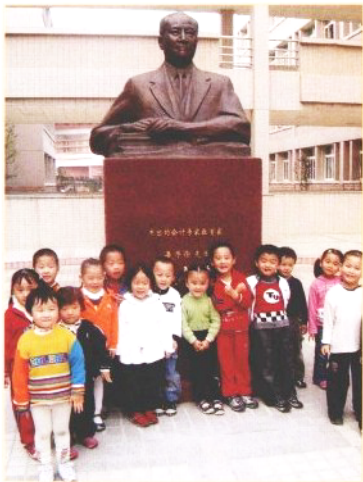
❁ 参观妈妈的工作单位——嘉兴学院,在我国杰出会计专家、教育家潘序伦先生雕像前留影。