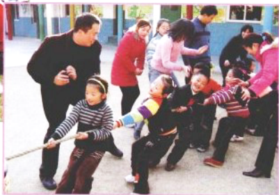
✿丰富多彩的亲子运动会，爸爸妈妈给我们加油！