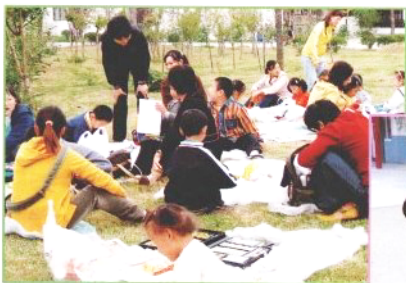
✿南湖是革命圣地，嘉兴的骄傲。我们和爸爸妈妈一起用画笔描绘南湖美丽的秋景。