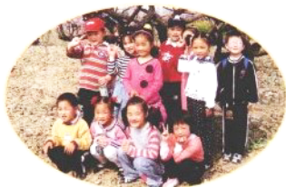
✿美丽新农村 凤桥桃花节。比比——我们和桃花谁更美？