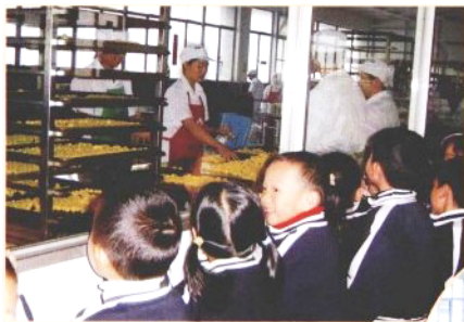
❁ 香香的蛋糕哪里来?老师带我们参观“美丽家蛋糕”制作工厂。