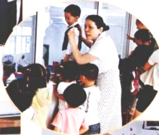
❁ 老师带我们参观嘉兴名企“五芳斋粽子”工厂。