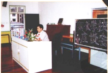
❁ 邀请专家来园作家长学校座谈会嘉宾。