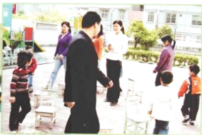
✿爸爸妈妈和我们一起上课游戏，我们是朋友。