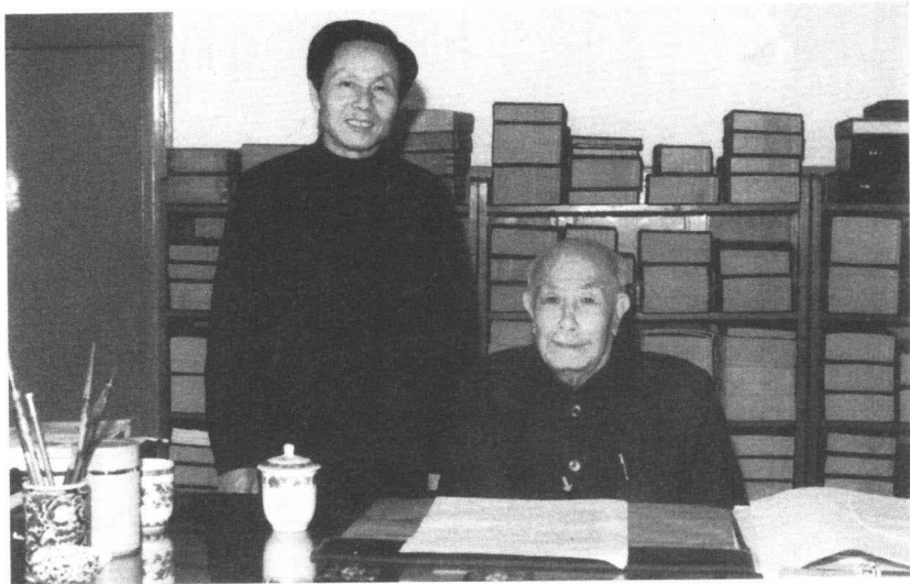
■ 1993年，吴德与访谈者朱元石合影。

届十二中全会上递补为中央委员。1972年后，任中共北京市委第一书记、北京市革命委员会主任，北京卫戍区第一政治委员，北京军区政治委员。1969年、1973年分别在中共第九次、第十次全国代表大会上当选为中央委员，是第十届中央政治局委员。是第四届、第五届全国人大常委会副委员长。现在根据1993年的访谈整理出来的这本吴德口述史，一共集有13篇，并不是依谈话顺序的先后，而是大致按所谈事情的历史时间先后编排的，都是他在十年“文革”风雨中所经历的一些重大事件。我们整理出来后都经吴德同志看过，并在大多篇章上留下了他的修改文字。作为历史工作者，我们希望这本口述史，能为国史研究者提供严谨和宝贵的一方记录。