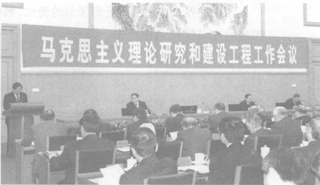
马克思主义理论研究和建设工程工作会议