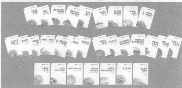
学习宣传党的十七大的图书琳琅满目

中国特色社会主义理论体系之所以完全正确，之所以能够引领中国不断发展进步，最根本的就在于它既坚持了马克思主义基本原理，又注重结合中国实际，深刻把握我国基本国情及其经济社会发展的阶段性特征，反映了我国社会进步的新要求和人民群众的新期待，有着鲜明的实践特色；深深地扎根中国土壤，把马克思主义真理的力量熔铸在民族的生命力、创造力、凝聚力之中，有着鲜明的民族特色；顺应时代潮流，把握时代脉搏，反映时代要求，有着鲜明的时