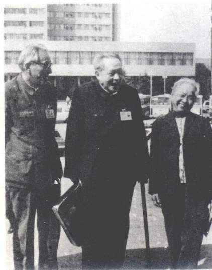
步入政协七届一次会议会场