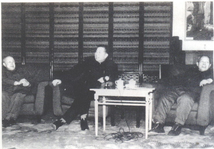
与卫生部长崔月犁(中)、 世界著名科学家钱学森(左)交谈