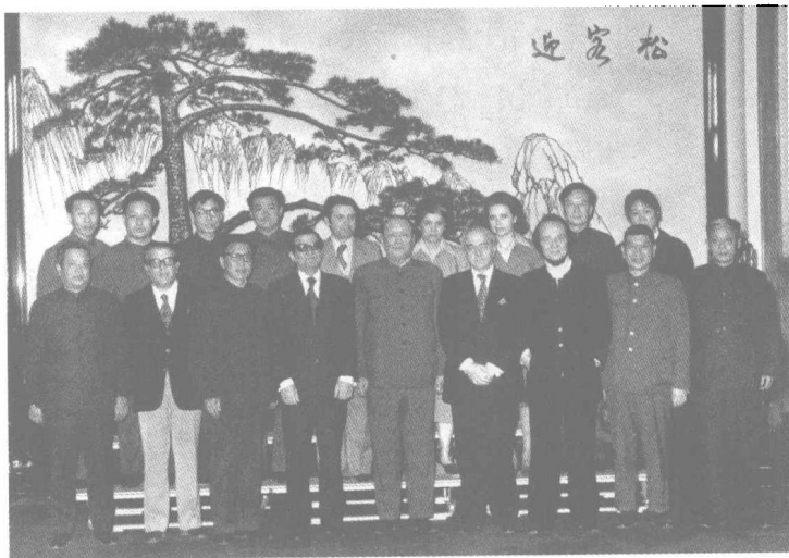
乌兰夫接见希腊 新闻代表团

1978年,刚刚结束“文化大革命”十年动乱的中国,要打破封闭的局面,需要了解世界,更需要世界了解中国。就是在