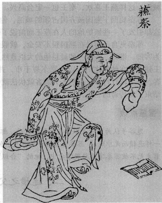
苏秦像，图出自《鬼谷四友志》。