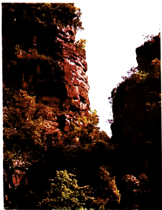
小井马撒尿出现的断层地貌