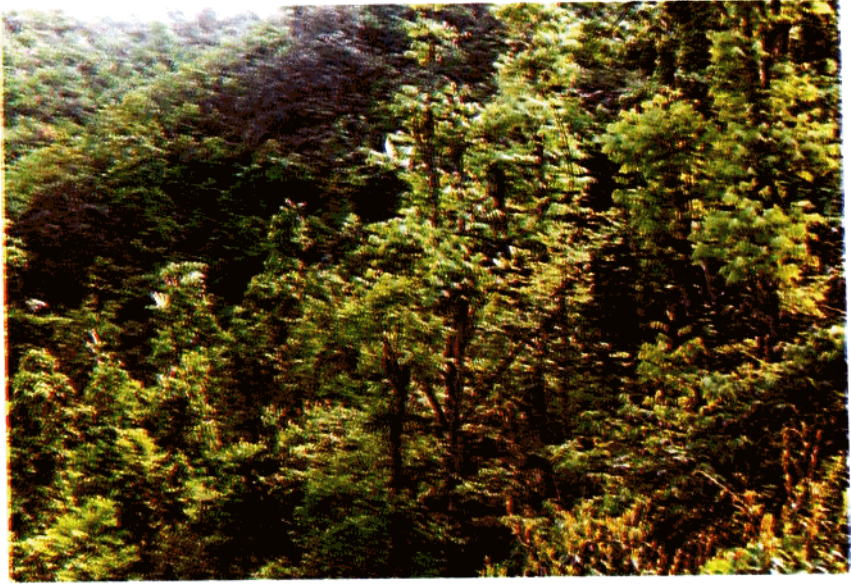
分布在下横江的伯乐树 ( Bretschneidera sinensis ) 林