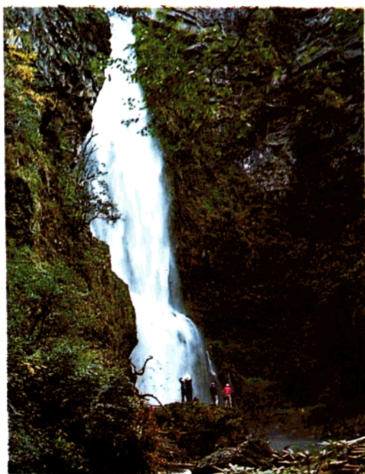
龙潭横切河谷的断裂形成的断崖瀑布