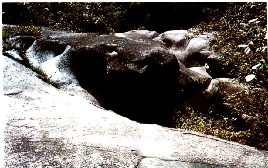
小溪洞由于地壳上升流水下切在花岗岩中形成的水蚀槽