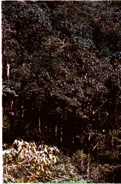
分布在河西垅的鹿角 栲( Castanopsis lamontii )林