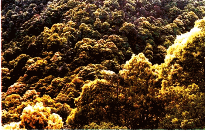
分布在行洲的甜槠 ( Castanopsis eyrei )林