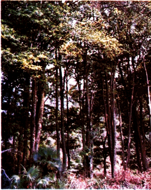
分布在利州的蚊母树( Distylium myricoides )林 8-8