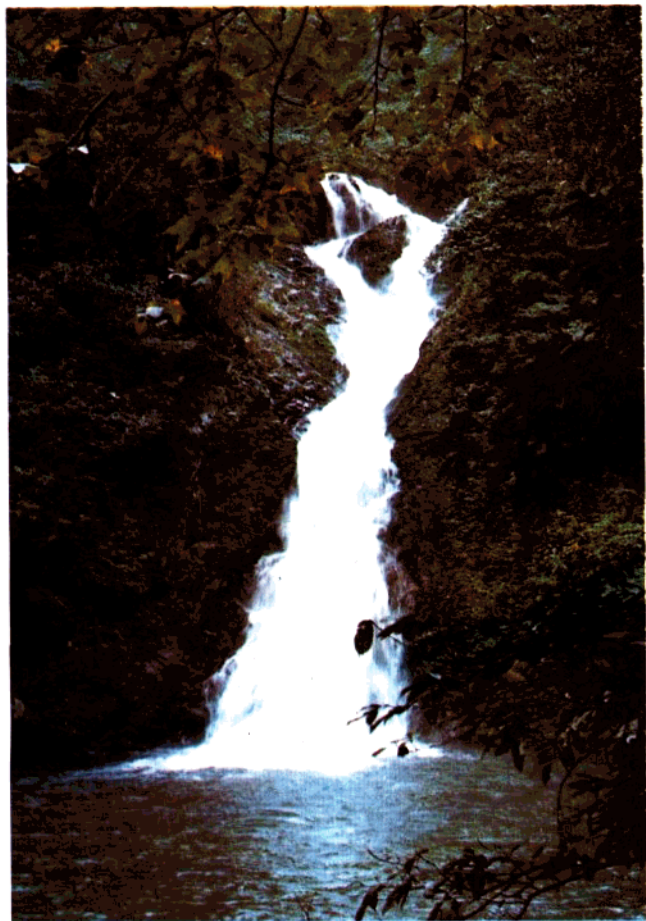
小井瀑布玉女仙姿