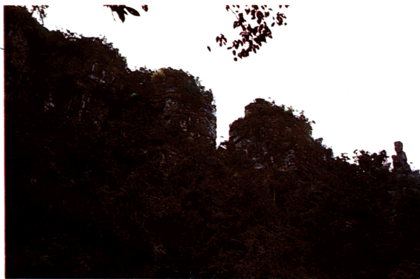
小井海螺峰断块山、由活动断裂形成的断块山貌 2-9