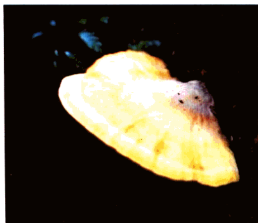
分布在小井的硫黄菌 (硫色, 钩孔菌) Laetiporus sulphureus (Fr.)Murr. Donk. (可食用)