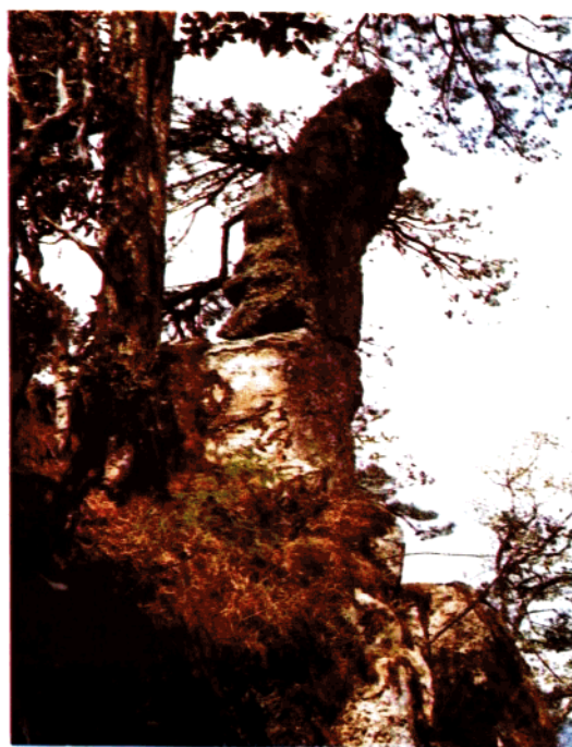
笔架山“佛手指天” 2-11