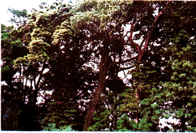
分布在黄垌的湘楠( Phoebe hunanensis )林