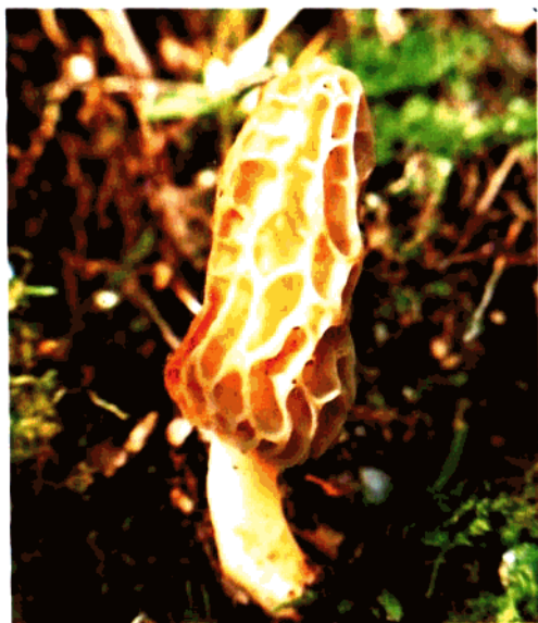
分布在小井的尖顶羊肚(Morchella conica Pers.)(可食用)