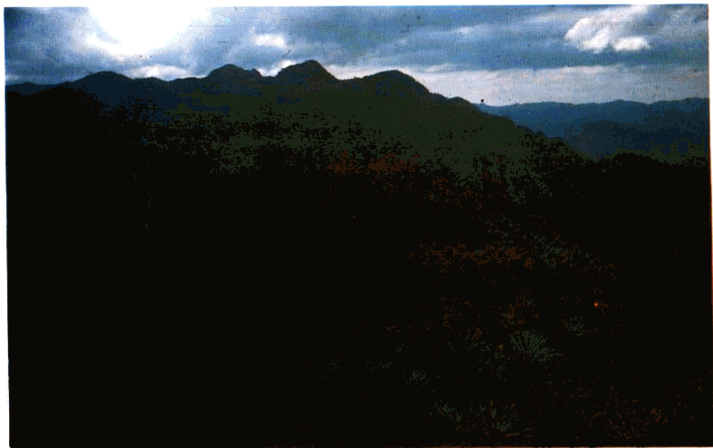
下井锯齿状单面山脊