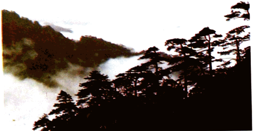
五指峰云海松涛——台湾松( Pinus taiwanensis )林