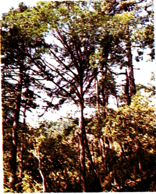
分布在笔架山的福建柏( Fokienia hodginsii )林