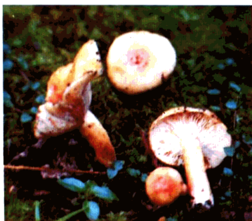
多汁乳菇 Lactarius Volemns(Fr.)Fr. (可食用)