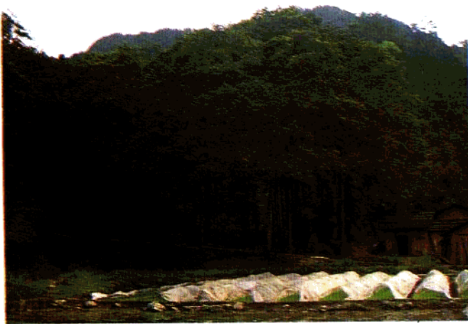
分布在行洲的苦槠( Castanopsis sclerophylla )林