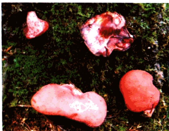
分布在老鸦山的牛舌菌 (肝色牛排菌) Fistulina hepatica (schaeff.·)Fr. 可食用)