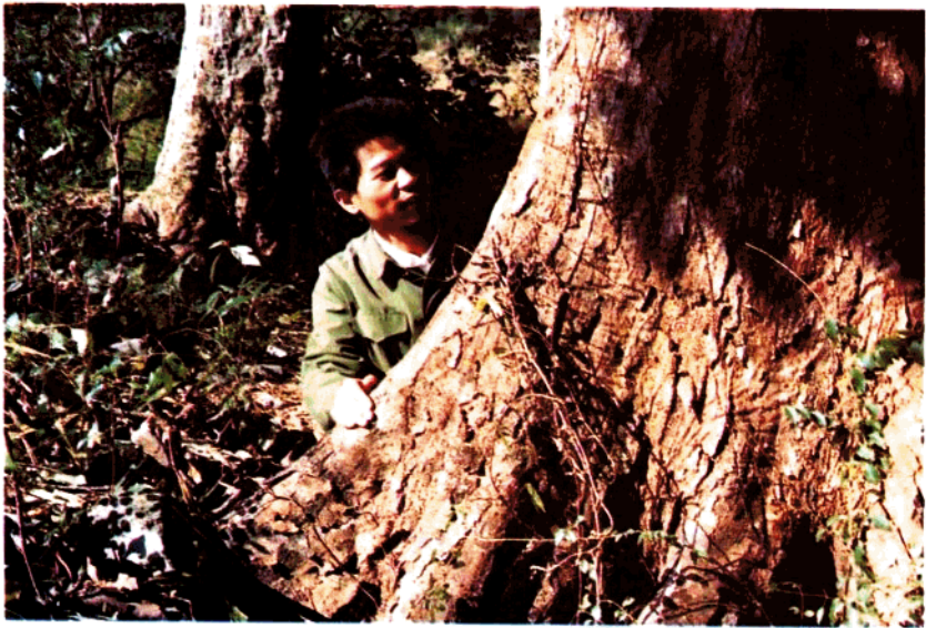
湘洲常绿阔叶林中钩栲( Castanopsis tibetana )的巨大板状根 8-10