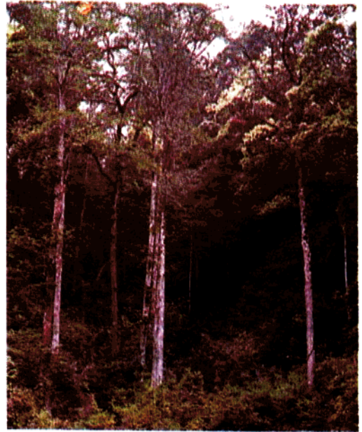
分布在湘州的木莲( Manglietia fordiana )林