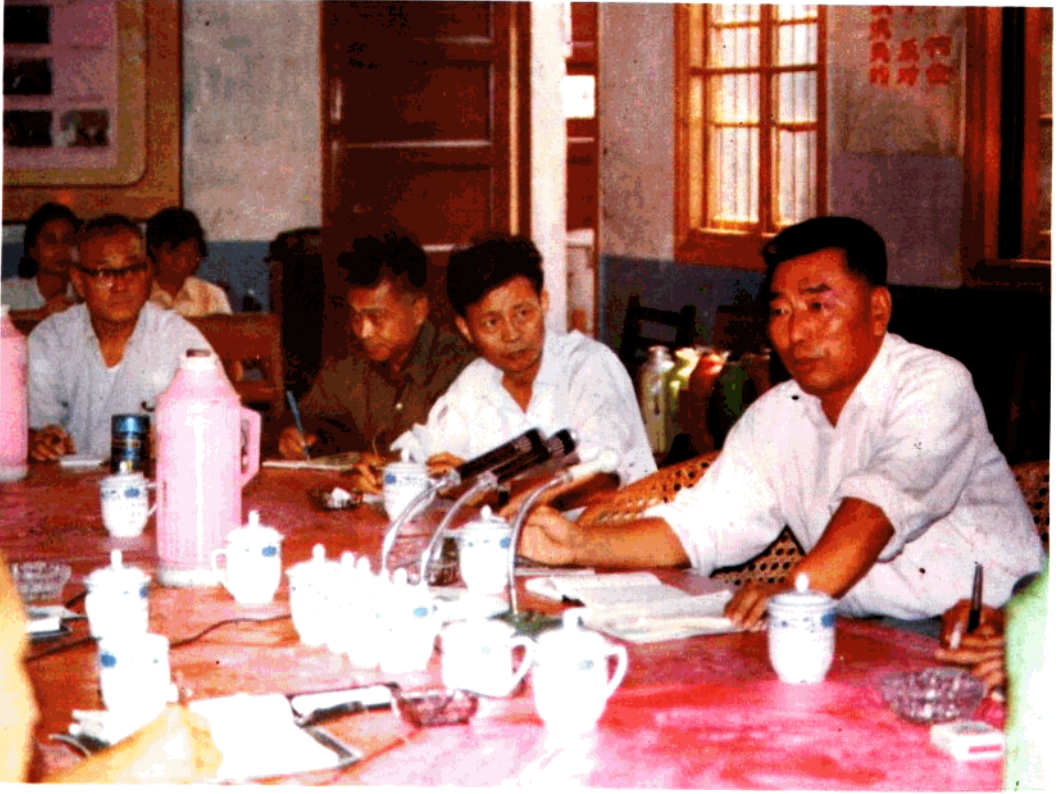
江西省常委、副省长（右一）王昭荣同志在考察工作会议上与专家座谈。