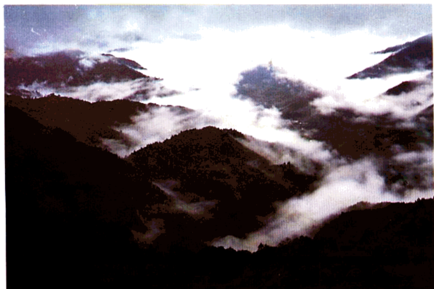
井冈山黄洋界全貌