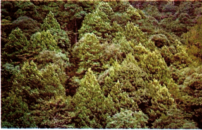
分布于行洲三级电站的东京白克木 ( Exbucklandia tonkinensis )林外貌