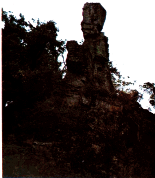
秀才石 (小井) 2-10 (池仙照)