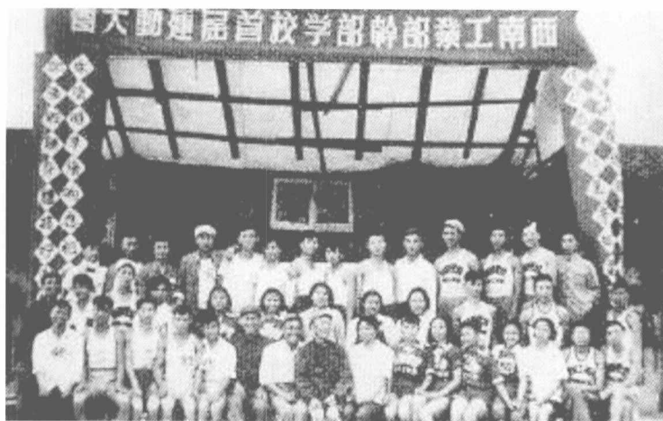
西南干部学校首届运动会（1950年10月）