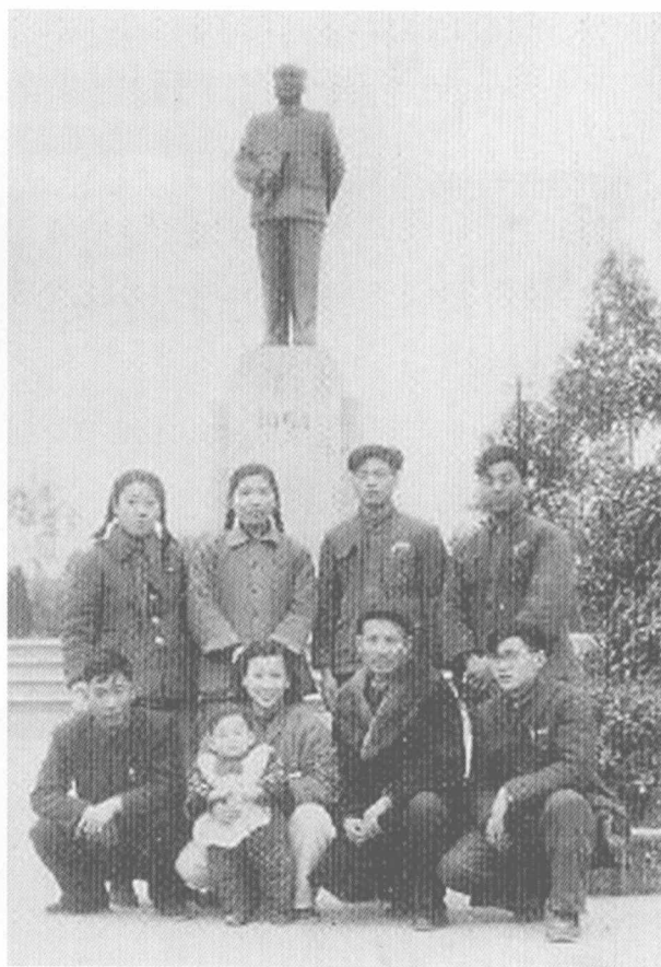
重庆建筑材料工业专科学校部分职工在毛主席塑像前合影留念（1958年10月）