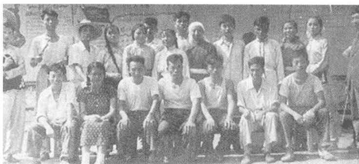
重庆建筑材料工业学校文工团到矿山演出（1959年10月）