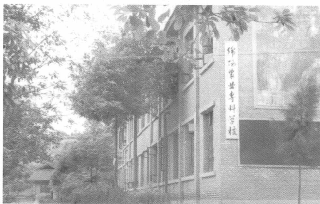
绵阳农业专科学校校址