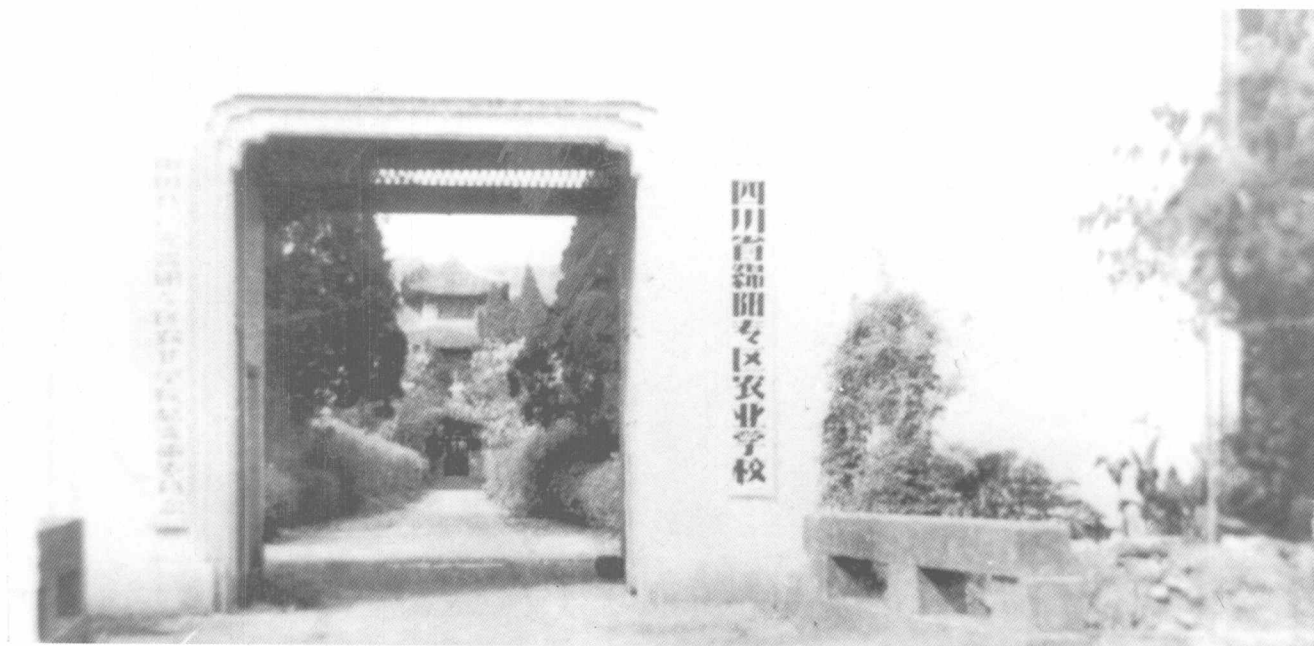
四川省绵阳专区农业学校