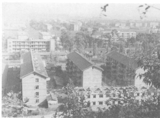
绵阳经济技术高等专科学校校舍鸟瞰