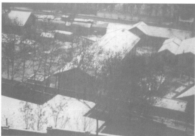
绵阳经济技术高等专科学校校舍