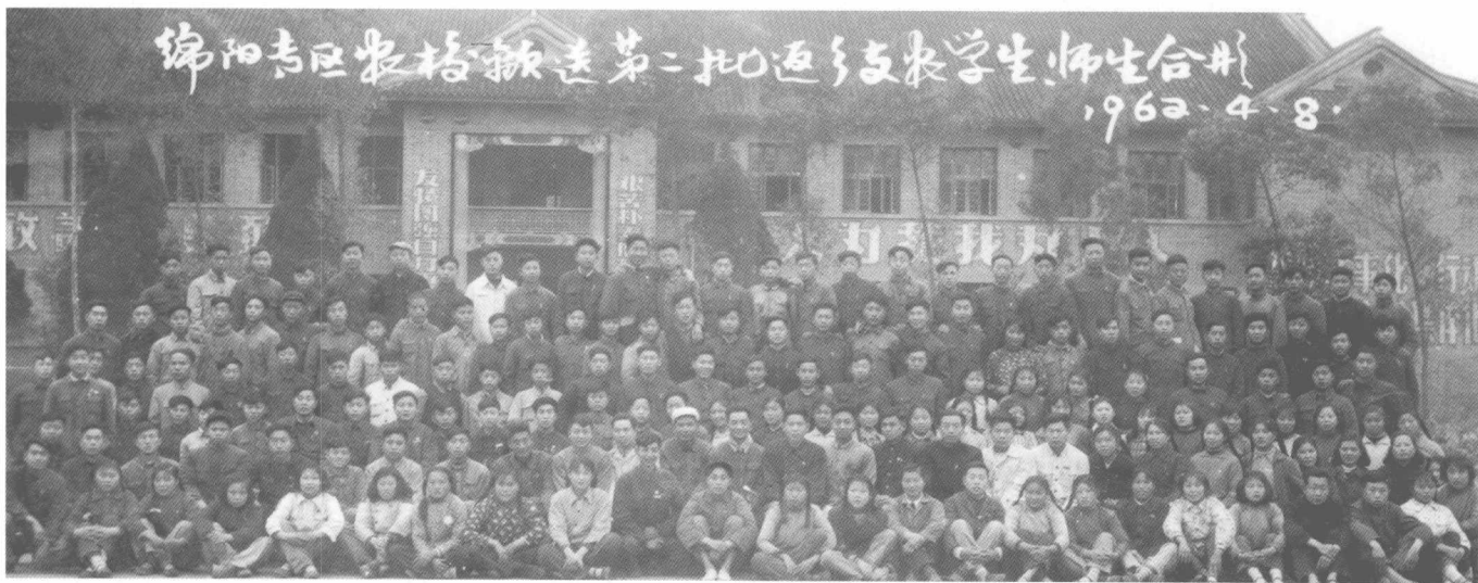
绵阳专区农校欢送第二批返乡支农学生，师生合影