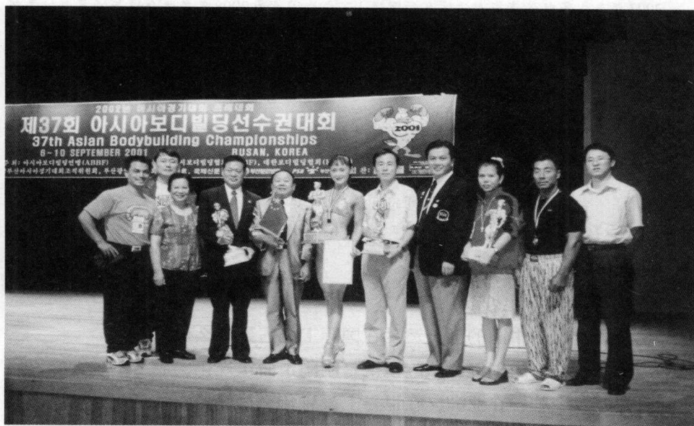
2001年李庆华总教练带领国家健美队参加韩国釜山亚洲健美锦标赛，获五枚金牌，创中国健美队有史以来最好成绩记录。

李庆华： 我是体操运动员，体操运动员是有表演天赋的，肢体语言更加丰富，那么我们不但是将中国的女子运动员形体练得优美了，而且要求她的乐感和动作的优美度，在这一点上我下了很大功夫，让女运动员有一个飞跃，不再是很笨拙的动作，而真的是像一个艺术家，在舞台上能够展示出来女性