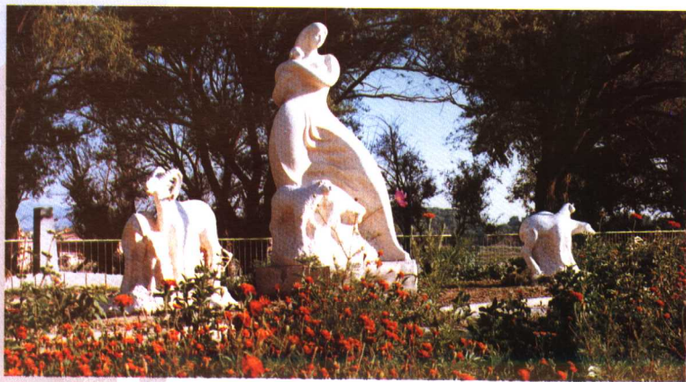
巴彦浩特街心公园一角

自春秋时代起，狄、匈奴、鲜卑、柔然、党项、回纥、突厥、蒙古等少数民族曾先后在这里繁衍生息。清初蒙古和硕特部首领和罗理率其家族及部众数千户从新疆东移，经康熙皇帝特准，迁徙到阿拉善草原。1686年，清廷划贺兰山以西地区为和硕特牧地。1697年又按蒙古49旗之例，将和硕特部编为阿拉善和硕特旗。1730年，清廷设置定远营（今巴彦浩特），两年后，阿拉善旗第二代王阿宝将王府迁至定远营。1949年9月23日，阿拉善旗和平解放，成立了阿拉善和硕特旗人民政府。50年代曾先后成立“巴彦浩特蒙古族自治