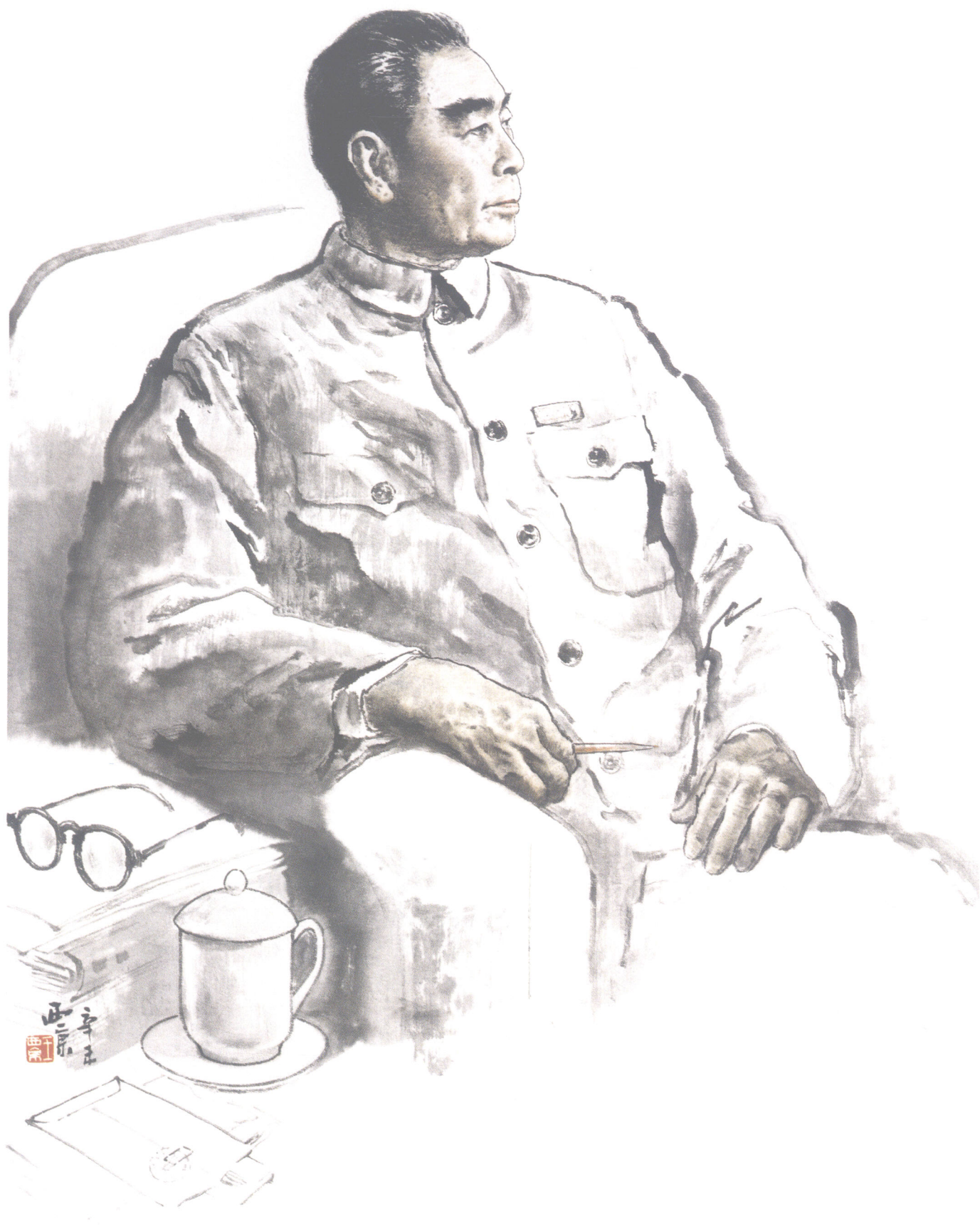
周总理像 Premier Zhou Enlai