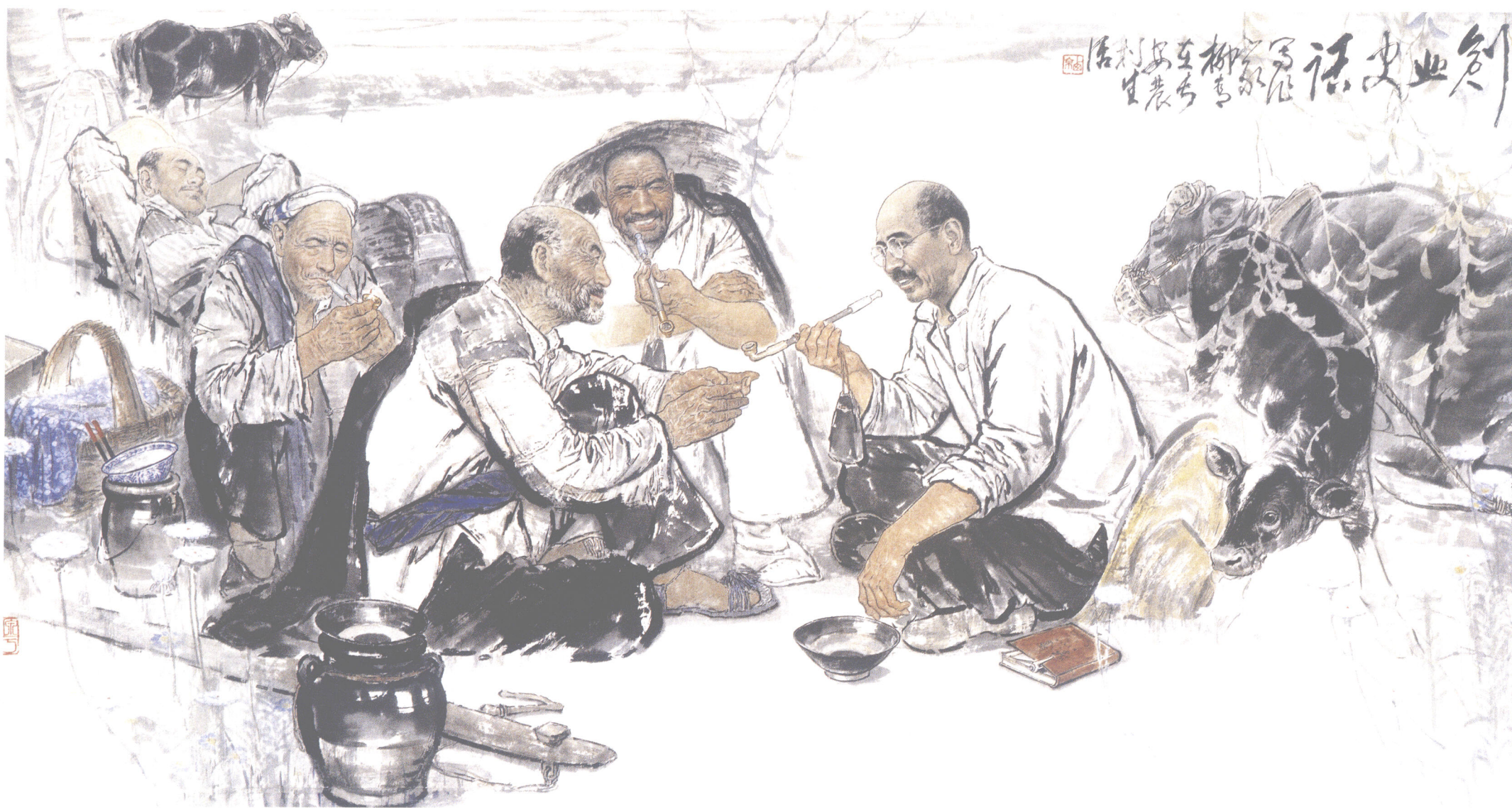
创业史话 Tale of Startups