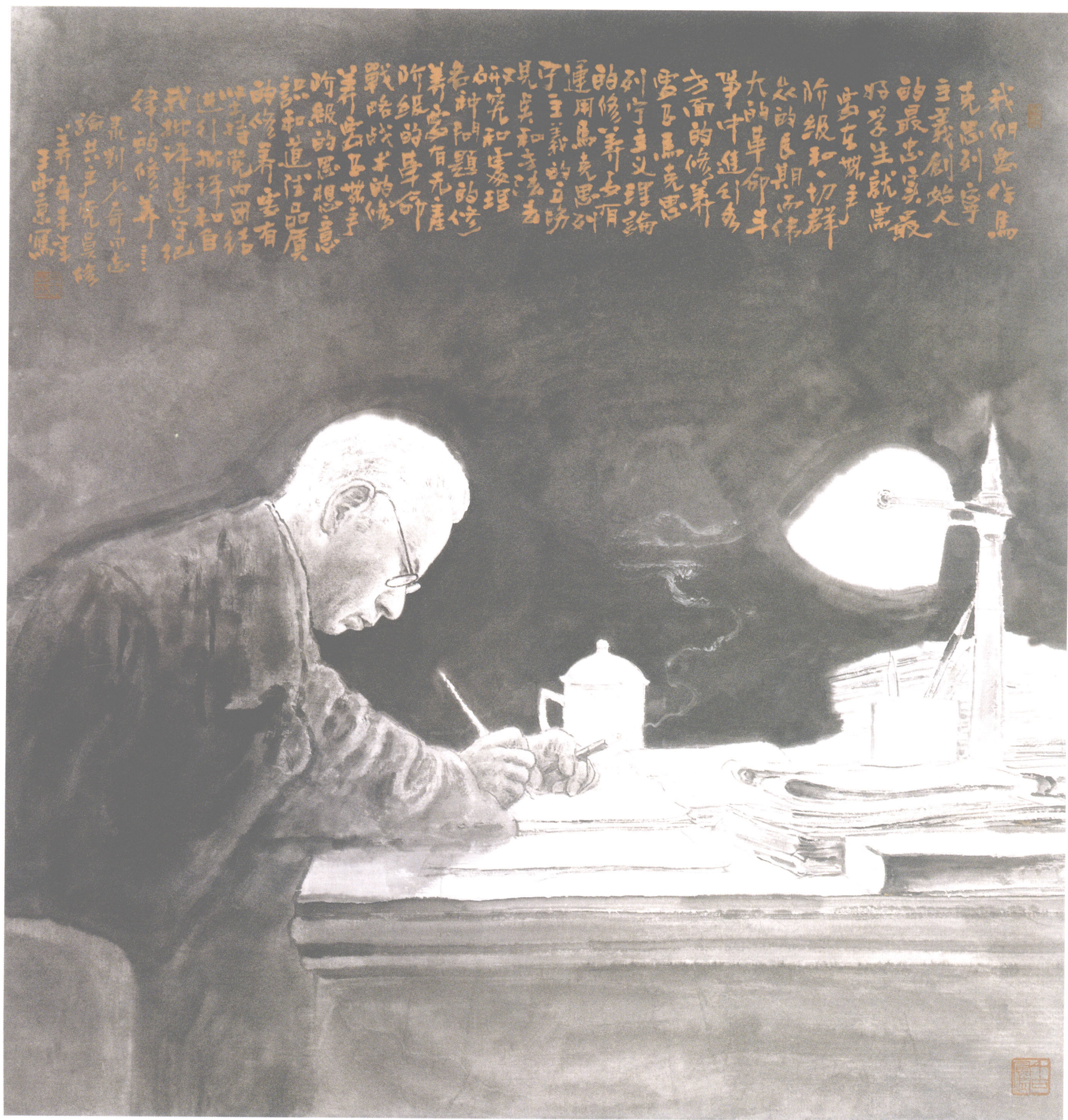
少奇同志 Liu Shaoqi