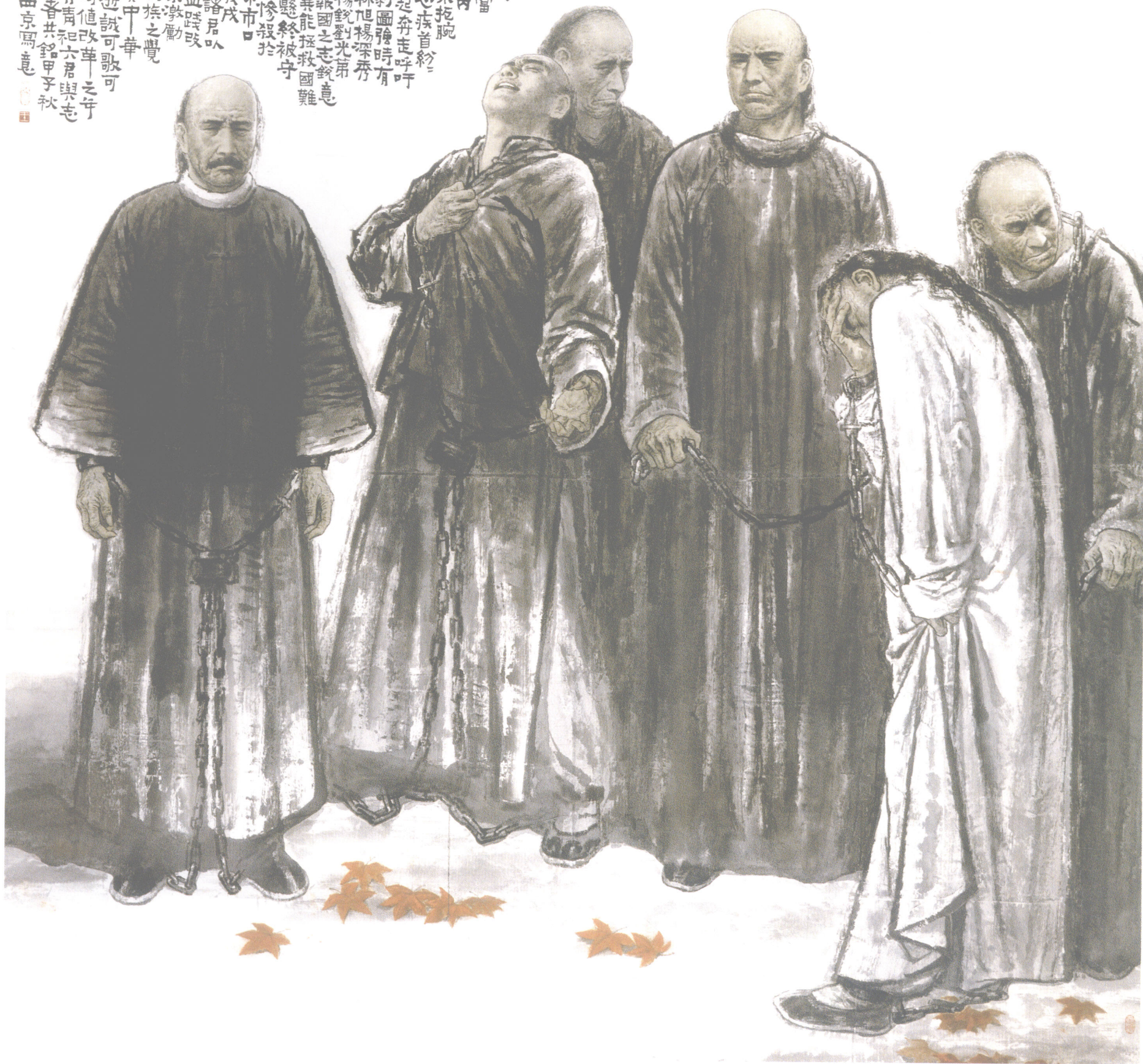
远去的足音 Fading Footfall

戊戌年中國艱危局內 政苛橫列強環伺 大明古國 歲手將傾於一旦 其時海內 志士莫不扼腕 裂臂而起奔走呼 變法維新圖強時有 譚嗣同林旭楊深秀 康廣仁楊銳劉光第 君壯懷報國之志銳意 改革冀能拯救國難 解民倒懸終被守 舊黨慘殺於 北京菜市口 史稱戊戌 六君子諸君以 身許國血踐改 革之業激勵 天下但民族之覺 醒氣貫中華 英魂不逝誠可歌可 泣也時值改革之年 調月青和六君與志 同者共銘甲子秋 西京馬意