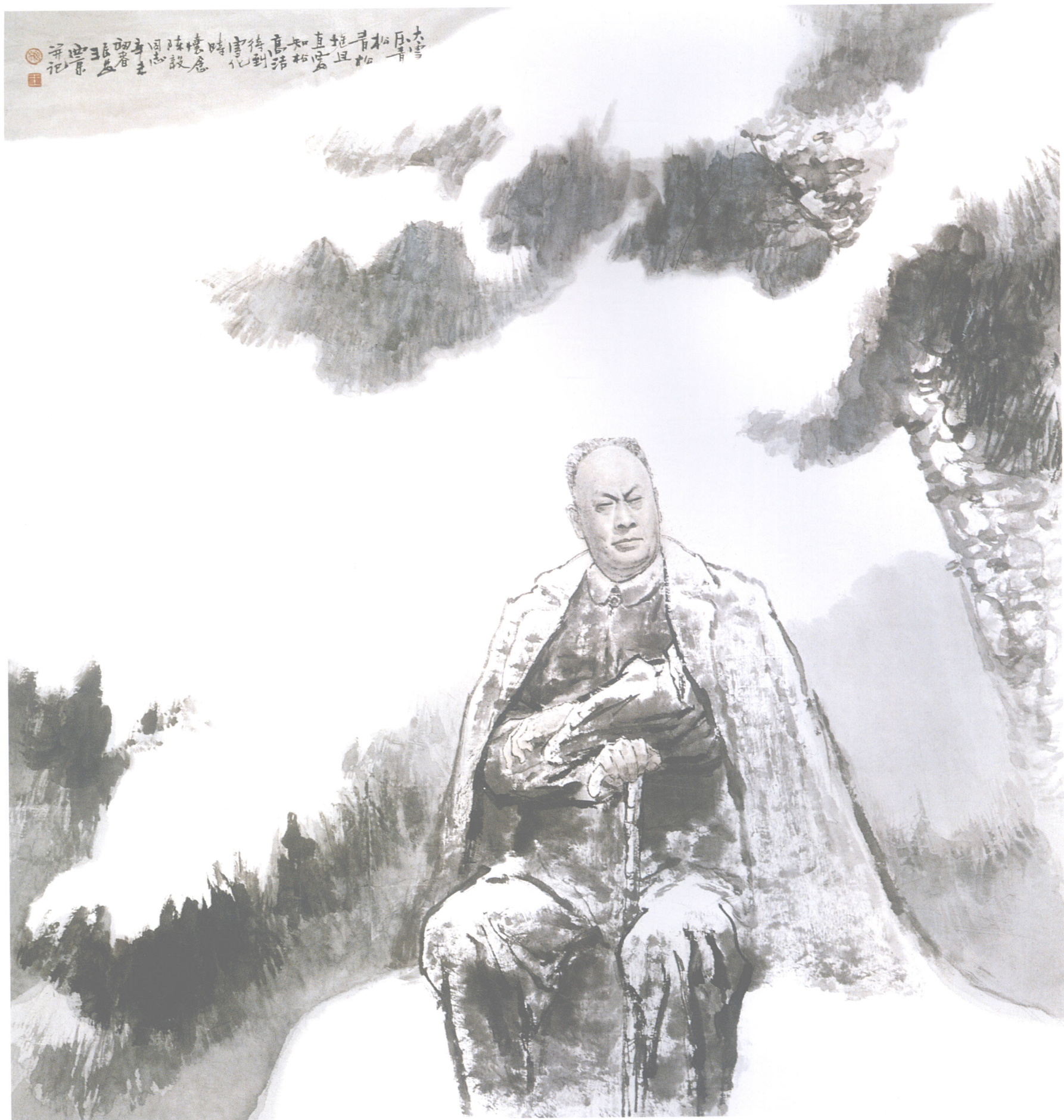
陈毅诗意 Poet Chen Yi