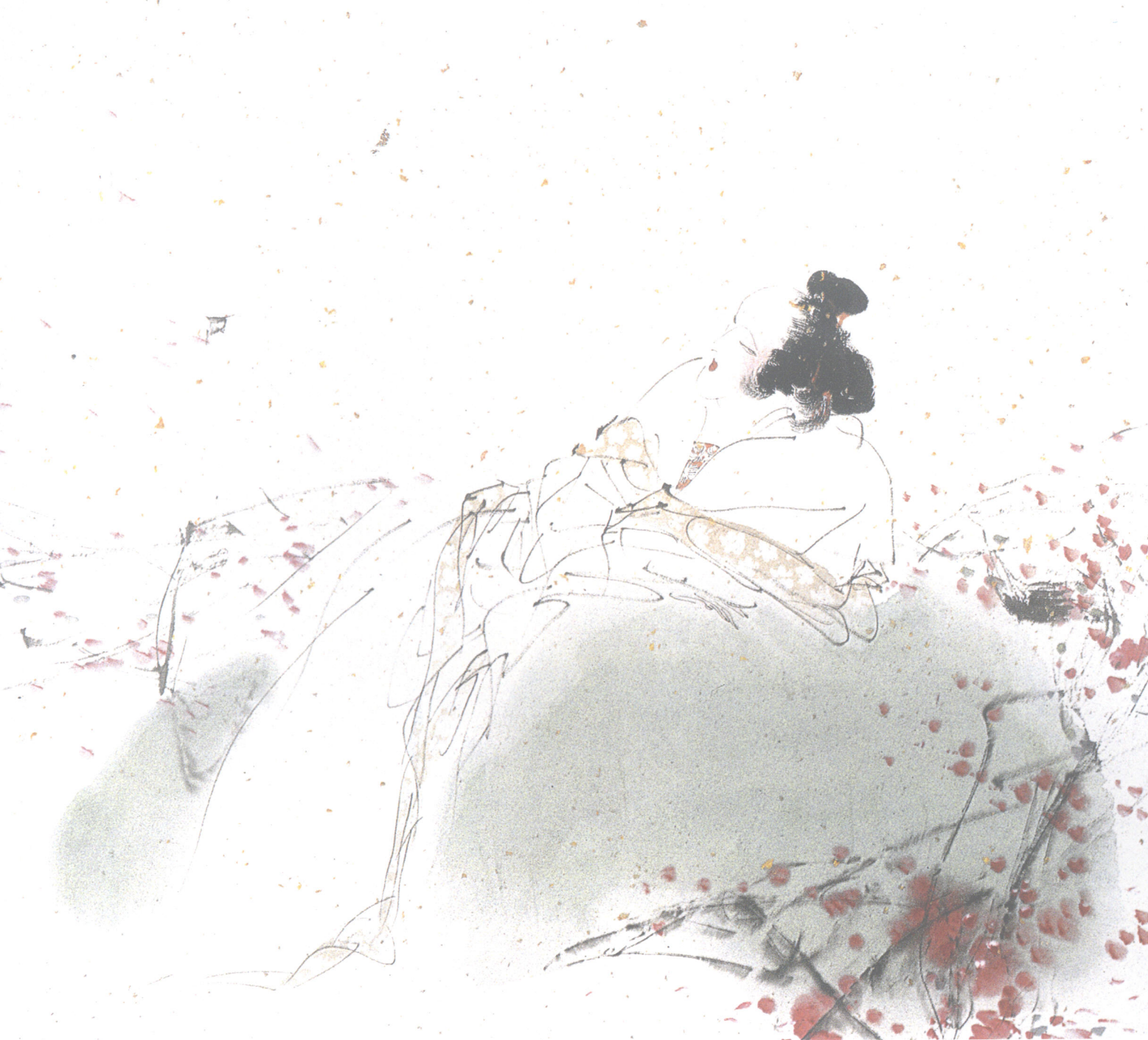
FIGURE PAINTING ALBUM OF WANG XIJING