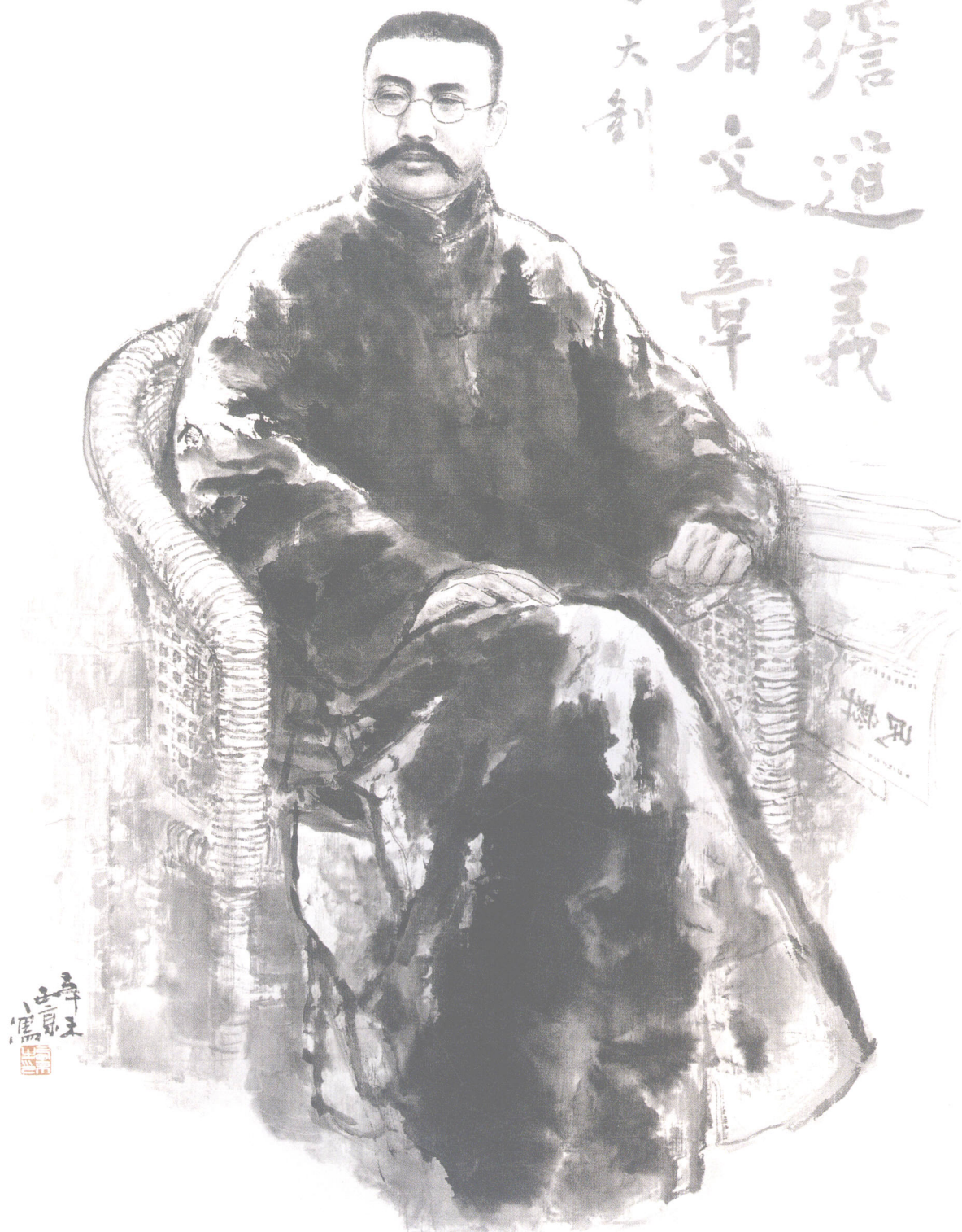
李大釗 Li Dazhao